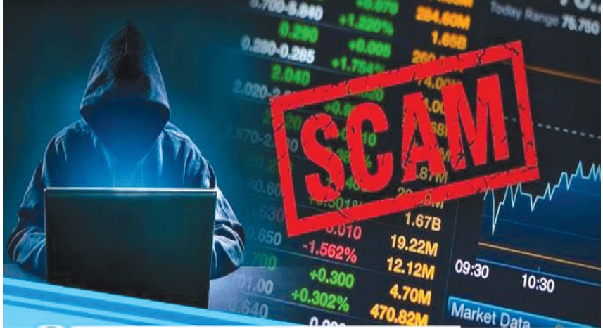
ફ્રોડની અન્ય બે ઘટનામાં ઓનલાઇન નાઈટી અને સસ્તામાં કાજુ બદામ ખરીદવાની લ્હાયમાં બે લોકોને લાગી ગયો ચૂનો

રાજકોટ તા. ૩ ઓનલાઇન ફ્રોડની ઘટનાઓ એક દિવસ પણ ન બને તેવું થતું નથી. વધુ આ પ્રકારના ફ્રોડની ઘટના સામે આવી છે જેમાં કોઈ નહિ તો આ વખતે સેલ્સટેક્સ ઈન્સ્પેક્ટર ભોગ બની ગયા છે અને ચોદ લાખ ગુમાવી દીધા છે. બીજી એક ઘટનામાં ઓનલાઇન નાઈટી મંગાવવાના ચક્રમાં વેપારીએ નાણા ગુમાવ્યા હતાં, તો ત્રીજી ઘટનામાં રીલ્સ જોઈ સસ્તામાં ઓનલાઇન કાજુ બદામ ખરીદવા જતાં એક વેપારીને દોઢ લાખનો ડામ આવી ગયો હતો. પ્રથમ ફ્રોડની વિગતો પર નજર કરીએ તો સુરતમાં રાજ્ય કર ભવનમાં સ્ટેટ ટેક્ષ ઈન્સ્પેક્ટરે શેર બજારમાં ઓનલાઇન રોકાણ કરવાના ચક્રમાં તેર લાખ નેવુ હજારની રકમ ગુમાવી છે. ઠગ ટોળકીએ તેઓને શેરબજારમાં ત્રીસ ટકા પ્રોફિટની વાત કહી હતી. ભોગ બનેલા અઢાવીસ વર્ષીય સ્ટેટ ટેક્ષ ઈન્સ્પેક્ટરે સાયબર ક્રાઈમમાં ફરિયાદ આપી છે. જેના આધારે પોલીસે ગુનો નોંધી તપાસ શરૂ કરી છે. સરચાણા ખાતે રહેતા સ્ટેટ ટેક્ષ ઈન્સ્પેક્ટરે પોતાના ઈન્સ્ટ્રાગ્રામ પર એક રિલ્સ જેમાં શેરમાર્કેટ જોતા હતા. રિલ્સની આપેલી લીંક કલિક કરતા વોટ્સએપ ગ્રુપમાં જોઈને થઈ ગયા હતા. જેમાં