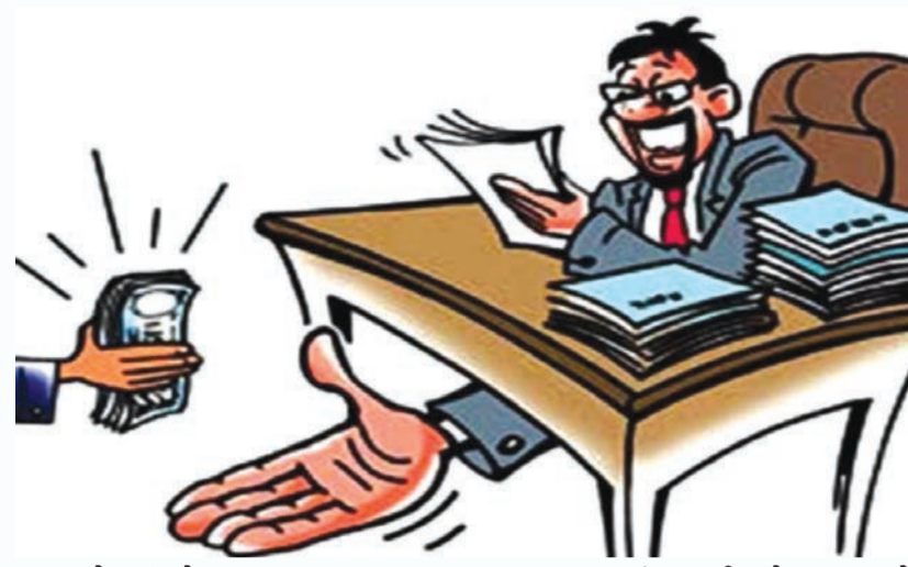
આવવાનો બાકી છે. આ ઓડિટમાં કોઈ ક્વેરી ન કાઢવા માટે આરોપી નંબર એક કે જેઓ વસઈ ગુપ્ત પ્રાથમિક શાળામાં આચાર્ય તરીકે ફરજ બજાવે છે તેઓએ ઓડિટરને રૂ. ૪૦,૦૦૦ આપવા માટે ડબોઈ તાલુકાના તમામ ગુપ્ત આચાર્ય

ટ્રેપ કરી ચાર આરોપીઓને ઝડપી પાડ્યા છે. પ્રાથમિક શાળામાં ફરજ બજાવતા એક ગુપ્ત આચાર્ય પાસેથી બે હજાર રૂપિયાની લાંચની માગણી કરવામાં આવી હતી. જે આપવા માગતા ન હોઈ તેમણે એન્ટી કર્પ્શન બ્યુરોમાં જાણ કરતાં આ સફળ ટ્રેપ ગોઠવી ચારને દબોચી લેવાયા હતાં. શાળાના વાર્ષિક ઓડિટમાં કોઈ ક્વેરી ન કાઢવા બદલ તમામ ગુપ્ત આચાર્યો પાસેથી બંબે હજારની માગણી કરવામાં આવી હતી. આ મામલે કૂલ ચાર આરોપી ઝડપાઈ ગયા છે અને હજુ એકનું નામ ખુલ્લું તેની પણ શોધખોળ થઈ રહી છે. જ્યારે એકની શોધખોળ હાથ ધરવામાં આવી છે. એસીબી સુત્રોએ જણાવ્યા અનુસાર ફરિયાદી ગુપ્ત આચાર્ય તરીકે પ્રાથમિક શાળામાં ફરજ બજાવે છે. જેઓની શાળામાં વર્ષ ૨૦૨૧-૨૨ના વર્ષનું ઓડિટ આરોપી નંબર પાંચ દ્વારા ગયા મહિનામાં કરવામાં આવેલું જેનો ઓડિટ રિપોર્ટ