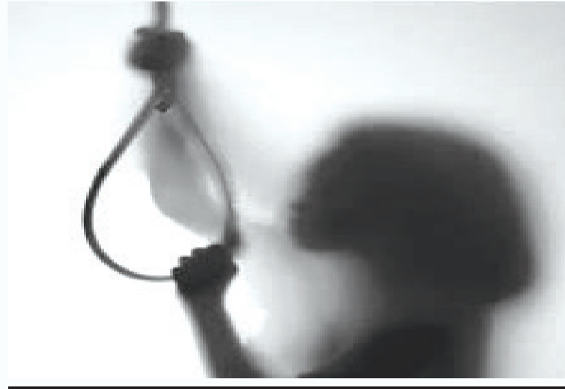
બીજી એક ઘટનામાં સેલ્સ એકઝીક્યુટીવ યુવાને મિત્રને વિડીયો કોલ કરી હું જાઉં છું કહી આપઘાત કરી લીધો!