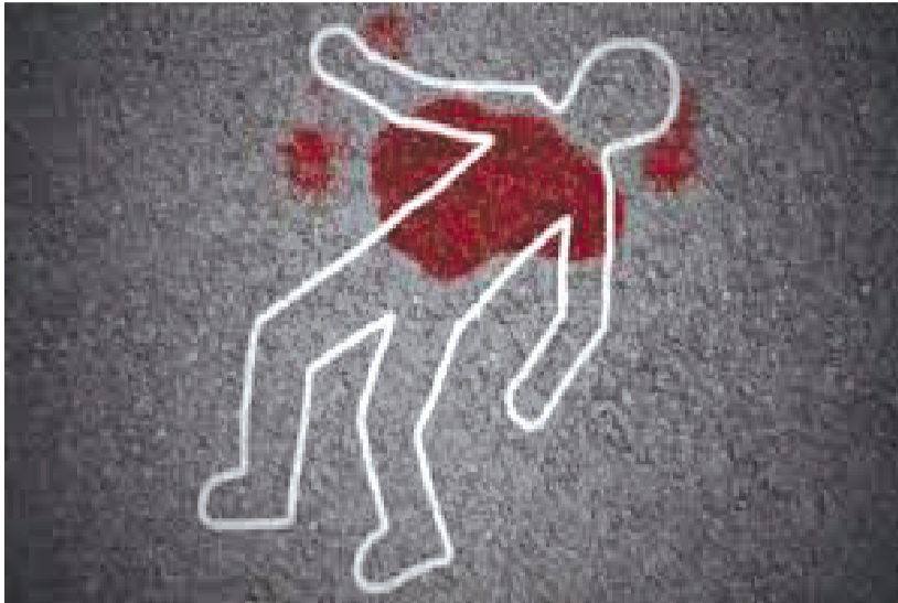
હિટ એન્ડ રનની જીવલેણ અકસ્માતની ઘટનામાં ભાગી જનાર કારચાલક પોલીસમેન નીકળ્યો: ધરપકડ