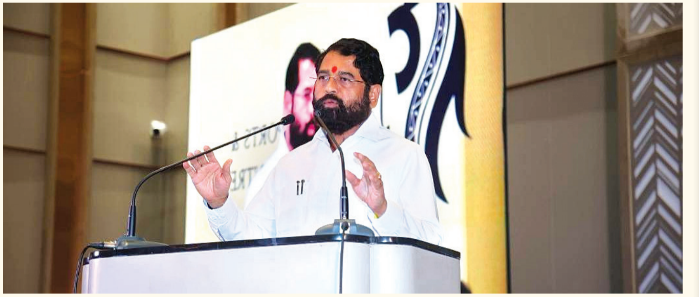
ઉદ્ભવ-રાજ મરાઠી ઓળખ પર સાથે

અહીં મોટો પ્રશ્ન એ છે કે શું શિવસેના ઉદ્ભવ જૂથને જય ગુજરાત કહેવાથી પણ કોઈ સમસ્યા છે? જ્યારે મામલો વધુ વકર્યો, ત્યારે શિંદે જૂથની શિવસેનાએ તેના સત્તાવાર ડેવિઝ પરથી ૫ સેકન્ડનો વીડિયો પોસ્ટ કર્યો, જેમાં ઉદ્ભવ પણ ભાજપના કાર્યકરોની હાજરીમાં તે જ રીતે જય ગુજરાત કહેતા જોવા મળે છે. કેપ્શનમાં લખ્યું હતું કે એક તરફ તેઓ છેતરપિંડી કરનારા છે, તો બીજી તરફ તેઓ તકવાદી છે! શિંદે જૂથના સાંસદ નરેશ મસ્કેએ આ અંગે કહ્યું કે આજનો કાર્યક્રમ ગુજરાતીઓ માટે હતો, તેથી જ અમારા નેતા એકનાથ શિંદેએ જય ગુજરાત કહ્યું. ઉદ્ભવ જૂથ આ અંગે હોબાળો મચાવી રહ્યું છે, ચાલો હું તમને એક વીડિયો બતાવું જેમાં ઉદ્ભવ ઠાકરે પોતે એક કાર્યક્રમમાં જય ગુજરાત કહી રહ્યા છે. ઉદ્ભવ ઠાકરે અને તેમની ઈનિસ્યુ ડબલ ડમ જેવું કામ કરી રહી છે. બીએમસીની ચૂંટણીઓ આવી રહી છે, તેઓ આ બધું નાટક ફક્ત મરાઠી મતદારોને આકર્ષવા માટે કરી રહ્યા છે. ગઈક શરદ પવાર જૂથના નેતા જિતેન્દ્ર આવડે મૌન રહ્યા છે, આ બધી વાતો એવા નેતા વિશે ન કહેવા જોઈએ જે આતંકવાદી ઇશરત જહાને ટેકો આપે છે.