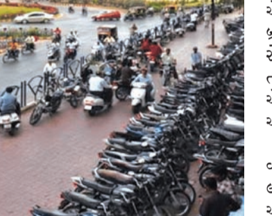
હાલ સાઈટ બ્રીજ નીચે, રૈયા સર્કલ નાણાવટી ચોક ઈસ્ટ બાજુ ઈન્દિરા સર્કલ રૈયા ટેલિકોન એન્કસચેન્જ સાઈટ બ્રીજ નીચે, સત્યસાઈ મેઈન રોડ, આત્મીય કોલેજ ગેટ સામે બ્રીજ નીચે, શ્રીજી હોટલ રોયલપાર્ક મેઈન રોડ બાજુ બ્રીજ નીચે, પંચાયત નગર ચોકમાં મનપાના પ્લોટ ઉપર કે.કે.વી. મહાલેવલ બ્રીજ, જયસીયારામ ચા વાળા રોડ ઉપર, ઈન્દિરા સર્કલ રૈયા ટેલિકોન

રાજકોટ, તા. ૪ રાજકોટ શહેરમાં હાલ પાર્કિંગ નો પ્રશ્ન તંત્ર અને પ્રજા માટે માથાનો દુખાવો બન્યો છે કારણ કે લોકોમાં પાર્કિંગ કરવા માટે જે સૂઝબૂઝ હોવી જોઈએ તે જોવા મળતી નથી એટલું જ નહીં અલગ અલગ વિસ્તારોમાં પે એન્ડ પાર્કિંગની જગ્યા વ્યવસ્થા ઊભી કરવામાં આવતી હોય છે પરંતુ શહેરીજનોને ન જીવી રકમ ચૂકવવી ન પડે તે માટે તેઓ અન્ય જગ્યાઓ પર પાર્કિંગ કરતા નજરે પડે છે. સામે પે એન્ડ પાર્કિંગના કોન્ટ્રાક્ટરો ને પણ આર્થિક નુકસાની થતી હોવાનું માલુમ પડ્યું છે હાલ વધતી ટ્રાફિક સમસ્યા અને પાર્કિંગની સુવિધા લોકો મેળવી શકે તે માટે ફરી એક વખત મહાનગરપાલિકાએ ૨૪ પાર્કિંગ માટે ટેન્ડર પ્રસિદ્ધ કર્યા છે. મહાનગરપાલિકા દ્વારા અલગ અલગ જગ્યાઓ ઉપર પે એન્ડ પાર્કિંગની વ્યવસ્થા માટે ત્રીજી વખત ટેન્ડર કરવામાં આવ્યું હોવાનું