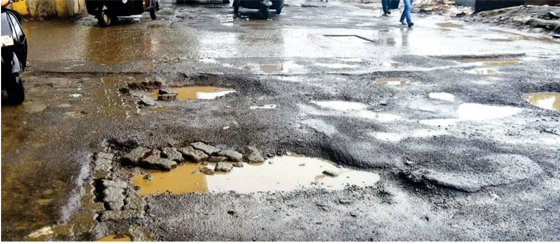
ટોચના અધિકારીઓને વરસાદની સિઝનમાં સ્થિતિ ચકાસવા માટે મેદાનમાં ઉતારવાનું વોર્ડમાં મુલાકાત લેવા અને રોડ રસ્તાની જણાવ્યું છે ત્યારે હવે આ આદેશના પગલે ૩૫૫ ડી મ્યુનિસિપલ કમિશનર કક્ષાના અધિકારીઓ ખાસ મેદાનમાં જઈ ખરી

રાજકોટ, તા. ૪ હાલ રાજકોટ શહેરના તમામ વોર્ડમાં લોકોને ભારે હાલાકીનો સામનો કરવો પડી રહ્યો છે ત્યારે તંત્ર ઉપર જે રીતે આંગળી સિંધાઈ રહી છે તેને જોતા હાલ મહાનગર પાલિકા દ્વારા તે તમામ વિસ્તારોના પ્રશ્નોનું નિકાલ આવે તે માટે ખાસ વોર્ડ કમિટીઓની રચના સત્તાધીશો દ્વારા કરવામાં આવી. પરંતુ આ કમિટી દ્વારા તેવા કોઈ નક્કર પગલા લેવામાં આવ્યા નથી અને એવી કોઈ વાત સત્તાધીશોના અધિકારીઓ સુધી પહોંચાડવામાં આવી નથી જેનાથી લોકોના પ્રશ્નોનું નિવારણ થઈ શકે. મહત્વની વાત એ છે કે જે વોર્ડ કમિટીની રચના થઈ છે તેની જે રીતે નોંધ લેવાવી જોઈએ તે પણ લેવાતી નથી પરંતુ હાલ વરસાદમાં રાજકોટ શહેરમાં ઘણા