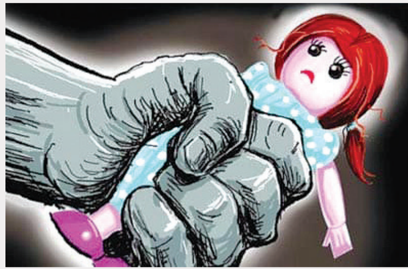
પાડતા ગુસ્સે થયેલી માતા ઉપાએ દીકરીને બે લાફા માર્યા અને ગળુ દબાવીને હત્યા કરી દીધી. દિકરીની હત્યા કર્યા બાદ આ જનેતાએ બનાવને ઢાંકપીછોડો કરવા પ્લાન ઘડી દીકરી

પર નજર કરીએ તો આ બનાવ અમદાવાદમાં એક માતાએ તેની સગી દીકરીને ગળુ દબાવીને મારી નાખી હોવાની ઘટના સામે આવ્યો છે. દીકરી એ માત્ર ઘરકામમાં મદદ ન કરતા તેણે ગુસ્સામાં આવીને દીકરીનું ગળુ દબાવી દીધું અને તેનું મોત થઈ ગયું હતું. આ સમગ્ર મામલામાં પહેલા તો મહિલાએ તેના પતિને કોલ કરીને દીકરી લાંબા સમયથી સૂતી છે અને કતી જ નથી એવું કહી ઘરે બોલાવ્યા. બાદમાં તેને હોસ્પિટલ લઈ જતા પોસ્ટમોર્ટમના રિપોર્ટ બાદ આખો મામલો સ્પષ્ટ થયો. સમગ્ર કિસ્સો જ્યારે પોલીસ સ્ટેશનમાં પોલીસ સામે આવ્યો ત્યારે પોલીસ પણ હચમચી ગઈ હતી. પોલીસ સૂત્રો પાસેથી મળતી માહિતી પ્રમાણે ઓઢવ વિસ્તારમાં છ વર્ષની બાળકી આજી બપોરે બાર વાગ્યે સૂલેથી ઘરે આવી હતી. બપોરે સાડા ત્રણેક વાગ્યે તેણીને મમ્મી ઉપાએ દીકરીને ચમચીના પેકીંગના કામ અને ઘરકામમાં મદદ કરવાનું કહ્યું પરંતુ, દીકરીએ કામ કરવાની ના