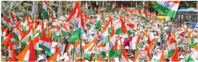
ઘેરાવ કાર્યક્રમ યોજાશે. આ કાર્યક્રમમાં ગુજરાત કોંગ્રેસના નેતાઓ ધારાસભ્ય જીજ્ઞેશ મેવાણી, સેવાદળના રાષ્ટ્રીય અધ્યક્ષ લાલજી દેસાઈ, ખેડૂતનેતા પાલ આંબલીયા સહિત અનેક વરિષ્ઠ નેતાઓ જોડાઈને આંદોલનને મજબૂત સહારો આપશે અને સૌરાષ્ટ્ર વાસીઓના જનહિતના મુદ્દે તંત્ર સામે કડક મુદ્દે અવાજ ઉઠાવશે. ગઈકાલે જ કેન્દ્રીય મંત્રી મનસુખ માંડવીયાએ પ્રથમ વખત નેશનલ હાઈવેના બિસ્માર હાલત અને આ મુદ્દે પીડાતા લોકોએ ઉઠાવેલા પ્રશ્નો અંગે નિવેદન આપ્યું છે. રાજકીય નિષ્ક્રિયાથી એક વર્ષ સુધી તેમના પોતાનાં

રાજકોટ, તા. ૫ હાલ રાજ્ય સરકાર અને કેન્દ્ર સરકાર સ્થાનિકોના પ્રશ્નોનું નિવારણ લાવવા માટે અનેકવિધ પગલાંઓ લઈ રહી છે એટલું જ નહીં કોઈ પણ શહેર અને જિલ્લાના વિકાસ માટે માળખાગત સુવિધા ઉભી કરવામાં આવે તે માટે હાલ વિવિધ પગલાંઓ લેવામાં આવતા હોય છે ત્યારે અત્યારે રાજકોટ જેતપુર હાઈવે નું કામ છે ગતિએ ચાલી રહ્યું છે તેનાથી વિરોધ પક્ષમાં ભારે ઉદાગો મર્યાદો છે અને સરકારને પણ અનેક વખત રજૂઆત કરવામાં આવી છે છતાં અધિકારીઓ દ્વારા મગનું નામ મરી પાડવામાં આવતું નથી ત્યારે ફરી એક વખત આ મુદ્દો વક્ર્યો હોવાનું જાણકાર વર્તુળો જણાવી રહ્યા છે. રાજકોટ-જેતપુર નેશનલ હાઈવે પર વાહનચાલકો પાસેથી થતી ગેરકાયદેસર ટોલ વસૂલાત, ઘોવાઈ ગયેલા અને બિસ્માર રસ્તાઓ અને કલાકોના ટ્રાફિક જામની મુદ્દે હાઈવે હક આંદોલન સમિતિ દ્વારા તારીખ ૮ જુલાઈ, ૨૦૨૫ના રોજ રાજકોટ કલેક્ટર કચેરી ખાતે