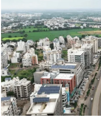
ભૂતકાળમાં ટાઉન પ્લાનિંગ વિભાગની જે કામગીરી જોવામાં આવી હતી અને જે ગતિએ કામ થતું હતું તે બાદ તત્કાલીન મ્યુનિસિપલ કમિશનર દ્વારા તેમાં જળમૂળથી ફેરફાર કરવામાં આવ્યો હતો પરંતુ મહત્વની વાત તો એ છે કે આજ દિન સુધી એ સ્થિતિમાં કોઈ ફેર પડ્યો નથી.

રાજકોટ, તા. ૫ જે સમયથી ટીઆરપી અધિકારીની ઘટના થઈ ત્યારબાદ ટાઉન પ્લાનિંગ વિભાગની કામગીરીમાં ઘણા બધા પ્રશ્નો ઊભા થયા છે એટલું જ નહીં તત્કાલીન મ્યુનિસિપલ કમિશનર દ્વારા પણ આ કામગીરીને ઝડપી બનાવવા માટે અનેક પગલાંઓ લીધા છતાં પણ તેમાં સફળતા મળી નથી. બીજી તરફ મહાનગરપાલિકાના ટાઉન પ્લાનિંગ વિભાગમાં ૨૪૯૬ નવા બિલ્ડીંગ પ્લાન મુકવામાં આવ્યા હોવાનું માલુમ પડ્યું છે જેમાંથી ૧૯૨૭ મંજૂર કરવામાં આવ્યા છે અને ૫૧૨ જેટલા જે પ્લાન છે તેને વિચારણા હેઠળ હાલ મૂકી દેવામાં આવ્યા છે. હાલ જે નવા અધિકારીની નિમણૂક થઈ છે તેને અમુક નિયમોની જાણકારી ન હોવાના કારણે આ કામગીરી અટકાવી હોવાનું પણ મનાઈ રહ્યું છે. એટલું જ નહીં બિલ્ડરોમાં પણ આ બાબતે ઘણો રોષ જોવા મળી રહ્યો છે. કારણ કે મહત્વની વાત તો એ છે કે આજ દિન સુધી એટલે કે જ્યારથી ટીઆરપી ઘટના થઈ ત્યારબાદ આ કામગીરીમાં ઘણા પ્રશ્નો ઊભા થયા છે.