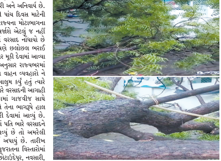
સૌરાષ્ટ્ર કલા કેન્દ્રમાં તોલિંગ વૃક્ષ થયું ધરાશય હાલ વરસાદી માહોલ વરચે વિવિધ વિસ્તારોમાં વૃક્ષ પડવાની ફરિયાદો આવી રહી છે ત્યારે ગઈકાલે સાંજે સૌરાષ્ટ્ર કલા કેન્દ્ર ૧૧ માં તોલિંગ વૃક્ષ તૂટી પડ્યું હતું કોઈ જાનહાની થઈ ન હતી પરંતુ આ અંગેની ફરિયાદ મળતા જ પીજીવીસીએલની ટીમ ઘટના સ્થળે પહોંચી સર્વપ્રથમ વીજ પુરવઠો ખોળવી દીધો હતો જેથી કોઈપણ પ્રકારની દુર્ઘટના ન થઈ અને તાકીદે જ વૃક્ષને હટાવવાની કામગીરી કરવામાં આવી હતી.

ત્યારે આગામી દિવસોમાં આ અંગે મહાનગરપાલિકા કોઈ યોગ્ય વ્યવસ્થા ઉભી કરે તે ખૂબ જરૂરી અને અનિવાર્ય છે. હવામાન વિભાગ દ્વારા આગામી પાંચ દિવસ માટેની આગાહી કરવામાં આવી છે જેમાં રાજ્યના મોટાભાગના વિસ્તારોમાં ભારે વરસાદી માહોલ સર્જશે એટલું જ નહીં છેલ્લા ૨૪ કલાકમાં ૨૦૪ તાલુકામાં વરસાદ નોંધાયો છે જ્યારે ગુજરાતના ૨૦ ડેમો સંપૂર્ણપણે છલોછલ ભરાઈ ગયા છે જ્યારે ૨૯ ડેમને હા એલર્ટ પર મૂકી દેવામાં આવ્યા છે. હવામાન વિભાગની આગાહી અનુસાર રાજ્યભરમાં વરસાદની સ્થિતિને ધ્યાને લઈ હાલ વાહન વ્યવહારો ને પણ બંધ કરવામાં આવ્યો હોવાનું માલુમ કર્યું હતું ત્યારે વિભાગે આગામી પાંચ દિવસ માટે ભારે વરસાદની આગાહી કરી છે જેમાં ગઈકાલે ૨૮ તાલુકામાં ગાજવીજ સાથે ભારે વરસાદ જોવા મળ્યો હતો અને તેના ભાગ્યપે હાલ યક્ષો તથા ઓરેન્જ એલર્ટ જાહેર કરી દેવામાં આવ્યું છે. આજે નવસારી અને વલસાડ જિલ્લામાં પતિ ભારે વરસાદને લઈ ઓરેન્જ એલર્ટ આપવામાં આવ્યું છે તો અમરેલી ભાવનગર જિલ્લાઓમાં યેલો એલર્ટ આપ્યું છે. તારીખ ૮ અને ૯ જુલાઈના રોજ દક્ષિણ ગુજરાતના વિસ્તારોમાં વરસાદનું જોર દેખાશે જેમાં દાહોદ, છોટાઉદેપુર, નવસારી, ડાંગ તથા વલસાડ જિલ્લામાં ગાજવીજ સાથે વરસાદ વરસ વિશે ત્યારે ૧૦ અને ૧૧ જુલાઈના રોજ ઉત્તર અને દક્ષિણ ગુજરાતના ૧૦થી વધુ જિલ્લામાં યેલો એલર્ટ આપવામાં આવ્યું છે. હાલ લોકોની એજ અપેક્ષા છે કે વરસાદ આવે ત્યારે જે પાણીનો ભરાવો થાય છે તે ન થાય અને તેનો યોગ્ય નિકાલ સરળતાપૂર્વક થઈ શકે જો આ કામગીરી કરવામાં તંત્ર સફળ થશે તો લોકોને પડતી મુશ્કેલી માંથી યોગ્ય રસ્તો પણ નીકળી શકશે.