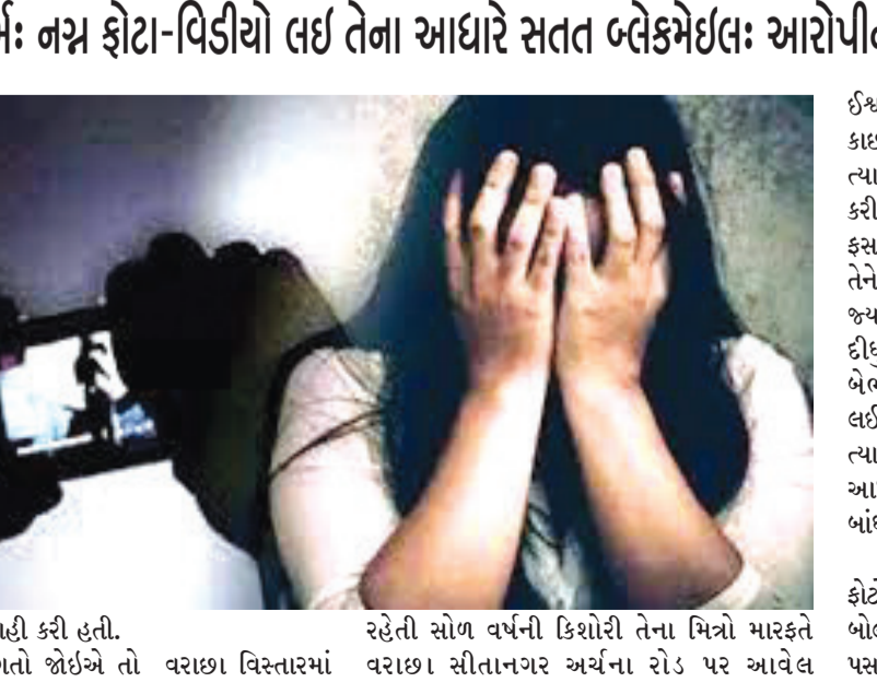
વિશેષ કાર્યવાહી કરી હતી. રહેતી સોળ વર્ષની કિશોરી તેના મિત્રો મારફતે વધુ વિગતો જોઈએ તો વરાછા વિસ્તારમાં વરાછા સીતાનગર અર્ચના રોડ પર આવેલ

લેવી પડી હતી. આ ચોંકાવનારી ઘટનાની વિગતો જોઈએ તો સુરતના વરાછા વિસ્તારમાં રહેતી એક સગીરા સાથે સોશિયલ મીડિયાથી સંપર્કમાં આવેલા યુવકે સગીરાને ઘેનયુક્ત પીણું પીવાડાવી બળાત્કાર ગુજાર્યો. યુવકે ફરવાના બહાને સગીરાને કાર્મ હાઉસમાં લઈ ગયો અને નશીલો પદાર્થ પીવાડાવી તે અર્ધબેભાન થઈ જતા તેના બીભસ્ત ફોટા પાડી અને વીડિયો ઉતારી લીધા હતા. ત્યારબાદ યુવકે સગીરાને આ ફોટો-વીડિયો વાયરલ કરવાની ધમકી આપી બ્લેકમેઇલ કરી અવારનવાર દૂષ્કર્મ ગુજાર્યું હતું. પોલીસ સુત્રોના કહેવા અનુસાર આરોપી યુવકના મિત્રએ પણ ઈન્સ્ટાગ્રામમાં મેસેજ કરી જો આ વાતને કોઈને જાણ કરશે તો જાનથી મારી નાખીશ એવી ધમકીઓ પણ આપી હતી. આખરે ભોગ બનનાર કિશોરીએ વરાછા પોલીસ મથકમાં ફરિયાદ નોંધાવતા પોલીસે બંને સામે ગુનો દાખલ કરી આરોપીની ધરપકડ કરી