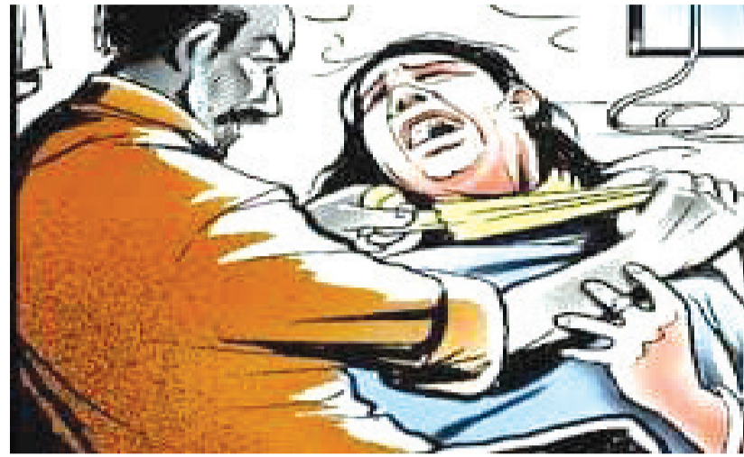
કલેશની આગે વધુ એક પરિવારનો માળો પીંખ્યો: ચાર વર્ષના દિકરાને ઝેર પાઈ મોતને ઘાટ ઉતારી જનેતાનો પણ આપઘાત