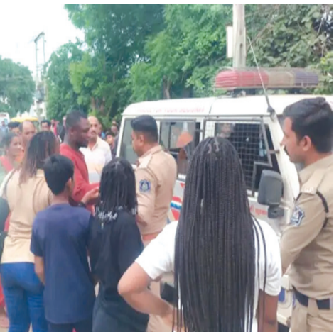
રજૂઆતમાં જણાવાયું છે કે કેટલીક યુનિવર્સિટીઓ પોતાનો નેક ગ્રેડ વધારવા આંતરરાષ્ટ્રીય ઈમેજ માટે વિદેશી છાત્રો લાવે છે પણ તેના કૌભાંડમાંથી ઉત્તરદાથીત્વથી દૂર રહે છે. આવા છાત્રો માટે ફરજિયાત યુનિવર્સિટીઓએ કેમ્પસમાં

જ રહેવાની હોસ્ટેલની સુવિધા ઉભી કરવી જોઈએ. આવા છાત્રો મોટે ભાગે ગવર્સિટી, રતનપર, બેડી, માધાપર ચોકડી, અટલ સરોવર વિસ્તારમાં ભાડે રહે છે. પોલીસો દ્વારા આવા લોકોના ગંદા વર્તનની ફરિયાદો થતી રહે છે. કોઈ જો આવા છાત્રોને ઠપકો આપે તો તેઓ તુરંત જ ગુપ્તમાં સંદેશ મોકલી બધાને એકઠા કરી દાદાખીરી પર ઉતરી આવે છે. રતનપરમાં આવુ જ થયું છે. રજૂઆતમાં આગળ જણાવાયું છે કે અમારી સ્પષ્ટ માંગ છે કે તમામ શંકાસ્પદ કલેટ, હોટલ, મકાનો પર તપાસ કરવી. ભાડા કરાર તેમજ વિદેશી-આફિકાના છાત્રો અને ગ્રામજનો વચ્ચે ઝપાઝપી, બોલાચાલી થતાં પોલીસ પહોંચી ગઈ હતી. ત્યાર બાદ બંને પક્ષ દ્વારા કુવાડવા રોડ પોલીસ મથકે રજૂઆત કરવામાં આવી હતી. રતનપર ગામે રહેતાં નિવૃત્ત આર્મી જવાનને જણાવ્યું કે તે પોતાના મોબાઈલ ફોનમાં વાત કરતા હતા ત્યારે મારવાડી કોલેજમાં અભ્યાસ કરતી એક છાત્રા અને એક છાત્ર નીકળ્યા હતા. આ બંનેને પોતાનો વીડીયો ઉતાર્યાની શંકા જતાં મોબાઈલ ફોન ઝૂંટવીને ભાગ્યા હતા. જેથી તેણે પીછો કાઢ્યો હતો. તેણે મોબાઈલ ફોનનો લોક પોલી આપતાં બંનેએ તેમાં પોતાના વીડીયો કે કોટા છે કે નહીં તે ચેક કર્યું હતું. ત્યારબાદ મારામારી ઝપાઝપી કરી હતી. આ બાબતે તેમણે કુવાડવા પોલીસને રજૂઆત કરી હતી. આ પછી પોલીસ કમિશનરે રજૂઆત થઈ છે.