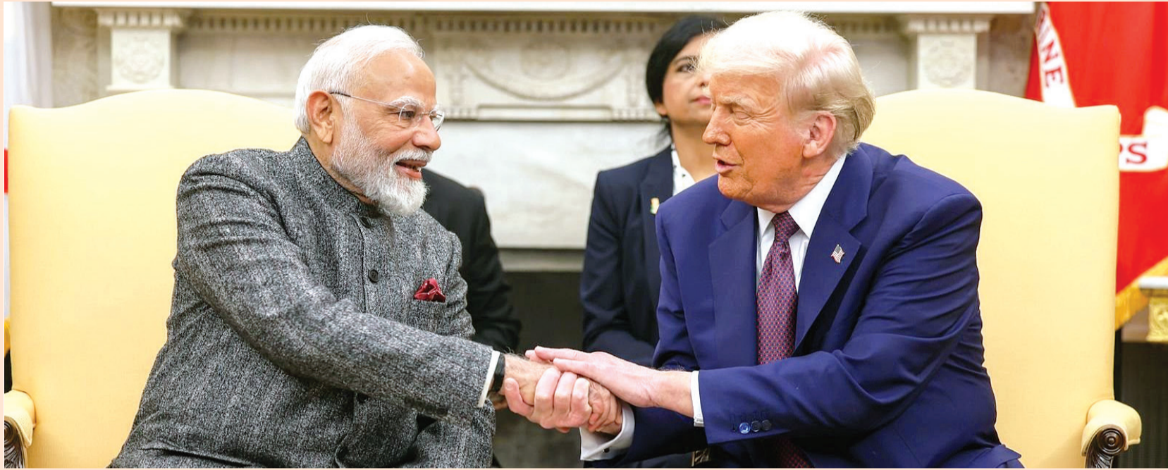
એ. આપણને ભારતમાં પ્રવેશ મળશે. વોશિંગ્ટન જેમાં ૧ ઓગસ્ટથી અમલમાં આવનારા આવી છે. નવી દિલ્હીને પારસ્પરિક ટેરિફ ટાળવા માટે અમેરિકા સાથે સોદો થવાની આશા છે. તે જ સમયે, ભારતે સંકેત આપ્યો છે કે તે વેપાર સોદામાં ઉતાવળ કરશે નહીં.

નવીદિલ્હી, તા. ૧૬ રાષ્ટ્રપતિ ડોનાલ્ડ ટ્રમ્પે સંકેત આપ્યો છે કે ભારત અને અમેરિકા વચ્ચે બહુપ્રતિષ્ઠિત વચગાળાના વેપાર કરાર પર ચાલી રહેલી વાટાઘાટો ટૂંક પર છે અને ટૂંક સમયમાં તેને અંતિમ સ્વરૂપ આપવામાં આવી શકે છે. ટ્રમ્પે કહ્યું કે પ્રસ્તાવિત કરાર અમેરિકા અને ઈન્ડોનેશિયા વચ્ચેના વેપાર કરાર મુજબ અમેરિકન કંપનીઓને ભારતીય બજારમાં વધુ સારી પહોંચ પ્રદાન કરી શકે છે. ભારત અને અમેરિકા આ વેપાર કરાર પર વાટાઘાટો કરી રહ્યા છે જેથી ટેરિફ ૨૦ ટકાથી નીચે રાખી શકાય. “અમારો ઈન્ડોનેશિયા સાથે કરાર છે... અમારી પાસે ઈન્ડોનેશિયા સુધી સંપૂર્ણ પ્રવેશ છે.” યુએસ રાષ્ટ્રપતિએ પત્રકારોને જણાવ્યું. અમેરિકી રાષ્ટ્રપતિએ કહ્યું કે તેમનું વહીવટીતંત્ર કેટલાક અન્ય વેપાર કરારોની જાહેરાત કરવા જઈ રહ્યું છે અને તેમણે આ સંદર્ભમાં ભારતનો પણ ઉલ્લેખ કર્યો. ટ્રમ્પે કહ્યું કે વેપાર કરાર હેઠળ, ઈન્ડોનેશિયા યુનાઈટેડ સ્ટેટ્સને એવા દેશમાં પ્રવેશ આપી રહ્યું છે જે આપણને પહેલાં ક્યારેય મળ્યો નથી. આ કદાચ કરારનો સૌથી મોટો ભાગ છે... ભારત મૂળભૂત રીતે તે દિશામાં કામ કરી રહ્યું