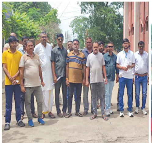
અસર પડે છે. આફિકન વિદ્યાર્થી ઉપર કાયદાકીય પગલાંથી અગ્રીમન વગર સ્વચ્છ કરતા તમામ લોકોને રહેવાની પરવાનગી ન આપી તમને ઘર ખાલી કરવાનું કહેવામાં આવે તેવી અમારી માંગણી છે.

રાજકોટ તા. ૧૬ રાજકોટ શહેરના મોરબી રોડ પર આવેલા રતનપરના ગામલોકોએ સરખંચ અને આગેવાનને સાથે રાખી પોલીસ કમિશનરને વિસ્તૃત રજૂઆત કરી વિદેશી છાત્રોની ગેરપ્રવૃત્તિઓ પર લગામ મુકવા માંગણી કરી હતી. રતનપર ગામના ગ્રામજનો અને સરખંચે કુવાડવા પોલીસમાં આફિકન વિદ્યાર્થીઓ વિરુદ્ધ ગંભીર આક્ષેપો સાથેની રજૂઆત કરી હતી. જેમાં ટૂંકા કપડા પહેરી બારે શેરીઓમાં આવવું, બહારથી દારૂ અને નશાના અન્ય પદાર્થો જેમ કે ગાંજા, ચરસ લાવી અહીં સેવન કરે છે. રતનપર વાસીઓ સાથે નશા ધુત હાલત માં જગડો કરે છે. કોઈ પણ પ્રકારના સરકારી અગ્રીમન વગર ભાડે મકાનમાં રહે છે તથા સરકારના મોડેલ ટેનન્સી એક્ટ ૨૦૨૧ મુજબ જ્યારે કોઈ વ્યક્તિ વિદેશી લોકોને મકાન ભાડે આપે ત્યારે નજીક ના પોલીસ સ્ટેશનમાં જાણ કરવાની હોય છે જે એક પણ મકાન માલિકે કરી નથી. આફિકન ફિમેલ વિદ્યાર્થી અહીં રહેણાક વિસ્તારમાં વેશ્યાવૃત્તિ કરે છે જે શરમજનક બાબત છે અને રતનપરમાં રહેતા તમામ સમાજ પર ખરાબ