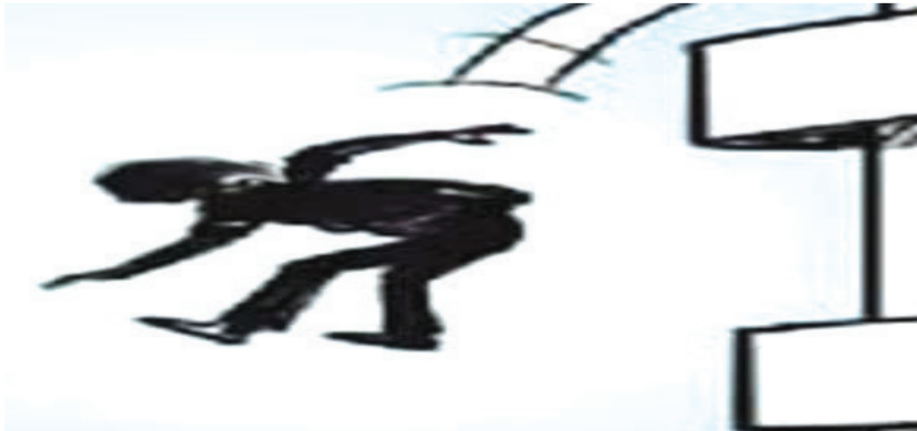
અન્ય કિસ્સામાં કંપનીની કર્મચારી ચુપતિનો સાથે કર્મચારીએ હાથ પકડી અડપલા કરી લીધા

પરંતુ તેણીને આ બાબતનું માહુ લાગી જતાં મોત વડાલુ કરી લીધું હતું. વિગતો પર નજર કરીએ તો ઘટના સુરતના ઓલપાડના સાંધીએર ગામની ચોદ વર્ષની કિશોરીએ પ્રેમ સંબંધ મામલે સાચાણ ખાતે રહેતા મામાના મકાનના ચોથા માળેથી ફૂટકો મારી આત્મહત્યા કરી હતી. વધુ માહિતી અનુસારસાંધીએર ગામે ચોદ વર્ષની કિશોરીને નજીકમાં રહેતા છોકરા સાથે અંગત મિત્રતા હોવાની જાણ તેણીની મમ્મીને થતાં તેણીએ સાચાણ ખાતે રહેતા તેના સગાભાઈને કરી હતી. જેથી કિશોરી તેની મમ્મી અને મામાએ સાંધીએર ખાતે સમજાવવા છતાં કોઈ ફરક પડ્યો ન હતો. જેથી મામા કિશોરીને સાચાણ ખાતે પોતાના ઘરે લઈ ગયા હતાં. ત્યાં બંનેએ કિશોરીને છેલ્લા એક અઠવાડિયા સુધી આત્મહત્યા ન કરવા કે કોઈ ખોટું પગલું ન ભરવા સમજાવી હતી. મામા અને મમ્મીએ તેણીને પાછા વળી જવા સમજાવી હોઈ