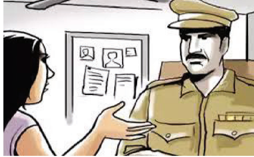
મારે ચપ્પલ લેવા છે મને રૂ. ૨૦૦ આપો. જેથી મને રૂ. ૨૦૦ આપતાં તે માધાપર ચોકડીથી કોઈ જગ્યાએ ચપ્પલ લેવા જવા નીકળી હતી.

વિસ્તારમાં રહેતી પોતાની સોળ વર્ષની સાળીને માધાપર ચોકડી આસપાસથી ભગાડી જતાં અને સાથે આ શપ્સ પોતાની નાનકડી દિકરીને પણ લઈ જતાં પોલીસે તપાસ શરૂ કરી છે. આ બનાવમાં ગાંધીગ્રામ પોલીસે અપહત સગીરાના માતાની ફરિયાદ પરથી કોઠારીયા રોડ હુડકો ચોકડી આશપુરા શેરી-૩માં રહેતાં સગીરાના બનેવી વિરુદ્ધ અપહરણનો ગુનો દાખલ કર્યો છે. મહિલાએ પોતાના જમાઈ વિરુદ્ધ ગુનો નોંધાવતા જણાવ્યું છે કે હું પરિવાર સાથે ગાંધીગ્રામ પોલીસ સ્ટેશનની હદમાં રહું છું. મારે ચાર સંતાન છે. જેમાં સોળ વર્ષની એક દિકરી છે. મને બહુપ્રેશનની બિમારી હોઈ જેથી હું અને મારી સોળ વર્ષની દિકરી અવાર-નવાર માધાપર ચોકડી ઓવરબ્રીજ નીચે પેટ્રોલ પંપ પાસે હવા ઉજાસ માટે બેસવા જતાં હતાં. રોજીદા કમ મુજબ ગત ૨૧/૫/૨૫ના બપોરે બારેક વાગ્યે અમે બંને માધાપર ચોકડીએ બેઠા હતાં ત્યારે બપોરે બે વાગ્યે મારી દિકરીએ કહેલું કે