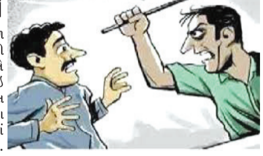
તેના ચાલકે બ્રેક મારતાં પોતે આ ટૂક પાછળ અથડાઈ ન જાય એ કારણે કાવો મારી આગળ જતાં આગળના ટૂકવાળાએ તેને કાવો મારવા મામલે ઝઘડો કરી ગાળો દઈ કહેવા મુજબ પોતે વડોદરાથી ટૂકમાં મેંદો ભરીને રાજકોટ આવવા નીકળ્યો હતો. બામણબોર પાસે પહોંચ્યો ત્યારે પૂલ યડતાં આગળના ટૂકને એક ગાય આડી આવી હોઈ ફરિયાદ નોંધવા કાર્યવાહી હાથ ધરાઈ હતી.

અજાણ્યા ટૂક ચાલકે ધોકાથી માર મારતાં તેના ચાલકે બ્રેક મારતાં પોતે આ ટૂક પાછળ અથડાઈ ન જાય એ કારણે કાવો મારી આગળ જતાં આગળના ટૂકવાળાએ તેને કાવો મારવા મામલે ઝઘડો કરી ગાળો દઈ કહેવા મુજબ પોતે વડોદરાથી ટૂકમાં મેંદો ભરીને રાજકોટ આવવા નીકળ્યો હતો. બામણબોર પાસે પહોંચ્યો ત્યારે પૂલ યડતાં આગળના ટૂકને એક ગાય આડી આવી હોઈ