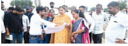
રાજકોટ, તા. ૧૯ કેબિનેટ મંત્રી ભાનુબેન બાબરીયાએ રાજકોટ જિલ્લા માર્ગ અને મકાન (સ્ટેટ) દ્વારા લોધિકા તાલુકા ખાતે મવડી, પાળ, રાવકી, માખવડ રોડ પરના નિર્માણાધિન બ્રિજનું નિરીક્ષણ કર્યું હતું. આ તકે કેબિનેટ મંત્રીએ અંદાજે રૂપિયા ૮ કરોડથી

અંદાજે રૂપિયા ૮ કરોડથી વધુના ખર્ચે મેજર બ્રિજ બનાવાથી મવડી, પાળ, રાવકી તથા લોધિકા તાલુકાના વાહનચાલકો માટે પરિવહન વ્યવસ્થા સુગમ બનશે : બ્રિજની કામગીરી નિયત થયેલા માપદંડો અનુસાર થાય તે સુનિશ્ચિત કરવા તાકીદ