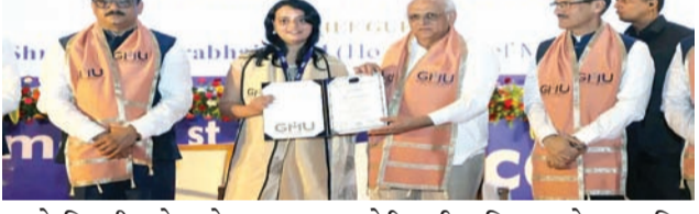
કારણે વિશ્વની અપેક્ષાઓ પણ ભારત પાસેથી વધી ગઈ છે ત્યારે દેશના મેરિટાઈમ સેક્ટરને નવી ઊંચાઈઓ સર કરાવવાનું દાયિત્વ આ સેક્ટરમાં પદાર્પણ કરી રહેલી યુવા શક્તિએ નિભાવવાનું છે તેમ તેમણે ઉમેર્યું હતું. વડાપ્રધાન નરેન્દ્રભાઈ મોદીએ એલ.એલ.એમ. વિદ્યાશાખાના ૧૮૮ અને એમ.બી.એ.ના ૬૨ વિદ્યાર્થી

રાજકોટ, તા. ૧૯ મેરિટાઈમ સેક્ટરમાં કારકિર્દી શરૂ કરનારા યુવાઓ રાષ્ટ્રહિત અને આપણી સામુદ્રિક વિરાસતની પ્રતિષ્ઠાના સંવર્ધન-સંરક્ષણના વિચાર સાથે કર્તવ્યરત રહે તેવું પ્રેરક આહવાન મુખ્યમંત્રી ભૂપેન્દ્ર પટેલે કર્યું છે. ગુજરાત મેરિટાઈમ યુનિવર્સિટીના પ્રથમ દિક્ષાંત સમારોહના દિક્ષાંત પ્રવચનમાં મુખ્યમંત્રી કહ્યું કે, આજે મેરિટાઈમ સેક્ટરમાં અપાર અવસરો છે અને આ સેક્ટર માટે ભારત યુવક ઝડપથી અગ્રણી ટેલેન્ટ પૂલ સર્જવાયર બની રહ્યું છે. એટલું જ નહિ, વડાપ્રધાન નરેન્દ્રભાઈ મોદીના કુશાલ નેતૃત્વને