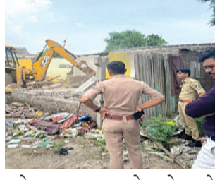
માટે અસામાજિક તત્વોના ગેરકાયદે દબાણો તોડી પાડવા, વિજ કનેક્શન કપાવી નાખવા સહિતની કડક કાર્યવાહી શહેર પોલીસ કરે છે. આ અંતર્ગત પ્ર.નગર પોલીસ સ્ટેશન હેઠળના પોપટપરાના નાલા પાસે જેલ

રાજકોટ, તા. ૧૯ રાજ્યભરમાં કાયદો વ્યવસ્થા જળવાઈ રહે અને છાપેલા કાટલા સમાન ગુનેગારો અંકુશમાં રહે તે માટે આવા ગુનેગારો કે જેમણે ગેરકાયદે બાંધકામો બંધ કરી દીધા હોય તે તોડી પાડવાની કાર્યવાહી રાજ્યના પોલીસવાહીની સુચના અનુસાર અને ગૃહવિભાગના આદેશથી રાજ્યભરની પોલીસ કરતી હોય છે. દરમિયાન વધુ એક વખત પ્ર.નગર પોલીસે બુલડોઝર ફેરવ્યું હતું. કાયદો વ્યવસ્થાની પરિસ્થિતિ જળવાઈ રહે અને લોકોમાં સુરક્ષા, સલામતિ અનુભવાય તે માટે અસામાજિક તત્વોના ગેરકાયદે દબાણો તોડી પાડવા, વિજ કનેક્શન કપાવી નાખવા સહિતની કડક કાર્યવાહી શહેર પોલીસ કરે છે. આ અંતર્ગત પ્ર.નગર પોલીસ સ્ટેશન હેઠળના પોપટપરાના નાલા પાસે જેલ