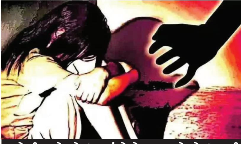
પડોશી ઢગો જોઈ જતાં તેણે પણ બ્લેકમેઇલ કરી બાળા સાથે બળજબરી આચરી: બંનેની ધરપકડ

રાજકોટ, તા. ૨૧ હવખસોર વિકૃતીઓ શૈતાનીચત આચરવાથી અટકતા જ નથી. આ પ્રકારની ઘટનાઓ સતત સામે આવતી જ રહે છે. ઘણીવાર તો સગો બાપ દિકરીનો દેહ પીંખી નાખતો હોવાના કિસ્સા પણ સામે આવે ચુક્યા છે. દરમિયાન એક બળભંગાટ મચાવતા હવખસોરીના બનાવમાં બાર વર્ષની બાળાનો દેહ સગા કાકાએ પીંખી નાખ્યો હતો. આ કૃત્ય આચરતા આ ઘટના પડોશી જોઈ ગયો હોઈ બાદમાં તેણે પણ બ્લેકમેઇલ કરી બાળા સાથે જબરદસ્તી આચરી લીધી હતી. બાળા સાથે વારંવાર બંનેએ બળજબરી આચરી લીધી હતી. અંતે બાળાએ માતાને વાત કરતો પોલીસ સુધી ઘટના પહોંચી હતી અને બંને હવખસોરને દબોચી લેવાની કાર્યવાહી હાથ ધરવામાં આવી હતી. દૂષ્કર્મની આ ઘટના પર નજર કરીએ તો વડોદરા શહેરના દાંડિયા બજાર વિસ્તારમાં રહેતા સગા કાકા અને અન્ય એક પડોશી શખસે બાર વર્ષીય કિશોરી પર વારંવાર દુષ્કર્મ ગુજાર્યું હતું. સગા કાકા અને પડોશીની વારંવાર શરીરસંબંધ બાંધવાની માંગણીથી કંટાળીને દીકરીએ માતાને જાણ કરતા માતાના પગ નીચેથી જમીન સરકી ગઈ હતી. આ મામલે માતાએ રાવપુરા પોલીસ સ્ટેશનમાં ફરિયાદ નોંધાવતા પોલીસે બંને આરોપીની ધરપકડ કરી વધુ તપાસ શરૂ કરી છે. વડોદરા શહેરના વિસ્તારમાં રહેતા ચાલીસ વર્ષીય અપરિણીત કાકાએ તેનીબાર વર્ષની ભત્રીજી પર દાનત બગાડી હતી. ભત્રીજીને અલગ-અલગ બહાને ઘરમાં બોલાવી વારંવાર દુષ્કર્મ ગુજારતો હતો. આ દરમિયાન તેના પડોશીમાં રહેતો પરિણીત શખસ બંનેને શરીરસંબંધ બાંધતા જોઈ ગયો હતો. જેથી પડોશીએ પણ કિશોરીને બ્લેકમેઇલ કરવાનું શરૂ કર્યું હતું. જો તેને શરીર સંબંધ બાંધવા ન દે તો તેના પરિવારના સભ્યોને આ બાબતની જાણ કરી દેશે તેવી ધમકી આપતો હતો. જેથી આખરે માતા સહિતના પરિવારના