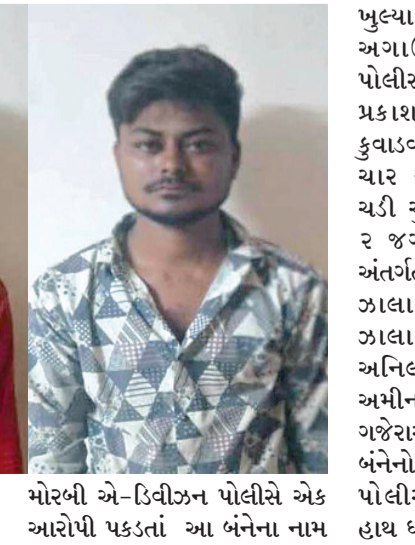
રિક્ષામાં મુસાફરોને બેસાડી ચોરી કરવાના ગુનામાં ફરાર હતાં.