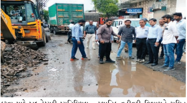
કરવા માટે ખુદ ડેપ્યુટી મ્યુનિસિપલ કમિશનર કિલ્ડ વિઝીટ કરી રહ્યા છે અને ચાલતા કામમાં વપરાતી ચીજ વસ્તુઓનું પણ અવલોકન કરે છે. પ્રભાવી મંત્રી દ્વારા યોજાયેલી બેઠકમાં મહાનગરપાલિકા અને

રાજકોટ, તા. ૨૧ રાજકોટ મહાનગરપાલિકા દ્વારા હાલ સમગ્ર શહેરમાં જે રોડ રસ્તાની સ્થિતિ બરાબ થઈ ચૂકી છે તેને સરખી કરવા માટે હાલ વિવિધ કામગીરી હાથ ધરવામાં આવી અને આ કામગીરીની દેખરેખ પણ મહાનગરપાલિકાના ટોચના અધિકારીઓ તથા કર્મચારીઓ કરી રહ્યા છે ત્યારે મહાનગરપાલિકા માટે હાલ ઈસ્ટ ઝોન જાણે સૌથી વધુ કેવરિટ હોય તેવું પણ માનવામાં આવે છે જેની પાછળનું એક કારણ એ પણ છે કે હાલ આ વિસ્તારમાંથી અનેકવિધ ફરિયાદો પણ ઉઠવા પામી હતી ત્યારે ઈસ્ટ ઝોન વિસ્તારના તમામ વોર્ડમાં કામગીરી યોગ્ય રીતે થાય છે કે કેમ તેની ચકાસણી