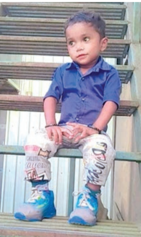
એક ઘટનામાં રમી રહેલા ૪ વર્ષના બાળક પર લોખંડની ચેનલ મોત બનીને ત્રાટકી: લાડકવાયાના મોતથી પરિવારમાં કલ્પાંત

ગોંડલ જતી વખતે આ બનાવ બન્યો હતો. મોરીધરા પરિવારે મોલી ગુમાવી દેતાં શોકની કાલીમા છવાઈ ગઈ હતી. હિટ એન્ડ રનની બીજી જીવલેણ ઘટના જોઈએ તો કુવાડવા નજીક રાજકોટ અદ્યવાદ હાઈવે પર માલિયાસણ બ્રીજ પાસે આ બનાવ બન્યો હતો. જેમાં એક પ્રૌઢનું કોઈ વાહનની ઠોકરે ચડી જતાં મોત થયું હતું. જાણવા મળ્યા મુજબ માલિયાસણ બ્રીજ પાસે અજાણ્યા આશરે પચાસ વર્ષના પ્રૌઢને કોઈ વાહનનો ચાલક ઠોકરે લઈ ભાગી જતાં ઘટના સ્થળે જ તેમનું મોત થયું હતું. બનાવની જાણ ૧૦૮ મારફત થતાં કુવાડવા પોલીસના સ્ટાફે પહોંચી જરૂરી કાર્યવાહી કરી મૃતદેહને પોસ્ટમોર્ટમ માટે ખસેડ્યો હતો. મૃતકની ઓળખ મેળવવા પોલીસે તપાસ હાથ ધરી છે. મૃતદેહને સિવિલ હોસ્પિટલ ખાતે રાખવામાં આવ્યો છે. તસ્વીરમાં દેખાતા મૃતકના સગા સંબંધી હોય તો પોલીસનો સંપર્ક કરવા જણાવવાયું છે.