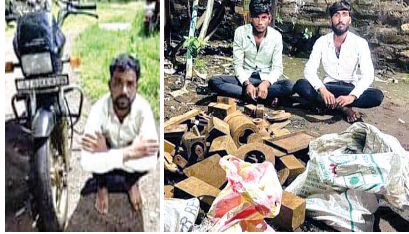
પકડી લઈ ત્રણેય પાસેથી ચોરાઈ માલસામાન રૂ. ૩,૫૫,૫૦૦નો કબ્જે કર્યો હતો. જ્યારે ચોથા આરોપી તરીકે રાજકોટના શપ્સનું નામ ખુલ્યું હતું. આ ચોરેયને મોજશોબ માટે ભંગાર ચોરવાનો પ્લાન થી ગોડાઉનમાં ત્રાટકી ચોરી કરી હતી. આ માલસામાન સગવળે કરવા અને વેચવા માટે તે મવડી ઓવર શ્રીજ નીચે પાર્કિંગમાં લઈ ગયા હતાં. જો કે માલ સગવળે થાય કે વેચાય એ પહેલા પોલીસે દબોચી લીધા હતાં.