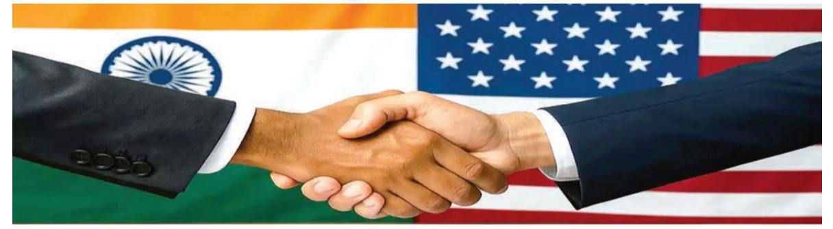
ચીન સાથે ટ્રેડ વાતચીત અધ્યક્ષતા

જાપાની પ્રતિનિધિમંડળ લાંબા સમયથી ટ્રમ્પ દ્વારા મુક્તિ દિવસ પર જાહેર કરાયેલા ૨૪% ટેરિફમાં ઘટાડો કરવા માંગ કરી રહ્યું હતું, જે તેમના દેશ-વિશિષ્ટ “પારસ્પરિક” ટેરિફમાંથી એક હતું, પરંતુ ઓટોમોબાઈલ પર અલગથી લાદવામાં આવેલા ૨૫% ડ્યુટીએ વાટાઘાટોને પાટા પરથી ઉતારી દીધી. જાપાનના વડા પ્રધાન શિગેરુ ઇશિબાના જણાવ્યા અનુસાર, જાપાનના ઓટોમોબાઈલ ડ્યુટી - જે એક અલગ ટેરિફ શેડ્યુલનો ભાગ છે - કોઈપણ આયાત ક્વોટા વિના ૨૫% થી ઘટાડીને ૧૫% કરવામાં આવશે. યુએસ ટ્રેડ રિપ્રેઝન્ટેટિવના ડેટા અનુસાર, ૨૦૨૪ માં જાપાન સાથે યુએસના માલસામાનનો વેપાર ૨૨૭.૯ બિલિયનનો હતો. નોંધપાત્ર રીતે, જાપાની ઓટોમોટિવ ક્ષેત્ર અમેરિકા સાથેના તેના ૬૩ બિલિયનના વેપાર સરવલસનો મુખ્ય ભાગ રહ્યો છે.