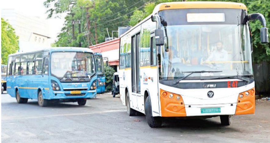
રાજકોટ મહાનગરપાલિકાની હસ્તાંતરિત કંપની રાજકોટ રાજપથ લી. દ્વારા સીટી બસ તથા બી.આર.ટી.એસ. બસનું સંચાલન કરવામાં આવે છે. હાલ સી.એન.જી. અને ઈલેક્ટ્રિક બસ દ્વારા શહેરી પરિવહન સેવા પૂરી પાડવામાં આવી રહેલ છે. રાજકોટ મહાનગરપાલિકાના કમિશનર તુષાર સુમેરોની સુચના અને નાયબ યુનિસિપલ કમિશનર મનીષ ગુરવાનીના માર્ગદર્શન હેઠળ રાજકોટ રાજપથ લી. દ્વારા બસ ચેકિંગ માટેની ડ્રાઈવ યોજવામાં આવી, જેમાં સબબ પકડાયેલ કુલ ચાર કંડક્ટરોને ફરજમુક્ત કરવામાં આવ્યા છે તથા ટીકીટ વગર મુસાફરી કરતા બે પેસેન્જર પાસેથી

ટીકીટ વગર મુસાફરી કરતા બે પેસેન્જર પાસેથી વસૂલાયો દંડ : નાયબ પ્રિન્સિપલ કમિશનરે કર્યું સરપ્રાઈઝ ચેકિંગ