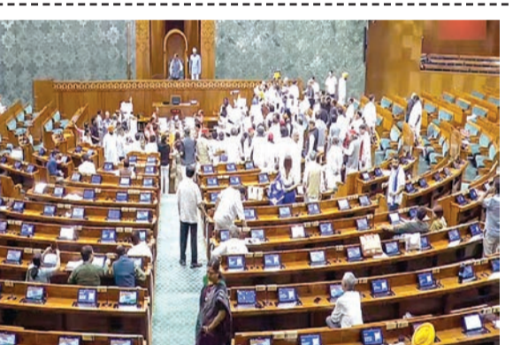
સશક્ત બનાવવા માટે એક બિલ. સંસદીય સમિતિઓ, વિદેશ બાબતોની સ્થાયી સમિતિ અને જાહેર હિસાબ સમિતિ, તેમના અગાઉના સૂચનો પર સરકારના પ્રતિભાવ પર તેમના અહેવાલો રજૂ કરશે.

સોમવારે ઓપરેશન સિંદૂર પર પણ ચર્ચા કરશે. બે મહત્વપૂર્ણ બિલ - ગોવા રાજ્યના વિધાનસભા મતવિસ્તારોમાં અનુસૂચિત જનજાતિના પ્રતિનિધિત્વનું પુનર્ગઠન બિલ અને મર્ચન્ટ શિપિંગ બિલ, ૨૦૨૪ - લોકસભાના કાર્યક્રમમાં સૂચિબદ્ધ હતા. લોકસભા દ્વારા બહાર પાડવામાં આવેલી કાર્યસૂચિમાં કહેવામાં આવ્યું છે કે, "અનુસૂચિત જનજાતિના સભ્યોના લોકશાહી પ્રતિનિધિત્વના હેતુ માટે બંધારણના અનુચ્છેદ ૩૩૨ હેઠળ બેઠકોના અનામતની જોગવાઈ કરવા અને ગોવા કે યુપીઆઈ સતત નવી ઊંચાઈઓને સંસ્થાઓને સબસિડી આપી રહી છે. ચોક્કસ સમુદાયોના સમાવેશને કારણે અને તેની સાથે જોડાયેલા અથવા આકસ્મિક ભાવનો માટે બેઠકોના પુનર્ગઠન માટે રાજ્ય વિધાનસભાને