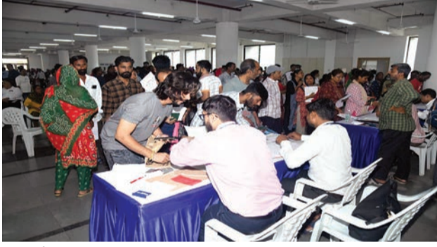
કરવામાં આવ્યા હતા. આંત્તરિક યુનિવર્સિટી ખાતે મુખ્ય કાર્યક્રમ સાથે તમામ લાભાર્થીઓ સરળતાથી ભારતીય નાગરિકતાના પ્રમાણપત્ર મેળવી શકે તે માટે છે તેબલની વ્યવસ્થા કરવામાં આવી

રાજકોટ, તા. ૨૫ પાકિસ્તાનથી વિસ્થાપિત થઈને કચ્છ, મોરબી તથા રાજકોટ જિલ્લામાં વસેલા અને ભારતીય નાગરિકતા પ્રાપ્ત કરનારા ૧૮૫ લોકોએ આજે કંઈક આવા જ શબ્દોમાં પોતાની લાગણીઓ અને વિચારો વ્યક્ત કર્યા હતા. રાજકોટ જિલ્લા કલેક્ટર ડી. ઓમ પ્રકાશના નિર્દેશ, નિવાસી અધિક કલેક્ટર એ.કે.ગોતમના માર્ગદર્શન હેઠળ યોજાયેલા કાર્યક્રમમાં આજે ૧૮૫ વિસ્થાપિતોને સરળતાથી ભારતીય નાગરિકતાના પ્રમાણપત્ર એનાયત