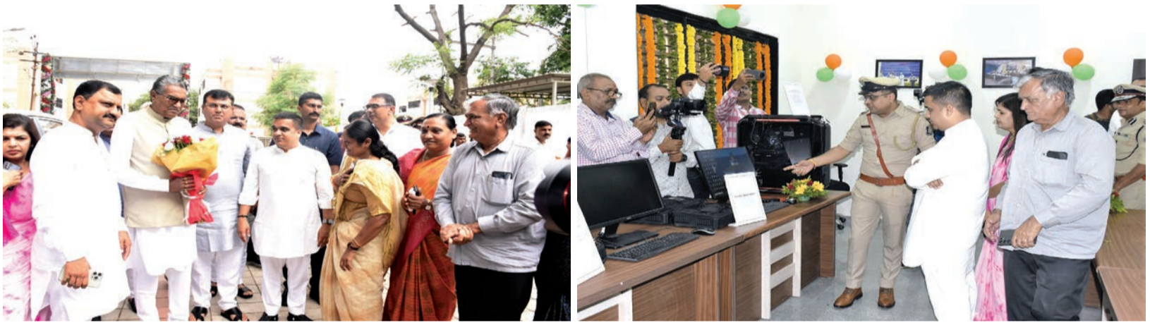
રાજકોટ રેન્જના સાયબર કાર્ડમ સંબંધી ગુનાહ ઉકેલવામાં સાયબર પોલીસ સ્ટેશન મહત્વની ભૂમિકા ભજવશે : સંઘવી

છે, કારણ કે નક્લી બિયારણનો ઉપયોગ ખેતીના ઉત્પાદનને ગંભીર નુકસાન પહોંચાડી શકે છે. કૃષિ મંત્રીએ આ મામલે ગંભીર ચિંતા વ્યક્ત કરતાં જણાવ્યું, ખેડૂતો અમારા અસહાય છે અને તેમની સાથે છેતરપીંડી કરનાર કોઈપણ વ્યક્તિ કે સંસ્થાને છોડવામાં નહીં આવે. નક્લી બિયારણનું વેચાણ ખેડૂતોના આર્થિક હિતોને નુકસાન પહોંચાડે છે અને રાજ્યની ખેતીવાડી પ્રગતિને અવરોધે છે. આવા તત્વો સામે કડક કાર્યવાહી કરવામાં આવશે. રાજકોટ જિલ્લા ખેતીવાડી વિભાગે આ મામલે તપાસને વેગ આપ્યો છે. નક્લી બિયારણના વેચાણ સાથે સંકળાયેલા વેપારીઓ અને સપ્લાયર્સની ઓળખ કરવા માટે વિભાગે વિવિધ ટીમો રચી છે. આ ટીમો બજારો, દુકાનો અને ગોડાઉનોમાંથી વધુ નમૂનાઓ એકત્રિત કરી રહી છે, જેથી નક્લી બિયારણના સ્ત્રોતની ઓળખ થઈ શકે. આ ઉપરાંત, ખેડૂતોને પણ સાચવેત રહેવા અને માત્ર પ્રમાણિત વેપારીઓ પાસેથી જ બિયારણ ખરીદવાની સલાહ આપવામાં આવી છે.