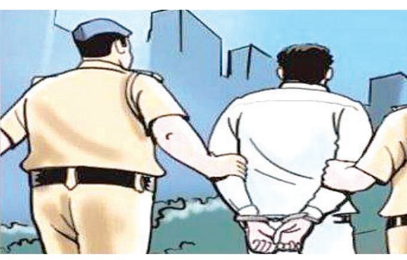
લૂટેરી દૂલ્હન ગંગોનો મુખ્ય સુત્રધાર ઝડપાયો રાજ્યભરના ગુનાઓ ઉકેલાવાની પોલીસને આશા