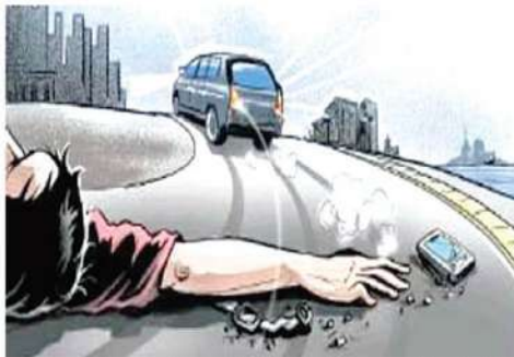
નામના યુવાનને રોડે રાજપરા રોડ પર રામપીર મંદિર પાસે વાહન અકસ્માતમાં ગંભીર ઈજા થતાં મોરબી સરકાર આપાની રાજકોટ સિવિલ હોસ્પિટલમાં ખસેડાવા હતાં. પરંતુ અહિં મોટી રાતે