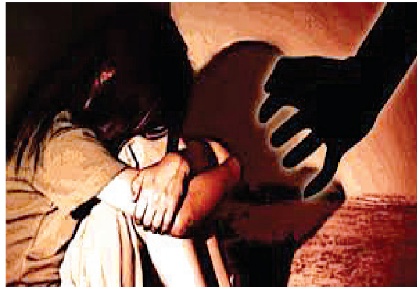
લાલચ આપીને દોઢ વર્ષ સુધી અલગ અલગ જગ્યાએ લઈ જઈ શારીરિક સંબંધ બાંધ્યા બાદ તરછોડી દેવાઈ હતી. એટલું જ નહીં યુવતિની જાતિને લઈને પણ ટિપ્પણી કરી હતી. યુવતિની ફરિયાદના આધારે આરોપી પ્રેમી વિરુદ્ધ સિંગણપોર

એક્ટની જોગવાઈ મુજબ કાર્યવાહી કરવામાં આવી છે. ઘટનાની વિગતો જણાવતાં એસીપી પ્રણવ કટારીયાએ જણાવ્યું હતું કે, મકરપુરા પોલીસ સ્ટેશનમાં દાખલ થયેલા ગુનામાં પીડિતા હોસ્પિટલમાં સારવાર માટે ગયા હતા અને ત્યાંથી દવાખાના વર્ધી મકરપુરા પોલીસ સ્ટેશનને મળી હતી, જેમાં પીડિત દીકરીને ત્રણ માસનો ગર્ભ હોવાની જાણ થતા પોલીસે તાત્કાલિક દવાખાને પહોંચીને ભોગ બનનારની માતાની અજાણ્યા ઈસમો વિરુદ્ધ ફરિયાદ લીધી હતી. જેમાં ભારતીય ન્યાય સંહિતાની કલમો હેઠળ રિયાદ લેવામાં આવી છે. તેઓએ વધુમાં જણાવ્યું હતું કે, પીડિતાની ચાર્ટર્ડ કાઉન્સેલિંગ એક્સપર્ટની મદદથી પૂછપરછ કરતા તેણે પ્રાથમિક તબક્કે બે શંકાસ્પદ આરોપીઓના નામ લીધા હતા. ડીએનએ પરીક્ષણ કરીને આરોપીઓ સાથે મેચ કરીને એ મુજબની સાયન્ટિફિક તપાસ કરીને પુરાવો એકઠા કરીને એમાં આગળ તપાસ ચાલુ છે. બે આરોપીમાંથી એક માઈનોર છે. પીડિતા ઘરે એકલી હોય એવા સમયે આ લોકો એકલતાનો લાભ લઈને એની સાથે દુષ્કર્મ કર્યું હતું. બીજા બનાવમાં સુરતના ઉભાલી વિસ્તારમાં રહેતી યુવતિને પ્રેમજાળમાં ફસાવ્યા બાદ લગ્નની