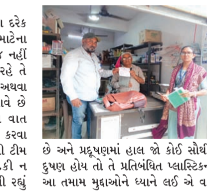
છે અને પ્રદૂષણમાં હાલ જો કોઈ સૌથી મોટું દુષણ હોય તો તે પ્રતિબંધિત પ્લાસ્ટિકનો છે. આ તમામ મુદ્દાઓને ધ્યાને લઈ એ વાત તો

રાજકોટ, તા. ૨ રાજ્ય સરકાર અને કેન્દ્ર સરકાર દેશના દરેક શહેર અને જિલ્લાને સ્વચ્છ બનાવવા માટેના તમામ પગલાંઓ લઈ રહ્યું છે એટલું જ નહીં શહેર અને જિલ્લાને પ્રોત્સાહન મળી રહે તે માટે સ્વચ્છતામાં અવલ આવતા શહેર અથવા જિલ્લાને પ્રોત્સાહિત કરવામાં પણ આવે છે ત્યારે રાજકોટ મહાનગરપાલિકાની વાત કરવામાં આવે તો આ વિચારને યથાર્થ કરવા માટે સોલિડ વેસ્ટ મેનેજમેન્ટ વિભાગની ટીમ દ્વારા શહેરમાં કોઈપણ જગ્યાએ ગંદકી ન થાય તેનું ખાસ ધ્યાન રાખવામાં આવી રહ્યું