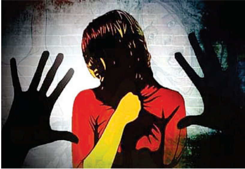
નોંધીને વધુ તપાસ હાથ ધરી છે. બીજા બનાવમાં સુરતના સરથાણા વિસ્તારમાં રહેતી કિશોરી સોશિયલ મીડિયા