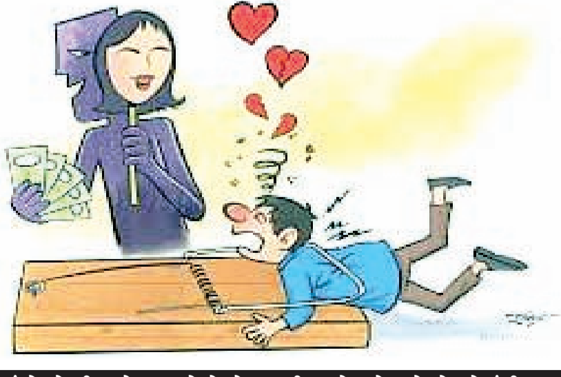
તું જે છોકરી સાથે વાત કરે છે એ અમારી ભાણેજ છે, હવે પોક્સોમાંથી બચવું હોય તો પૈસા આપ કહી રોકડા પડાવ્યા: તાલુકા પોલીસે ચારને પકડી લીધા