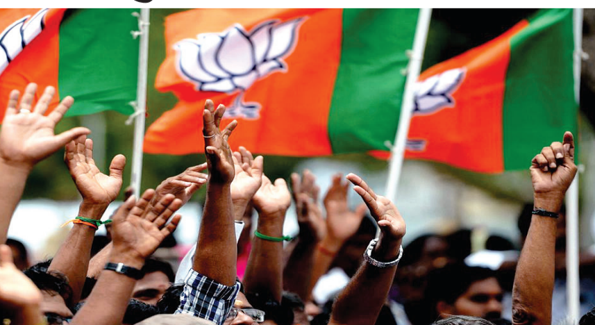
સર્વસંમતિ સધાઈ ગઈ છે. આયોજિત ફેરફાર માટે તબક્કો તૈયાર થઈ રહ્યો છે. ભાજપના આંતરિક સૂત્રો કહે છે કે નેતૃત્વ પરિવર્તન પ્રતીકાત્મક હશે અને પાર્ટી હાઇકમાન્ડ ફક્ત એક જ નામને લીલી ઝંડી આપશે, જેનાથી સમગ્ર પ્રક્રિયા નિર્વિવાદ બનશે. કેન્દ્રીય નેતૃત્વ પસંદગીની પસંદગી પર સહી કર્યા પછી, ઉમેદવાર પાર્ટીના નેતૃત્વ મંથન ત્યાં સમાપ્ત થતું નથી! ઘણા મહિનાઓથી અટકી પડેલા

ચર્ચાઓ વચ્ચે પ્રધાનમંત્રી નરેન્દ્ર મોદી સાથે ઉચ્ચ સ્તરીય વાટાઘાટોનો માર્ગ મોકળો થયો. આ મુલાકાત એવા સમયે થઈ રહી છે જ્યારે ભાજપ હાઇકમાન્ડ મહિનાઓથી અટકેલા મહત્વપૂર્ણ સંગઠનાત્મક ફેરફારોને આગળ વધારવા પર ધ્યાન કેન્દ્રિત કરી રહ્યું છે. પટેલ રાજધાનીમાં પહોંચ્યાના થોડા કલાકો પહેલા, ભાજપના રાષ્ટ્રીય અધ્યક્ષ જેપી નડા, રાષ્ટ્રીય મહાસચિવ (સંગઠન) બીએલ સંતોષ અને કેન્દ્રીય મંત્રી ભૂપેન્દ્ર યાદવ, જે ગુજરાત ચૂંટણી નિરીક્ષક પણ છે, તેમણે બંધ બારણે બેઠક કરી હતી. સૂત્રોએ પુષ્ટિ આપી છે કે ત્રણ નેતાઓ વચ્ચે આગામી ગુજરાત ભાજપના પ્રમુખની પસંદગી ઝડપી બનાવવા અને આગામી અઠવાડિયાની શરૂઆતમાં સમગ્ર પ્રક્રિયા પૂર્ણ કરવા માટે