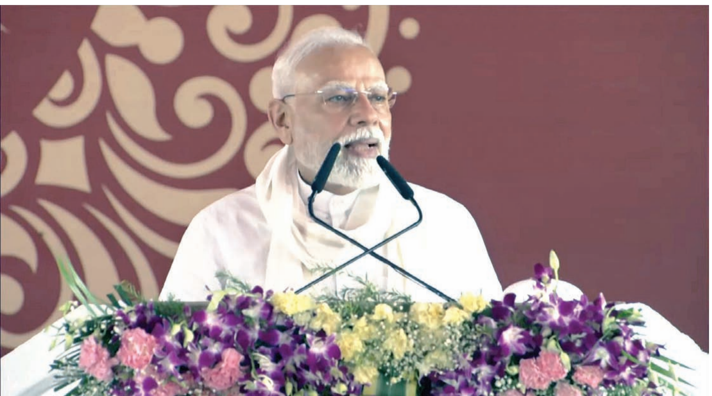
ભારતનો ગુડ્સ એન્ડ સર્વિસ ટેક્સ (GST) સંગ્રહ વાર્ષિક ધોરણે ૭.૫ ટકા વધીને રૂ. ૧,૯૫,૭૩૫ કરોડ થયો છે. આ સાથે, સંગ્રહ સતત સાતમા મહિનામાં ૩.૧૮ લાખ કરોડથી વધુ રહ્યો. એપ્રિલ-જુલાઈમાં ૨૦૨૫માં, વસૂલાત વાર્ષિક ધોરણે ૧૦.૭ ટકા વધીને ૮,૧૮,૦૦૯ કરોડ રૂપિયા થઈ ગઈ છે. દેશમાં કુલ ઘટ્ટો છે, જેનાથી લોકોને રાહત મળી છે. જૂન ૨૦૨૫માં ગ્રાહક ભાવ સૂચકાંક (CPI) કુલ ઘટ્ટોને ૨.૧૦ ટકા થયો છે, જે જાન્યુઆરી

નવીદિલ્હી, તા. ૨ વડાપ્રધાન નરેન્દ્ર મોદીએ શનિવારે કહ્યું હતું કે ભારત વિશ્વની ત્રીજી સૌથી મોટી અર્થવ્યવસ્થા બનવાના માર્ગે છે અને તેથી તેના આર્થિક હિતો પ્રત્યે સાવધ રહેવાની જરૂર છે. તાજેતરમાં, મોર્ગન સ્ટેનલીનો એક અહેવાલ બહાર આવ્યો છે, જેમાં કહેવામાં આવ્યું છે કે ભારત ૨૦૨૮ સુધીમાં ત્રીજી સૌથી મોટી અર્થવ્યવસ્થા બનવા તરફ આગળ વધી રહ્યું છે અને તે ૨૦૩૫ સુધીમાં તેના GDPને બમણાથી વધુ વધારીને ૧૦.૬ ટ્રિલિયન કરવાની યોજના ધરાવે છે.