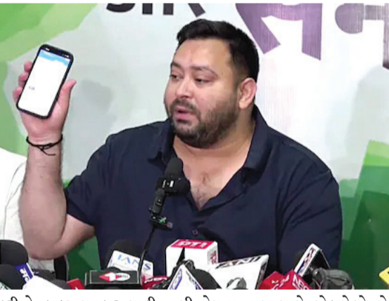
સ્પષ્ટતા કરી કે ડ્રાફ્ટ મતદાર યાદી રાજકીય પક્ષો સાથે શેર કરવામાં આવી છે અને ઘાવો અને વાંધાઓ માટે એક મહિનાનો સમય નક્કી કરવામાં આવ્યો છે. તેજસ્વી યાદવે ૨૦૨૦ માં નામાનંકન સમયે પોતાના સોગંદનામામાં EPIC નંબર RAB0456228નો ઉપયોગ કર્યો હતો. આ નંબર ૨૦૧૫

નવીદિલ્હી, તા. ૨ બિહારમાં વિપક્ષના નેતા અને આરજેડી નેતા તેજસ્વી યાદવને લઈને એક નવો વિવાદ ઉભો થયો છે. શનિવારે એક પત્રકાર પરિષદમાં ચૂંટણી પંચ પર નિશાન સાધતા તેમણે કહ્યું કે તેમણે મતદાર યાદીમાં પોતાનું નામ શોધ્યું પણ મળ્યું નહીં. આ નિવેદન બાદ રાજ્યમાં રાજકીય હોબાળો મચી ગયો. ચૂંટણી પંચ અને જિલ્લા ચૂંટણી અધિકારીએ તાત્કાલિક માહિતી શેર કરી અને ઘાવો કર્યો કે તેજસ્વીનું નામ મતદાર યાદીમાં હાજર છે. હવે આ સમગ્ર મામલામાં એક નવો વળાંક આવ્યો જ્યારે એક સામે આવી કે તેજસ્વી યાદવ પાસે એક નહીં પણ બે EPIC નંબર છે. આનાથી મામલો વધુ જટિલ બન્યો છે અને ચૂંટણી પંચે તેની તપાસ શરૂ કરી છે. તે જ સમયે, ચૂંટણી પંચે તથ્ય તપાસમાં તેજસ્વી યાદવના ૧૦ પ્રશ્નોને ભ્રામક ગણાવ્યા છે. પંચે