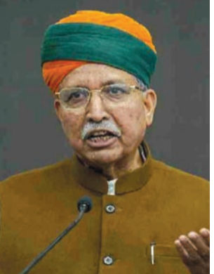
મેઘવાલે કહ્યું કે વિપક્ષ જાણી જોઈને લોકશાહીની સંસ્થાઓને નબળી પાડવાનું અભિયાન ચલાવી રહ્યું છે. મેઘવાલે કહ્યું કે વિપક્ષ, ખાસ કરીને રાહુલ ગાંધી, ચૂંટણી પંચ, ન્યાયતંત્ર અને અન્ય બંધારણીય પદો પર બેઠેલા લોકો પર દબાણ લાવવાનો પ્રયાસ કરી રહ્યા છે. આ લોકશાહી

નવીદિલ્હી, તા. ૨ કેન્દ્રીય કાયદા અને ન્યાય મંત્રી અર્જુન રામ મેઘવાલે જોધપુર પ્રવાસ પર પહોંચ્યા હતા અને એરપોર્ટ પર કાર્યકરો દ્વારા તેમનું સ્વાગત કરવામાં આવ્યું હતું અને આ દરમિયાન તેમણે વિપક્ષ અને રાહુલ ગાંધી પર મોટો હુમલો કર્યો હતો. મીડિયા સાથે વાત કરતા કેન્દ્રીય મંત્રીએ રાહુલ ગાંધી સહિતના વિપક્ષી નેતાઓ પર બંધારણીય સંસ્થાઓને ધમકી આપવાનો આરોપ લગાવ્યો હતો. તેમણે કહ્યું કે વિપક્ષ જાણી જોઈને લોકશાહીની સંસ્થાઓને નબળી પાડવાનું અભિયાન ચલાવી રહ્યું છે. મેઘવાલે કહ્યું કે વિપક્ષ, ખાસ કરીને રાહુલ ગાંધી, ચૂંટણી પંચ, ન્યાયતંત્ર અને અન્ય બંધારણીય પદો પર બેઠેલા લોકો પર દબાણ લાવવાનો પ્રયાસ કરી રહ્યા છે. આ લોકશાહી