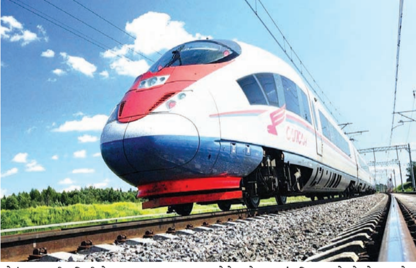
મોઈસર, વાપી, બિલીમોરા, સુરત, ભરૂચ, વડોદરા, આણંદ, અમદાવાદ અને સાબરમતીનો સમાવેશ થાય છે. MAHSR પ્રોજેક્ટનો કુલ અંદાજિત ખર્ચ રૂ. ૧,૦૮,૦૦૦ કરોડ (આશરે) છે. આમાંથી, જાપાન ઇન્ટરનેશનલ કોઓપરેશન એજન્સી (JICA) પ્રોજેક્ટ ખર્ચના ૮૧% એટલે કે રૂ. ૮૮,૦૦૦ કરોડનું ભંડોળ પૂરું પાડી

અમદાવાદ, તા. ૩ ભારતની પહેલી બુલેટ ટ્રેન સેવા ટૂંક સમયમાં મુંબઈ-અમદાવાદ રૂટ પર શરૂ થશે. ગુજરાતના ભાવનગરમાં એક કાર્યક્રમમાં બોલતા, રેલવે મંત્રી અશ્વિની વૈષ્ણવે જાહેરાત કરી કે મુંબઈ-અમદાવાદ બુલેટ ટ્રેન સેવા ખૂબ જ ટૂંક સમયમાં શરૂ થશે. એકવાર કાર્યરત થયા પછી, તે બંને શહેરો વચ્ચેનો મુસાફરીનો સમય ઘટાડીને ફક્ત ૨ કલાક ૭ મિનિટ કરશે. રેલવે મંત્રી ભાવનગર ટર્મિનસ પર હતા, જ્યાંથી તેમણે વર્ચ્યુઅલી ત્રણ ટ્રેનોને લીલી ઝંડી આપી હતી: ભાવનગર ટર્મિનસ અયોધ્યા કેન્ટ એક્સપ્રેસ, રેવા પુલે એક્સપ્રેસ અને જબલપુરથી રાયપુરને જોડતી નવી ટ્રેન.