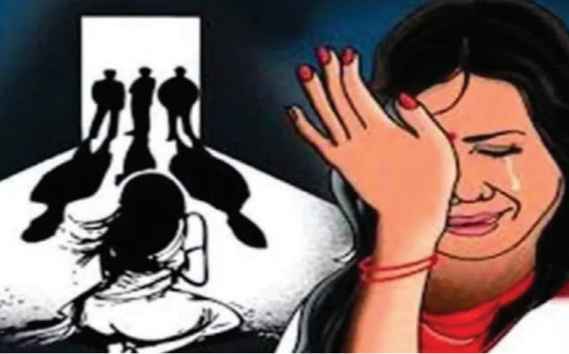
બીજી ઘટનામાં છોટાઉદેપુર જિલ્લાના કવાંટ તાલુકાના એક ગામની ધોરણ આઠમાં અભ્યાસ કરતી વિદ્યાર્થિની ઉપર શિક્ષક અને

પ્રથમ ચોકાવનારી ઘટનાની વિગતો પર નજર કરીએ તો વડોદરા શહેરમાં પરિણીતા પર સસરા અને નણદોયાએ વારંવાર દૂષ્કર્મ ગુજાર્યું હતું. જેની પરિણીતાએ જાણ કરતા પતિએ તેના ફોટા સોશિયલ મીડિયા પર વાઈરલ કરવાની ધમકી આપી હતી. આ મામલે નવાપુરા પોલીસ સ્ટેશનમાં ફરિયાદ નોંધાવ્યો છે. જેના આધારે પોલીસે તપાસ શરૂ કરી છે. વડોદરા શહેરના નવાપુરા પોલીસ સ્ટેશન વિસ્તારમાં રહેતી પરિણીતા તેના પતિ સાથે રહેતી હતી. આ દરમિયાન પરિણીતા ઘરમાં એકલા ઈય ત્યારે તેના સસરા તથા નણદોયા તેના ઘસી આવતા હતા અને તેની સાથે વારંવાર શરીર સંબંધ બાંધતા હતા.