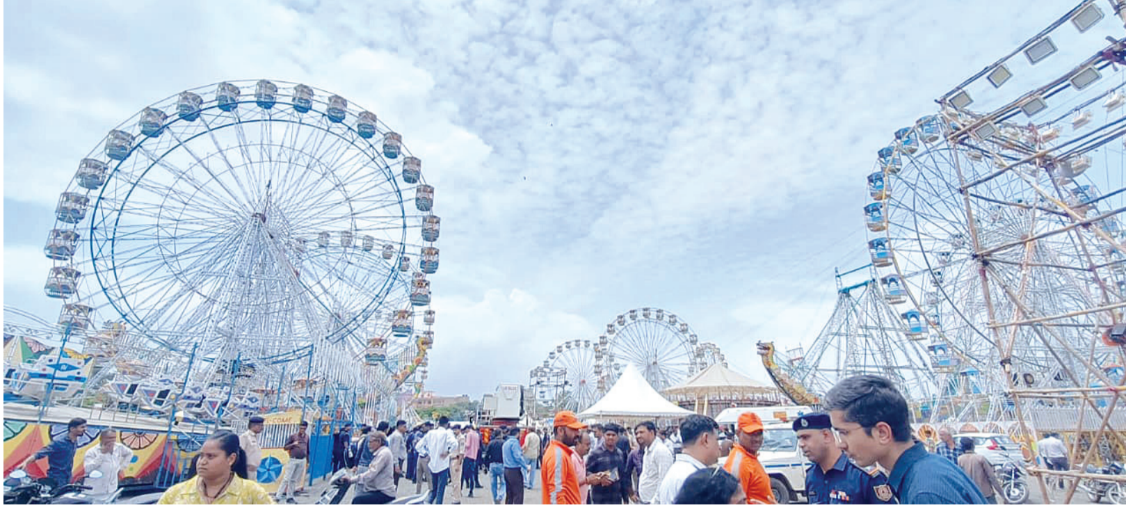
રાજકોટ, તા. ૧૩

રમકડાં, ખાણીપીણી, આઈસ્ક્રીમ, હેન્ડીક્રાફ્ટના ૨૦૦થી વધુ સ્ટોલ, ૫૦ જેટલા નાના મોટા ફજર-ફાળકામાં મહાલશે માનવ મહેરામણ એકતા, સંસ્કૃતિ અને મનોરંજનની ત્રિવેણી સમાન ‘શૌર્યનું સિંદૂર’ લોકમેળાને માણવા નગરજનોમાં અનેરો ધનગનાટ