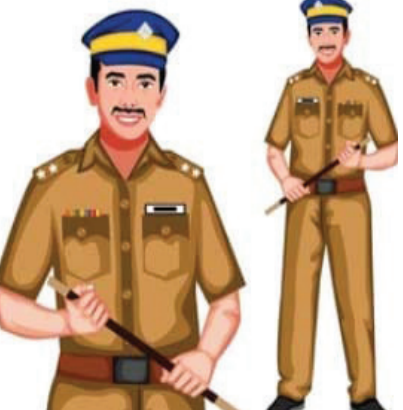
અને આવા આરોપીઓ રહે છે. આ ડોક્યુમેન્ટ્રીમાં એવા કિસ્સાઓ બતાવવામાં આવ્યા છે, જ્યાં લોકો ક્ષણિક ગુસ્સામાં આવીને મારામારી અને હત્યા જેવી ઘટનાઓને અજામ આપે છે, અને ત્યારબાદ

નથી. આ શહેર તેના વિકાસ અને પ્રગતિ માટે જાણીતું છે. તે છેલ્લા કેટલાક સમયથી એક ગંભીર સામાજિક સમસ્યાનો સામનો કરી રહ્યું છે. નાની નાની બાબતોમાં મારામારી, હત્યા અને હત્યાના પ્રયાસ જેવી ઘટનાઓ શહેરમાં વધી રહી છે, ખાસ કરીને ઉધના, પાંડેસરા, ગોડાદરા, સચિન અને ભેસ્તાન જેવા વિસ્તારોમાં. આ સમસ્યાના મૂળમાં લોકોમાં જોવા મળતો આક્રોશ અને ગુસ્સો છે, જે ક્ષણિક આવેગમાં મોટા ગુનાઓને જન્મ આપે છે. આ પરિસ્થિતિને ગંભીરતાથી લઈને, સુરત પોલીસે એક અનોખી અને નવીન પહેલ શરૂ કરી છે, જેના દ્વારા ગુનાખોરીને અટકાવવા માટે જાગૃતિ અભિયાન ચલાવવામાં આવી રહ્યું છે. આ પહેલનો ભાગ છે એક ખાસ ડોક્યુમેન્ટ્રી બનાવવી અને પ્રજા સમક્ષ તેને રજૂ કરવી. આ ડોક્યુમેન્ટ્રી સુરત પોલીસ એવા વિસ્તારોમાં બતાવી રહી છે જ્યાં સામાન્ય બાબતે ઝઘડા અને ત્યાર બાદ અપરાધિક ઘટના બને છે