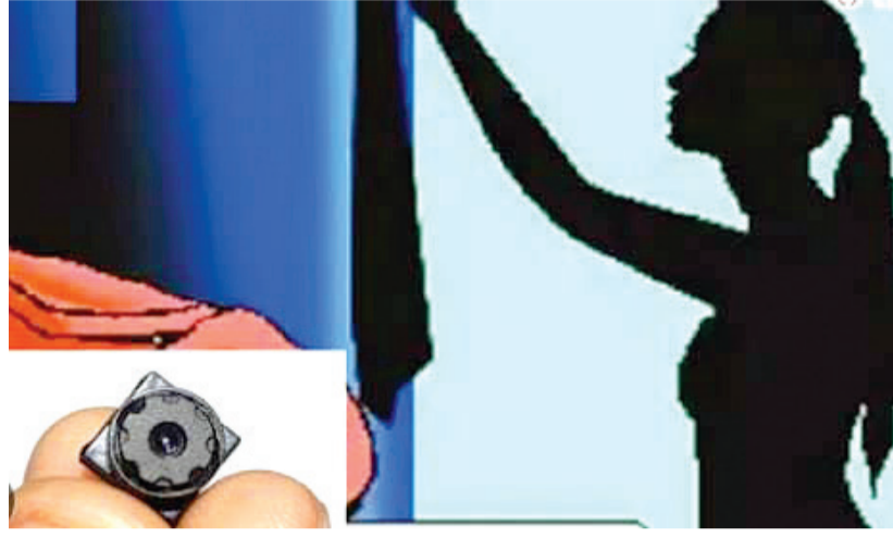
સુરતની કે ચારકોલ રેસ્ટોરન્ટના મહિલા વોશરૂમમાં હિડન કેમેરોમોબાઇલ હિસ્ટ્રીમાં અસંખ્ય પોર્ન ફિલ્મની લિંક, સફાઈકર્મચારી વેન્ટિલેશન જાળીમાં ફોન છુપાવ્યો હતો