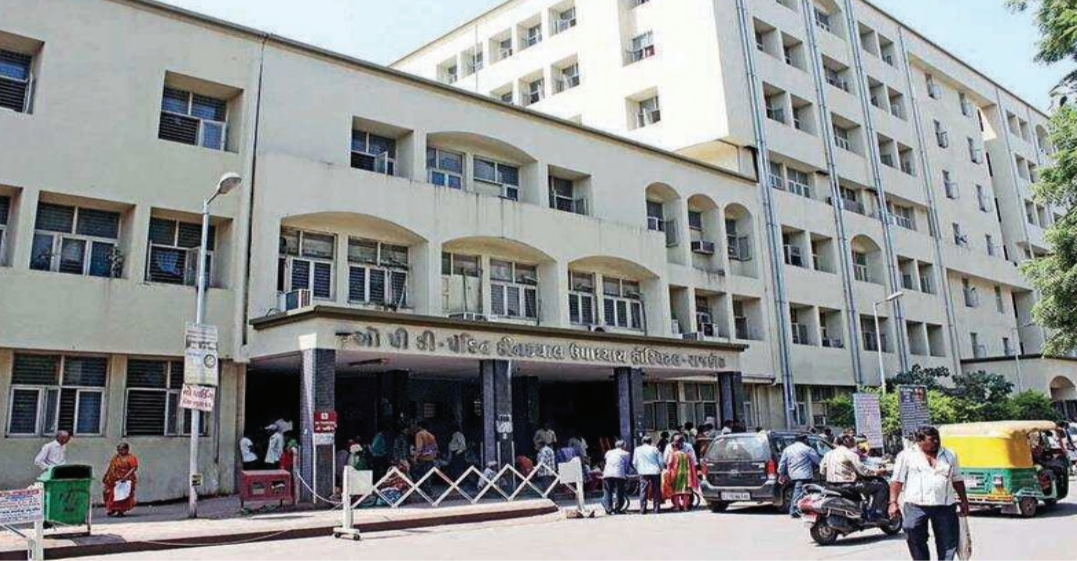
અને ૧૫ ઓગસ્ટની જાહેર રજા સિવાય કલાક ઈમરજન્સી સેવા પણ અવિરતપણે ઓપીડી સેવા પણ નિયમિત સમય મુજબ ચાલુ રાખવામાં આવી હતી. ઉપરાંત ૨૪ કલાક ઈમરજન્સી સેવા પણ અવિરતપણે ચાલુ હતી. તહેવારોને ધ્યાનમાં રાખીને જરૂરિયાત મુજબ નર્સિંગ સ્ટાફ તેમજ અન્ય સર્વન્ટની હાજરી પણ વધારવામાં આવી હતી. રાજકોટ સિવિલ હોસ્પિટલના

જ છે આ તમામ બાબતોની આગમ ચેતીને ધ્યાને લઈને જ હાલ રાજકોટ સિવિલ નો સ્ટાફ ખડે પગે રહ્યો હતો અને કોઈ દર્દી ઓને હેરાનગતિ ન થાય તે માટેની તમામ તેકદારીઓ રાખવામાં આવી હતી. રાજકોટ સિવિલ હોસ્પિટલમાં જન્માષ્ટમીનાં તહેવારો દરમિયાન પણ સ્ટાફ ખડે પગે રહ્યો હતો. તહેવારોના કારણે ખાનગી હોસ્પિટલોમાં રજા હોવાથી સિવિલ હોસ્પિટલમાં દર્દીઓનો ભારે ધસારો જોવા મળ્યો હતો. જેના કારણે સ્ટાફની વ્યસ્તતા વધી ગઈ હતી. તેમજ ૫ દિવસના ટૂંકા ગાળામાં ૯,૬૩૧ ઓપીડી કેસ નોંધાયા હતા. જ્યારે કુલ ૪૬૨ ઓપરેશન સફળતાપૂર્વક કરવામાં આવ્યા હતા. આ સમયગાળા દરમિયાન કુલ ૧,૬૨૦ દર્દીઓને દાખલ પણ કરવામાં આવ્યા હતા. સિવિલ હોસ્પિટલના અધિક્ષક ડૉ. મોનાલી માકડિયાના માર્ગદર્શન હેઠળ તહેવારોને અનુલક્ષીને મેડિકલ સ્ટાફમાં વધારો કરાયો હતો.