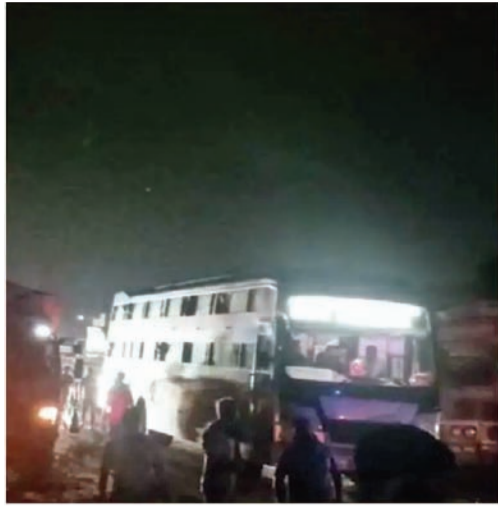
ચાર બસો પર પાણકાના ઘા કરતાં આગળના કાચ ફૂટી ગયા હતાં. એક બસમાં સાઈડના દરવાજાનો કાચ પણ ફૂટી ગયો હતો. ઓર્થોટોપીક પથ્થરમારને કારણે મુસાફરો, ડ્રાઈવર, ક્લીનરોમાં ભય કેલાઈ ગયો હતો. આ અંગે આજીવેમ પોલીસને લેખિત ફરિયાદ અરજી આપવામાં આવતાં તપાસ શરૂ થઈ છે.

રાજકોટ, તા. ૨૦ અમુક લોકો એવા વિકૃત દિમાગના હોય છે જેને બીજાને હેરાન કરવામાં મજા આવતી હોય છે. શહેરના જુના માર્કેટ યાર્ડ પર કેટલાક સમયથી આવા જ કોઈ તત્વો નિર્દોષ વાહનચાલકોને હેરાન પરેશાન કરી રહ્યા છે. મોટે ભાગે ખાનગી બસ અને ટ્રકના ચાલકોને આવા તત્વો નિશાન બનાવે છે. રાત્રીના સમયે બસ કે ટ્રક નીકળે અને જુના માર્કેટ યાર્ડ સામેના રોડ પર પહોંચે ત્યારે કોઈ અંધારામાંથી રંઢીયા-પાણકાના આડેઘડ ઘા કરી કાચ ફોડી નાંખે છે. આવી ઘટના સોમવારે રાતે ફરીથી બની હતી. જેમાં એક સાથે પાંચ બસોને નિશાન બનાવી પાણકાના ઘા કરવામાં આવતાં ખાનગી બસોના કાચ ફૂટ્યા હતાં અને મુસાફરોની સાથે સાથે ડ્રાઈવર ક્લીનર પણ ભયભીત થઈ ગયા હતાં. પોલીસ સુધી મામલો પહોંચતા તપાસ શરૂ કરવામાં આવી હતી.