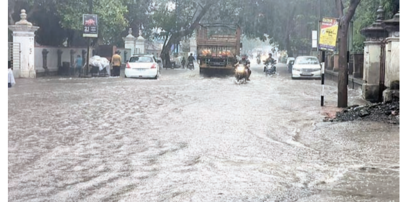
વરસાદ નોંધાયો છે. આ ઉપરાંત ભાવનગર જિલ્લાના મહુઆ તાલુકામાં ૪.૬૯ ઇંચ તથા ગીર સોમનાથના તલાલા તાલુકામાં ૪ ઇંચથી વધુ વરસાદ નોંધાયો છે.

રાજકોટ, તા. ૨૦ ગુજરાતના મોટાભાગના વિસ્તારોમાં ખાસ કરીને સૌરાષ્ટ્રના દરીયાકાંઠાના જિલ્લાઓમાં છેલ્લા ૨૪ કલાક દરમિયાન શ્રીકાર વરસાદ નોંધાયો છે. છેલ્લાં ૨૪ કલાક દરમિયાન દેવભૂમી દ્વારકા જિલ્લામાં રાજ્યનો સૌથી વધુ સરેરાશ ૧૧ ઇંચ વરસાદ નોંધાયો છે. જેમાં કલ્યાણપુર તાલુકામાં રાજ્યનો સૌથી વધુ ૧૦.૭૫ ઇંચ તથા દ્વારકા તાલુકામાં ૬ ઇંચ જેટલો વરસાદ વરસ્યો છે. જ્યારે પોરબંદર તાલુકામાં ૪ ઇંચ જેટલો, માંગરોળ તાલુકામાં ૩.૭૪ ઇંચ, સુત્રાપાડા તાલુકામાં ૩.૩૫ ઇંચ, જાફરાબાદ તાલુકામાં ૩.૦૭ ઇંચથી વધુ વરસાદ નોંધાયો છે. આ ઉપરાંત ગઈકાલે સવારે ૬ વાગ્યાથી ૧૦ વાગ્યા સુધીમાં માત્ર ૪ કલાકમાં જુનાગઢ જિલ્લાના મેંદરડા તાલુકામાં ૧૦ ઇંચ જેટલો વરસાદ વરસ્યો છે. જુનાગઢના વંધલીમાં ૫ ઇંચથી વધુ તથા કેશોદમાં ૪ ઇંચથી વધુ