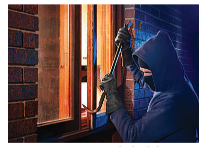
ગ્રાઈવીંગ કરી ગુજરાત ચલાવે છે. તેણે જણાવ્યું હતું કે હું પરિવાર સાથે રહું છું. સત્તરમીએ