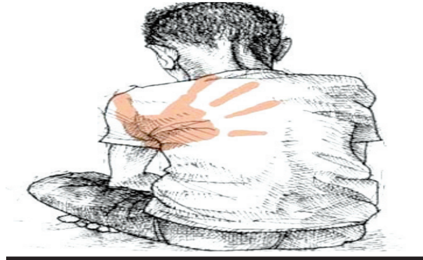
બીજી ઘટનામાં હવસખોર બનેલીના સતત બળાત્કારને કારણે સાળી બની ગઈ ગર્ભવતી

પ્રથમ ચોંકાવનારી અને લાલબત્તી સમાન ઘટના જોઈએ તો જામનગરમાં અગીયાર વર્ષના સગીર બાળક સાથે સૃષ્ટિવિરુદ્ધનું કૃત્ય આચરીને વિડીયો બનાવ્યાની ચાર બાળ આરોપીઓ સામે ગુનો નોંધીને પોલીસે ઘરપકડ માટેની તજવીજ હાથ ધરતા શહેરમાં તેમજ સમાજમાં ભળભળાટ મચી જવા પામ્યો છે. પોલીસે વિડીયોના આધારે ખુદ ફરિયાદી બનીને ઉડાણ પુર્વકની તપાસ હાથ ધરી છે. શહેરના બંધાર વિસ્તારમાં રહેતા અગીયાર વર્ષના સગીરને એક આરોપી સગીરના ઘરે બોલાવીને ત્રણ સગીર આરોપીઓએ સૃષ્ટિવિરુદ્ધનું કૃત્ય આચર્યું હતું અને એક એક સગીર આરોપીએ મોબાઇલમાં વિડીયો બનાવ્યો હતો.