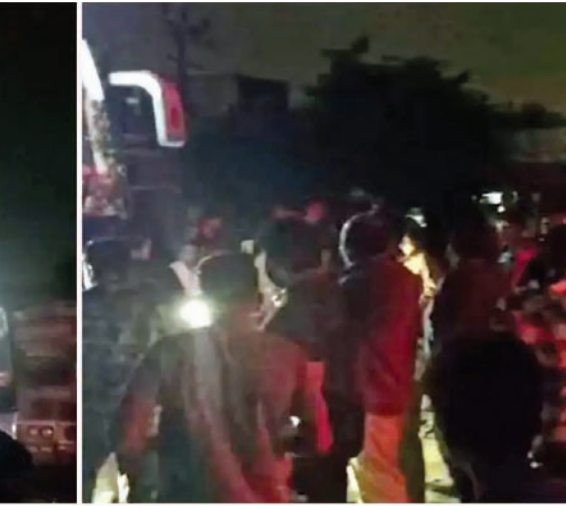
વધુ માહિતી અનુસાર રાત્રીના દસથી સવા દસ વચ્ચે સોમનાથ, કેશોદ, મેંદરડા, રાજકોટથી સુરત જવા નકળેલી જય વૃજ ટ્રાવેલ્સ, દર્શન ટ્રાવેલ્સ, સંતકૃપા ટ્રાવેલ્સ અને જય જલારામ ટ્રાવેલ્સની લકઝરી બસો આજીવેમ ચોકડીથી ગ્રીવેલ્ડ ચોકડી તરફ આગળ વધી રહી હતી ત્યારે જુના માર્કેટ યાર્ડ નજીક પહોંચી તે વખતે ચારેય બસો પર રંઢીયાના ઘા આવતાં આગળના કાચ ફૂટ્યા હતાં.