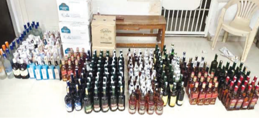
અન્ય દરોડામાં એ-ડિવીઝન, બી-ડિવીઝન, ગાંધીગ્રામ પોલીસે દાડ-બીચરના જથ્થા સાથે ત્રણને પકડી લીધા

રાજકોટ, તા. ૨૧ રંગીલા રાજકોટ શહેરમાં અનેક અવા પ્યાસીઓ વસવાટ કરી રહ્યા છે જે હેલ્થ પરમીટ વગર એટલે કે પીવાના પરવાના વગર દાડ પીવાની આદત ધરાવે છે અથવા તો શોખ માટે મોજ માટે પીવે છે. આવા પ્યાસીઓ દાડબંધી હોવા છતાં ગમે ત્યાંથી બોટલો શોધી લઈ ડૉબી લેતાં હોય છે. પ્યાસીઓની પ્યાસ બુઝાવવા બૂટલેગરો સપ્લાયરો પણ સતત તેમની સેવામાં રહે છે. જો કે મેવા વગરની આ સેવા નથી. દોઢા કે ૩બલ અને તહેવાર ટાણે તો ત્રણ ગણા ભાવો વસુલીને આવા નાના મોટા બૂટલેગરો, સપ્લાયરો પ્યાસીઓને માલ પુરો પાડતાં રહે છે. બીજી તરફ દાડબંધીનો અમલ કરાવવા પોલીસ પણ દરોડા પાડતી રહે છે. ક્યારેક પોલીસના હાથમાં નાનો જથ્થો આવતો હોય છે તો ક્યારેક અધિકારીઓ મુશ થઈ જાય એ રીતે મોટો જથ્થો જે તે ટીમ પકડી લેતી હોય છે. વધુ એક આવા દરોડામાં કાલાવડ રોડ પર પરિમલ સ્કૂલ પાછળના મકાનમાંથી પીસીબીની ટીમે છ લાખ આસપાસના દાડ સાથે એક શપ્સને પકડ્યો હતો.