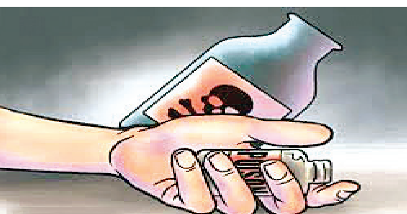
બે દિવસની વયની બાળકી સુતા બાદ કાયમને માટે પોઠી ગઈ, ઓગણીસ વર્ષના યુવાનનું બેભાન હાલતમાં મૃત્યુ