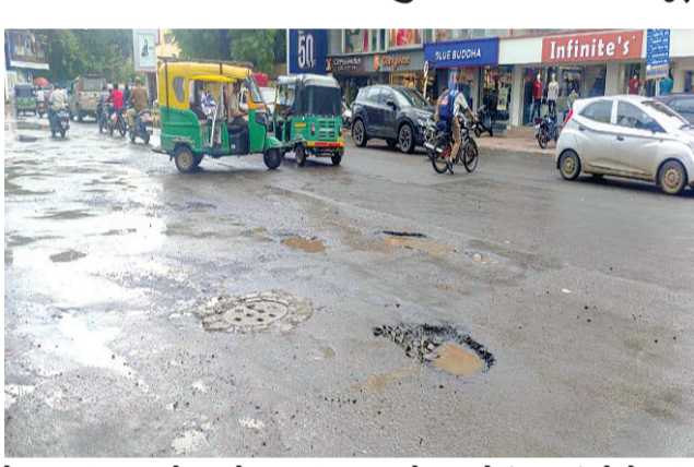
તેમજ થઈ ચૂક્યા છે. ત્યારે ખાડાની મરામત માટે મહાનગરપાલિકા દ્વારા ૧.૯૦ કરોડનો ખર્ચ કરવાનો નિર્ધાર કર્યો છે જેને આજે સ્ટેન્ડિંગ કમિટીમાં દરખાસ્ત રૂપે મૂકવામાં

રાજકોટ, તા. ૨૧ રાજકોટ મહાનગરપાલિકા રૂપિયાનો ધુવાણો કરતું હોય તો નવાઈ નહીં કારણ કે હાલ રાજકોટ માટે અત્યારે સૌથી મોટો જો કોઈ ચિંતા નો વિષય હોય તો તે એ છે કે હાલ ઘણા ખરા રોડ રસ્તાની હાલત ખૂબ ખરાબ થઈ ચૂકી છે અને તેની મરામત કરવા માટે પણ મહાનગરપાલિકાએ ખર્ચ કરવો પડશે. બે દિવસ થી હાલ જે વરસાદ મની ઓર્ડર જેવી સેવાઓનો સમાવેશ કરાયો છે. મુખ્ય વિશેષતાઓ અંગે ચર્ચા કરવામાં આવે તો માર્કેટ-સર્વિસ અને ઓપન API આધારિત આર્કિટેક્ચર, એકસમાન યુઝર ઈન્ટરફેસ, ક્લાઉડ-રેડી ડિપ્લોયમેન્ટ, બુકિંગથી ડિલિવરી સુધી સંપૂર્ણ ડિજિટલ સેવા, QR કોડ પેમેન્ટ, OTP આધારિત ડિલિવરી વગેરે સેવાનો સમાવેશ થાય છે.