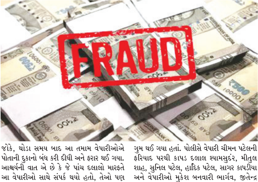
જોકે, થોડા સમય બાદ આ તમામ વેપારીઓએ પોતાની દુકાનો બંધ કરી દીધી અને ફરાર થઈ ગયા. આશ્ચર્યની વાત એ છે કે જે પાંચ દલાલો મારફતે આ વેપારીઓ સાથે સંપર્ક થયો હતો, તેઓ પણ

રાજકોટ, તા. ૨૧ ગડીયાગીરી, ફોડ, કપાઈ, છેતરપિંડીની રોજરોજ નવી નવી ઘટનાઓ થકી પોલીસ દોડતી રહે છે. જો કે ગડીયાઓને કોઈની શરમ નહતી નથી. તેઓ ગમે તેના ગરીબો ગમે તેમ કરીને ફેરવી નાખે છે. આવા વધુ કિસ્સાઓ સામે આવ્યા છે. જેમાં એક કાપડના વેપારી સાથે આઠ વેપારીઓ અને પાંચ દલાલોએ અધઘ ઓફ કરોડથી વધુની છેતરપિંડી કરી લીધી છે. શરૂઆતમાં માલ ખરીદી રોકડા ચુકવી વેપારીનો વિશ્વાસ જીતી લેવાયા બાદ આ બધાએ બાકીમાં કાપડનો માલ ખરીદ કર્યો હતો અને છેલ્લે પૈસા ચુકવતી વખતે હાથ ઉંચા કરી દીધા હતાં. બીજી ઠગાઈની ઘટનામાં યુવતિને ઓનલાઇન નોકરીની લાલચ આપી રોકડ પડાવી લેવાઈ હતી. અહિં ફોડની રકમ નાની હતી પણ ઘટના લાલભાગી સમાન છે. પ્રથમ ફોડની વિગતો પર નજર કરીએ તો સુરતના રિંગરોડ વિસ્તારમાં આવેલી વિવિધ માર્કેટના વેપારીઓ અને દલાલોએ એક કાપડ