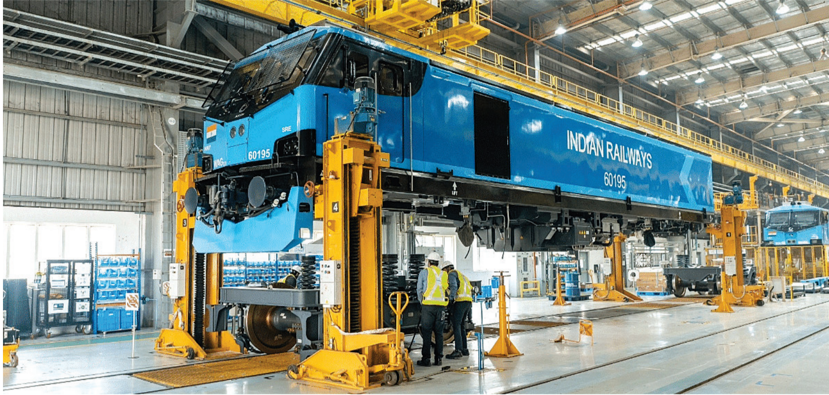
ટ્રેનોનું સંચાલન થશે. આનાથી વધુ પેસેન્જર ટ્રેનો ગતિ અને કાર્યક્ષમતામાં પણ નોંધપાત્ર સુધારો પ્રવૃત્તિઓને નવી ઊર્જા પ્રદાન કરશે. બેચરાજી-રણુજ રેલ લાઇનનું ગેજ કન્વર્ઝન નેશનલ લોજિસ્ટિક્સ પોલિસી અને પ્રધાનમંત્રી ગતિ શક્તિ રાષ્ટ્રીય માસ્ટર પ્લાન ફોર મલ્ટિમોડલ

આનાથી દૈનિક મુસાફરો, પ્રવાસીઓ અને વ્યવસાયો માટે મુસાફરી સરળ અને ઝડપી બનશે. તે પ્રાદેશિક આર્થિક એકીકરણને પણ પ્રોત્સાહન આપશે. વધારાની લાઇન ક્ષમતાના કારણે અમદાવાદ-દિલ્લી રૂટ પર વધુ ઝડપે