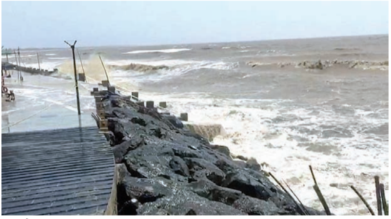
અને સૌથી ઓછો પૂર્વ મધ્ય ગુજરાતમાં ૭૩.૪૦ ટકા સરેરાશ વરસાદ વરસ્યો છે. ભારતીય હવામાન વિભાગ દ્વારા ગુજરાતનાં દરિયા

રાજ્યમાં મોસમનો કુલ સરેરાશ વરસાદ ૬૮૧.૧૪ મિમી એટલે કે ૭૭.૨૪ ટકા નોંધાયો છે. જેમાં દક્ષિણ ગુજરાતમાં સૌથી વધુ ૮૦.૫૧ ટકા, કચ્છ વિસ્તારમાં ૮૦.૨૬ ટકા, સૌરાષ્ટ્રમાં ૭૭.૩૯ ટકા, ઉત્તર ગુજરાતમાં ૭૫.૮૭ ટકા