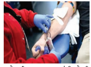
ગિનીશ વર્લ્ડ રેકોર્ડ પણ બનશે. ત્યારે બ્રહ્મકુમારી રાજકોટ ખાતે પણ અલગ અલગ ૧૫ વિસ્તારોમાં આ કેમ્પનું આયોજન કરવામાં આવેલું છે ત્યારે રાજકોટ બ્રહ્મકુમારીના સભ્ય ઝોન કાર્યાલય ખાતે બ્લડ ડોનેશન કેમ્પનું આયોજન કરવામાં આવેલું છે જે રવિવારે તારીખ ૨૪ ના રોજ સવારે ૮:૩૦ વાગ્યાથી બપોરે ૧:૦૦ વાગ્યા સુધી પંચશીલ સોસાયટી દોશી હોસ્પિટલ પાસે આવેલા બ્રહ્મકુમારી ખાતે યોજવામાં આવશે. વધુને વધુ લોકો આ રક્તદાન મહા અભિયાનમાં જોડાઈ તેવી અપીલ પણ બ્રહ્મકુમારી દ્વારા કરવામાં આવેલી છે.

રાજકોટ, તા. ૨૨ વિશ્વમાં સામાજિક ઉત્થાન તથા મૂલ્યનીષ્ઠ સમાજની પુનઃસ્થાપના માટે અવિરત સેવા કરતી બ્રહ્મકુમારી સંસ્થા દ્વારા અનેકવિધ સમાજ ઉચ્ચ સ્થાન માટેના કાર્યક્રમો યોજાતા હોય છે ત્યારે આંતરરાષ્ટ્રીય સંસ્થા બ્રહ્મકુમારીના પૂર્વ પ્રસાશિકા દાદી પ્રકાશમણીના ૧૮ માં સ્મૃતિ દિવસ નિમિત્તે ૨૫ ઓગસ્ટના રોજ ભારત તથા નેપાળમાં એક રાષ્ટ્રીય રક્તદાન મહા અભિયાનનું આયોજન કરવામાં આવ્યું છે. આ રાષ્ટ્રીય મહા અભિયાનનો શુભારંભ ૧૭ ઓગસ્ટ ૨૦૨૫ દિવસે કરવામાં આવ્યું છે જે ભારતનો એક