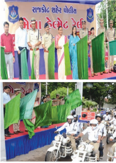
પહેરવાને કારણે ૨૦ ફેટલ અકસ્માત એટલે કે જીવલેણ અકસ્માત સર્જાયા છે. તેમજ અન્ય ૯ ગંભીર અકસ્માતમાં ૧૦ લોકોને ઈજાઓ થઈ હતી. ડીસીપીએ વધુમાં જણાવ્યું છે કે પોલીસ કમિશનર બ્રજેશકુમાર ઝા. જેસીપી

તેમણે વધુમાં કહ્યું હતું કે ૨૦૨૫માં ટુવ્હીલર વાહન ચલાવતા સર્વે હેલ્મેટ નહિ