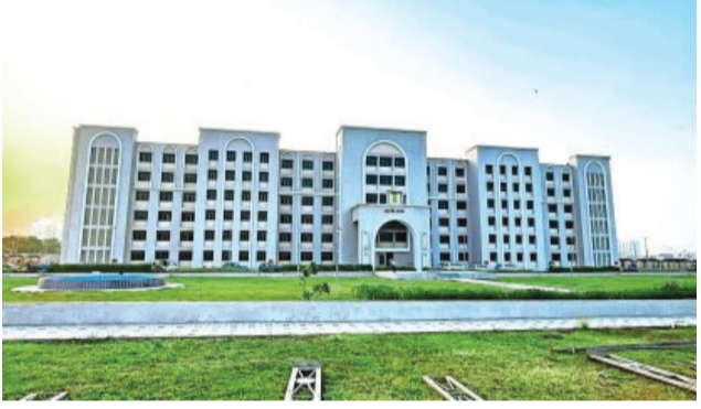
રાજકોટને હાઈકોર્ટ બેંચ મળે તે મૂલ્ય જરૂરી છે અને તેની માંગ પણ તીવ્રવેગે ઉઠી રહી છે. સૂત્રોના જણાવ્યા અનુસાર રાજકોટ જિલ્લાના અન્ય તાલુકાઓના પ્રતિનિધિઓ પણ ઉપસ્થિત રહેશે અને અન્ય જિલ્લાઓ ના પણ એસોસિએશનના પ્રતિનિધિઓ હાજર રહેશે તેનું જાણવા મળ્યું છે.

રાજકોટ, તા. ૨૨ રાજકોટને હાઈકોર્ટ બેંચ મળે તે માટે વકીલોએ રણશિયું મૂકી દીધું છે અને ખાસ પહેલ પણ હાથ ધરવામાં આવી છે ત્યારે આ મામલો અત્યંત ગંભીર હોવાના કારણે હવે હાઈકોર્ટ બેંચ માટેની લડતમાં ભાજપ લીગલ સેલ પણ મેદાને આવ્યું છે અને આજે કમલમ ખાતે થાકી દે બેઠક પણ બોલાવવામાં આવી છે. સોરાષ્ટ્રના હાઈકોર્ટની બેંચ મળે તે માટે રાજકોટના વકીલો દ્વારા આંદોલન શરૂ કરી દેવાયું છે. આજની બેઠકમાં આગામી દિવસોમાં રજૂઆતનો દોર શરૂ કરવામાં આવશે એટલું જ નહીં સૂત્રોના જણાવ્યા અનુસાર આ બેઠકમાં સાંસદ સભ્યો તથા ધારાસભ્યો પણ જોડાશે કારણકે