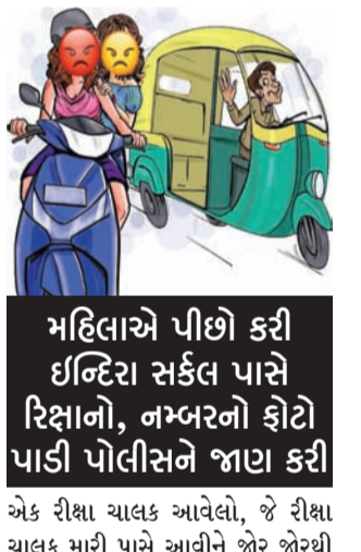
મહિલાએ પીછો કરી ઈન્દિરા સર્કલ પાસે રિક્ષાનો, નખરનો ફોટો પાડી પોલીસને જાણ કરી

રાજકોટ, તા. ૨૨ શહેરમાં સરાજહર છોડતી અને લુખ્ખાગીરીની વધુ એક ઘટના સામે આવી છે જેમાં સવારના પહોરમાં એક રીક્ષા ચાલકે એક ગૃહિણી કે જેઓ પોતાના દીકરાને સ્કૂલે મુકવા જઈ રહેલ તેનો યુનિવર્સિટી રોડ પર પીછો કરી આંતર તમે મને પસંદ છો તેમ કહી હાથ પકડી છોડતી કરતા આ ગૃહિણીએ બૂધાબૂધ કરી મુકતા લુખ્ખા રીક્ષાચાલક ભાગી ગયો હતો. આ બનાવ અંગે યુનિવર્સિટી પોલીસને જાણ કરવામાં આવતા ગુનો દાખલ કરી છોડતી કરી ભાગી ગયેલા રીક્ષા ચાલકને ઝડપી લેવા તપાસ શરૂ કરવામાં આવી છે.