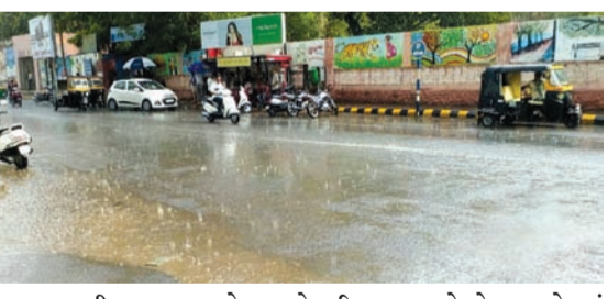
હતા. ગઈકાલ સવારથી જ હળવા ભારે વરસાદી ઝાપટા શહેરમાં પડી રહ્યા છે

રાજકોટ, તા. ૨૨ છેલ્લા ત્રણ દિવસથી સવાર થી લઈ સાંજ સુધી રાજકોટ શહેરમાં વરસાદી ઝાપટા પડી રહ્યા છે ત્યારે હાલ ઋતુ બે ઋતુ થઈ ગઈ છે અને તેની આરોગ્ય ઉપર પણ અસર જોવા મળી રહી છે ત્યારે ગઈકાલે બપોરે સુધી ૧૧ મીમી જેટલો વરસાદ રાજકોટમાં વરસ્યો હતો અને કહી શકાય કે બપોરે સુધીમાં અનેક વખત વરસાદી ઝાપટા પણ પડ્યા