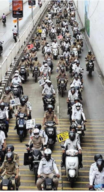
મહેન્દ્ર બગીચા દ્વારા શહેરી વિસ્તારના તમામ નાગરિકોની માર્ગ સલામતી અંગેની સુરક્ષા સુનિશ્ચીત કરવા સુચના અપાઈ હોઈ આ માટે શહેર ટ્રાફિક શાખા દ્વારા તમામ ટુવ્હીલર વાહનચાલકોને અપીલ કરવામાં આવે છે કે

આગામી ૮ સપ્ટેમ્બરથી શહેરી વિસ્તારમાં તમામ ટુવ્હીલરચાલકોને હેલ્મેટ પહેરીને જ નીકળે. આજે યોજાયેલી મેગા હેલ્મેટ રેલીનો પોલીસ હેડક્વાર્ટરથી લીલી ઝંડી આપી આરંભ કરાવ્યો હતો.