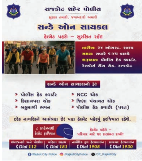
રાજકોટ શહેર પોલીસ દ્વારા જે રેલી બાદ બાસ્કેટબોલ મેચ પણ યોજાયો હતો. આ અંગે કાઈમ ડીસીપીએ જણાવ્યું