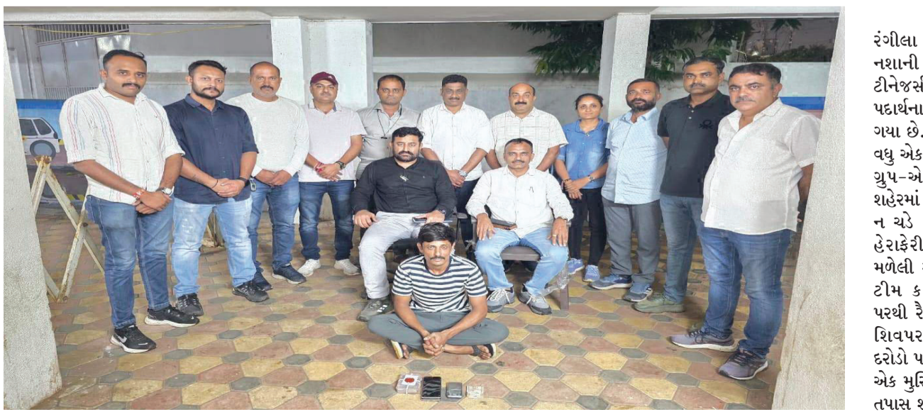
રાજકોટ, તા. ૨૪ રંગીલા મોજીલા રાજકોટમાં દારૂના નશાની સાથે અમુક યુવાધન, પદાર્થની હેરાફેરીનો પર્દાફાશ કર્યો ટીનેજર્સ કે બીજા બંધાણીઓ માદક પદાર્થના જીવલેણ નશાના રવાડે ચડી ગયા છે. આવા પદાર્થનું વેચાણ કરતાં વધુ એક શખ્સને સ્પેશીયલ ઓપરેશન યુપ-એસઓએ પકડી લીધો છે. શહેરમાં યુવાધન માદક પદાર્થના રવાડે ન ચડે અને આવા પદાર્થનું વેચાણ હેરાફેરી સંદર્ભ બંધ થાય તે માટે મળેલી સુચના અંતર્ગત એસઓજીની ટીમ કાર્યરત હતી ત્યારે ખાતમી પરથી રૈયા રોડ બ્રહ્મસમાજ નજીકના શિવપરામાં પાક્કી ખાતમી પરથી દરોડો પાડી મેકેડોન ડ્રગ્સ-એમડી સાથે એક મુસ્લિમ શખ્સને પકડી લઈ વધુ તપાસ શરૂ કરી છે.