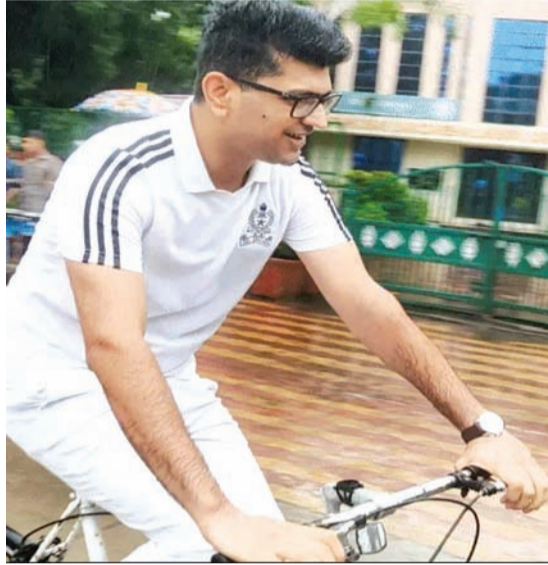
સાયકલ ચલાવી હતી. મળતી માહિતી અનુસાર આ સાયકલ રેલીમાં ૩૦થી વધુ પોલીસ જવાનો તથા કર્મચારીઓની સાથે

રાજકોટ, તા. ૨૪ શહેર પોલીસ દ્વારા હેલ્મેટ ફરજિયાત અને ખાસ તો ક્રિકેટ ઈન્ડિયા મોમેન્ટના સંદેશા માટે સાયકલોથોનનું આયોજન કરવામાં આવ્યું હતું વરસાદી માહોલ વચ્ચે પોલીસ હેડ ક્વાર્ટર્સ થી સાયકલો લઈને પોલીસના ટોચના અધિકારીઓ નીકળ્યા હતા પરંતુ હેલ્મેટ ફરજિયાતનો સંદેશો મુદ્દ પોલીસના અધિકારીઓ તથા જવાનોએ જ ઉલાળીયો કર્યો હતો. એક પણ પોલીસ કર્મચારી કે અધિકારી હેલ્મેટમાં જોવા મળ્યા ન હતા. આ અંગે અગાઉ રાજકોટ શહેર પોલીસ દ્વારા જાહેર આમંત્રણ આપવામાં આવ્યું હતું અને શહેર પોલીસના અધિકારીઓ પણ હતી કે ખૂબ વ્યાપક પ્રમાણમાં લોકો જોડાશે પરંતુ સ્થાનિક લોકોએ સહેજ પણ રસ દાખવ્યો ન હતો તો સામે આ સાયકલ રેલીમાં એડિશનલ પોલીસ કમિશનર મહેન્દ્ર બગડીયાની સાથે સાયકલ રેલીમાં એડિશનલ વગર જ