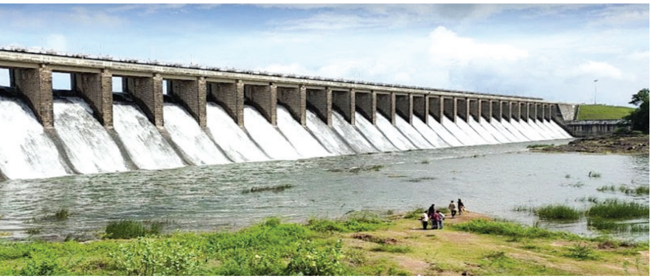
રાજકોટ જિલ્લાના જળાશયોમાં પાણીની ટકાવારી

સ્વરૂપે હજુ પણ પાણીની આવક વધુ ગયો છે વરસાદ પડે કે ન પડે લોકોને શંકાને સ્થાન નથી. હાલ સરકારે પણ એ વાતની તકેદારી રાખતા જણાવ્યું છે કે ડેમ વિસ્તાર માં જે લોકો વસવાટ કરતા હોય તેઓએ અન્ય સુરક્ષિત જગ્યાએ જવું કારણકે હાલ જળાશયોની સપાટીમાં ઉતરોતર વધારો થઈ રહ્યો છે ત્યારે કોઈ પણ પ્રકારની દુર્ઘટના ન ઘટે તે વાતની ગંભીરતાને ધ્યાને લઈને જ આ પગલું ભરવાનો નિર્ણય હાલ તંત્ર દ્વારા લેવામાં આવ્યો છે. મળતી માહિતી મુજબ આ અંગે હવામાન વિભાગ દ્વારા પણ આગામી ત્રણ થી ચાર દિવસ માટે આગાહી કરવામાં આવી છે જેમાં જણાવ્યું છે કે હજુ પણ વરસાદ વરસવાની પૂર્ણ સંભાવના છે ત્યારે ડેમનું જનસર સતત ઊંચું આવે તેવું પણ માનવામાં આવી રહ્યું છે. નપાણીઓ ગણાતો રાજકોટ જિલ્લા હાલ જે રીતે સૌની યોજના થી જોડાયો છે તે બાદ કોઈ પણ સમસ્યા લોકોને પીવાના પાણીની સત્તાવી નથી જે આગામી દિવસોમાં પણ યથાવત રહેશે.