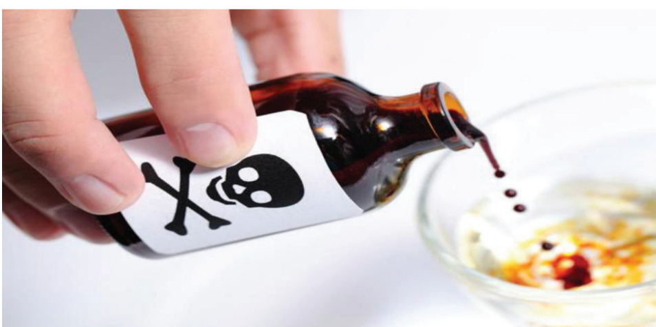
નોનવેજના ઇન્સ્ટાગ્રામ ફેન્ડ સામે તેણીએ આક્ષેપો કર્યા છે અને એક ચિઠ્ઠી લખી તેમાં પણ આ વિગતો જણાવતાં પોલીસે આ મામલે તપાસ આરંભી હતી.

રાજકોટ, તા. ૨૬ સોશીયલ મિડીયા થકી મિત્ર બનાવી હેરાન પેરેશાન કરવાના કે ફસાવવાના કિસ્સા અવાર-નવાર બનતા રહે છે. દરમિયાન આવી વધુ એક ઘટનામાં એક પરિણીતા ઇન્સ્ટાગ્રામ ફેન્ડના કારણે પેરેશાન થઈ જતાં આપઘાતનો પ્રયાસ કર્યો હતો. તેણીએ સ્યુસાઇડ નોટ પણ લખી હતી. જેમાં પોતાને ઇન્સ્ટાગ્રામ ફેન્ડે મરવા મજબૂર કરી દીધાનો આક્ષેપ કર્યો હતો. પરિણીતા સારવાર માટે હોસ્પિટલમાં દાખલ થતાં પોલીસે તેણીના આક્ષેપો મામલે તપાસનો ધમધમટ શરૂ કર્યો છે. વિગતો પર નજર કરીએ તો આ બનાવ જસદણનો છે. જસદણમાં હાલ પતિથી અલગ બહેનપણીના ઘરે રહેતી ૨૧ વર્ષિય પરિણીતાએ રાતે સાડા દસેક વાગ્યે જસદણના બગીચામાં ઝેરી દવા પી આપઘાતનો પ્રયાસ કરતાં સારવાર માટે રાજકોટ સિવિલ હોસ્પિટલમાં ખસેડવામાં આવી છે. ઇન્સ્ટાગ્રામ ફેન્ડ સામે તેણે આક્ષેપો કર્યા છે અને એક ચિઠ્ઠી લખી તેમાં પણ આ વિગતો જણાવતાં પોલીસે આ મામલે તપાસ આરંભી હતી. વધુ માહિતી અનુસાર જસદણમાં હાલ પોલીસ સ્ટેશન પાછળ પોતાની બહેનપણીના ઘરે રહેતી પરિણીતાએ રાતે સાડા દસેક વાગે જસદણના બગીચામાં ઉદર મારવાની દવા પી લીધી હતી. તેણીને જસદણ સારવાર અપાવી રાજકોટ સિવિલ હોસ્પિટલમાં ખસેડાતાં હોસ્પિટલ ચોકીના