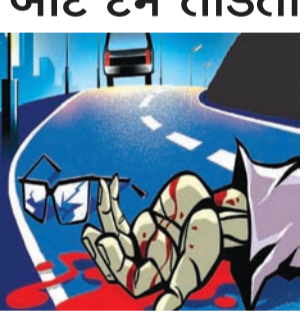
ઓગણીસમી ઓગણના રોજ બાઈક હંકારી જતો હતો ત્યારે ત્રિકોણબાગ પાસે ખાનગી બસની ઠોકરે ચડી જતાં ગંભીર ઈજા થતાં સિવિલમાં, ત્યાંથી એચસીજી હોસ્પિટલમાં