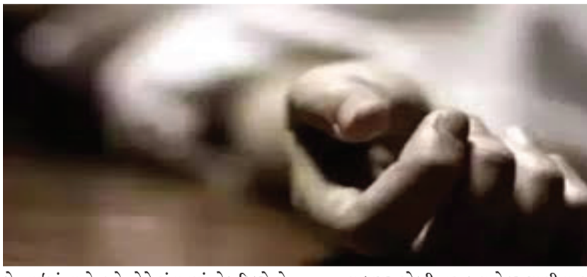
બે ભાઈમાં નાનો હતો. તેને સંતાનમાં એક દિકરો છે. તે ખેતી કરવાની સાથે ચાની હોટલ પણ ચલાવતો હતો. તેણે આપઘાત શા માટે કર્યો? તે અંગે પરિવારજનો જાણતાં ન હોઈ પોલીસે તપાસ યથાવત રાખી હતી. આ બનાવથી માસુમ દિકરાએ પિતાની છત્રછાયા ગુમાવતાં પરિવારજનોમાં ગમગીની વ્યાપી ગઈ હતી. અંતિમવિધી બાદ પોલીસ વિશેષ તપાસ માટે મુતકના સ્વજનો, પરિવારજનોના નિવેદનો નોંધવા તજવીજ કરશે. આમ અપમૃત્યુની ઘટનાઓ જે તે પરિવારોને શોકમાં ધેલેલી ગઈ હતી.