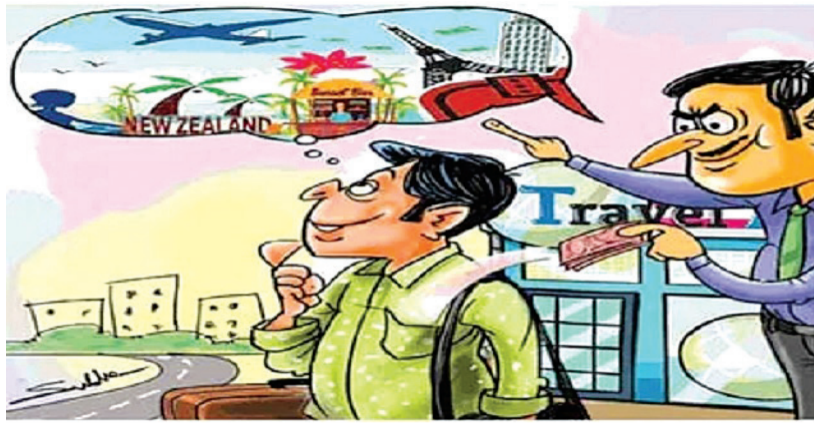
સસ્તામાં જેસીબીના નામે અગીયાર લાખની ઠગાઈ : માથે જતાં ધમકી પણ મળી