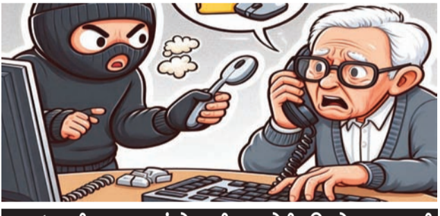
દગાઈના બીજા બનાવમાં દોસ્તની દગાખોરી: મિત્રને ૧૪ લાખની લોન અપાવી દીધી પછી તેણે રકમ પાછી જ ન દીધી!

રાજકોટ તા. ૨૭ ડિજીટલ એરેસ્ટ કરી ફોડ આચરવાના બનાવો સતત બની રહ્યા છે. રાજકોટમાં કોર્ટના નિવૃત્ત કલાર્ક અને તેના પત્નિને ડિજીટલ એરેસ્ટ કરી ગઈયાઓએ અકસાસી લાખ પચાસ હજાર પડાવી લીધાનો કિસ્સો તાજે જ છે ત્યાં વધુ એક બનાવમાં એક વૃદ્ધને ડિજીટલ એરેસ્ટ કરી સાડત્રીસ લાખ પચાસ હજાર પડાવી લેવાયા છે. તમારા નામે ખુલેલા એકાઉન્ટમાં છ કરોડના મોટા વ્યવહારો થયા છે તેમ કહી ડરાવી ધમકાવી વૃદ્ધ પાસેથી નાણા ખંખેર્યા હતાં.