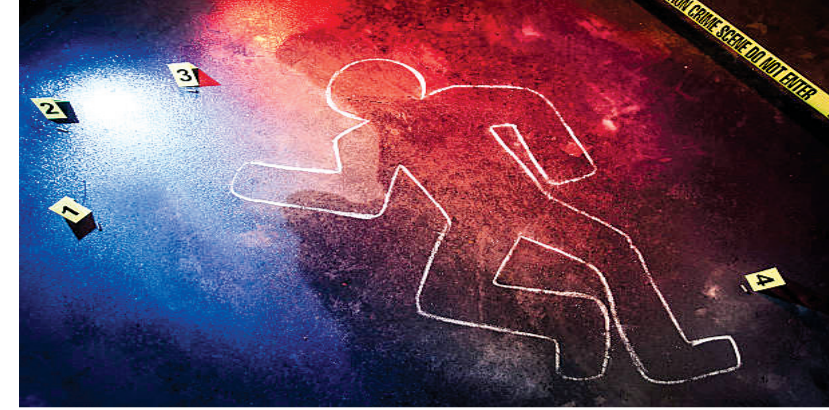
હત્યાની અન્ય બે ઘટનામાં મહિલાને સગી બે ભાણેજ સહિતે પતાવી દીધી, બહેનને ભાઈએ મારી નાખી