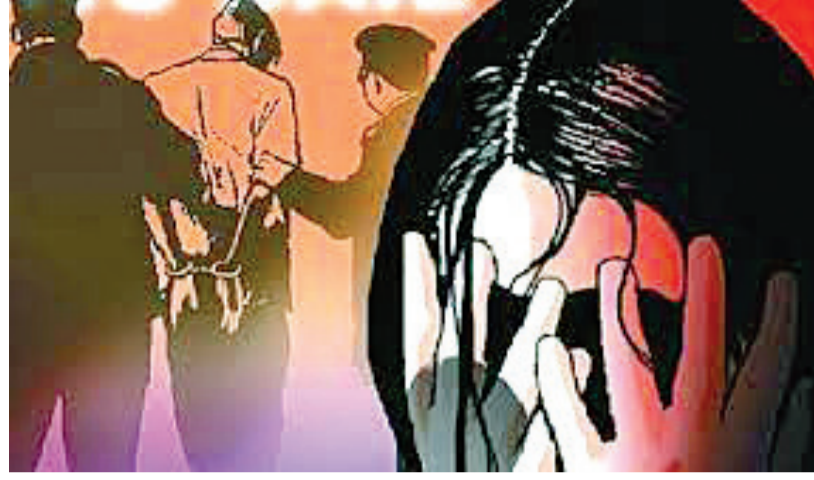
બીજી ઘટનામાં જેને દિકરી માની કન્યાદાન કર્યું તે ઘરે આટો મારવા આવતાં ઢગાએ પીંખી નાંખી: બળાટકારમાં પત્નિ પણ મદદરૂપ થઈ!

પરણેલો છે તેણે પોતાની જ સગી બહેન ઉપર દુષ્કર્મ આચરતા ભારે બળભંગાટ મચી જવા પામ્યો હતો. પરિણીત આરોપીની પત્નિ પિયર ગઈ હતી ત્યારે તેમજ એક વાર ઘરની બહાર જતાં ભાઈને તેની જ બહેનને છરીનો ડર બતાવી દુષ્કર્મનો ભોગ બનાવી હતી. આ ઘટનાની જાણ યુવતીએ પરિવારના સભ્યોને જાણ કરતા સગી બહેને જ તેના ભાઈ વિરૂદ્ધ તળાજા પોલીસ મથકમાં દુષ્કર્મની ફરિયાદ નોંધાવી હતી. તળાજા તાલુકાના એક ગામે રહેતા એક સંયુક્ત પરિવારમાં રહેતા એક પરિણીત પુરૂષે તેની જ નાની સગી બહેન ઉપર દુષ્કર્મની ઘટના પ્રકાશમાં આવી છે. ગ્રામ્ય પંથકમાં રહેતા યાર બહેન અને બે ભાઈ તેમજ માતા-પિતા સાથેના સંયુક્ત પરિવારમાં રહેતા એક કળિયુગી પરિણીત ભાઈએ ઘરે એકલાનો લાભ લઈ તેની બહેન ઘરે હતી તે વેળાએ સગી નાની બહેનને છરીનો ડર બતાવી દુષ્કર્મ આચર્યું હતું. પોલીસના સુત્રોએ જણાવ્યા મુજબ પરિવારના તમામ સભ્યો તેમજ પરિણીત આરોપીની પત્નિ એક વખત પિયરે ગઈ હતી