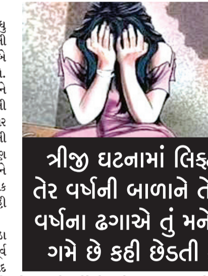
ત્રીજી ઘટનામાં લિક્ષ્ટમાં તેર વર્ષની બાળાને તેત્રીસ વર્ષના ઢગાએ તું મને બહુ ગમે છે કહી છેડતી કરી

રાજકોટ, તા. ૨૮ દૂષ્કર્મની ઘટનાઓ રોજબરોજ સામે આવતી રહે છે. વધુ આવા કિસ્સા બન્યા છે. જેમાં એક નર્સ સાથે યુવાને લગ્નની લાલચ આપી વારંવાર દૂષ્કર્મ આચરી લીધું હતું અને બે વખત તો ગર્ભ પાત કરી ગર્ભપાત પણ કરાવી નાખ્યો હતો. છેલ્લે આ હવસખોરે લવ સેક્સ ઓર ઘોખાની જેમ આ નર્સને તરછોડી દીધી હતી. છેતરાયેલી યુવતિએ અંતે પોલીસની મદદ લેતાં પોલીસે કાર્યવાહી કરી બળાટકારની એક્ઝાઈટ્ઝ આર નોંધી હવસખોર શખ્સને પકડી લેતાં જોવાની નાખ્યો હતો. નોખત આવી હતી. બીજા કિસ્સામાં એક સગીરાનું અપહરણ કરી દૂષ્કર્મ આચરવામાં આવ્યું હતું. આ કેસમાં આરોપીને પોલીસે શોધી કાઢ્યો હતો. ત્રીજી ઘટનામાં તેત્રીસ વર્ષના એક ઢગાએ લિક્ષ્ટમાં તેર વર્ષની બાળાને તુ મને બહુ ગમે છે કહી ફોન નંબર માંગી છેડતી કરી લીધી હતી.