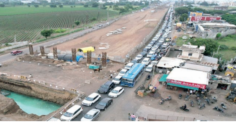
પરિણામ આવ્યું નથી અને હાલની ગતિએ જે રીતે કામગીરી આગળ વધી રહી છે તે જોતા આ કામ વર્ષની અંદર પૂર્ણ થાય તો પણ મોટી વાત છે અને જાણકાર સૂત્રોના જણાવ્યા અનુસાર આ કામ હજુ સપ્ટેમ્બર ૨૦૨૬ સુધી ચાલશે તેવું અનુમાન પણ લગાવવામાં આવી રહ્યું છે. આ હાઈવે પર કુલ ૩૦ નવા બ્રિજ બનાવવામાં

કરી દીધું હતું કે ઝડપભરે આ હાઈવે નો કામ પૂર્ણ કરી દેવામાં આવશે. ત્યારે એ વાત તો સ્પષ્ટ થઈ ગઈ છે કે આ હાઈવે પરથી પસાર થતાં લોકોએ હજુ એક વર્ષ જેટલો સમય આ ટ્રાફિકની જટિલ સમસ્યા માંથી પસાર કરવો પડશે અને તેનો કોઈ ઈલાજ પણ નથી. રાજકોટ જેતપુર હાઈવે નું કામ જે ગતિએ ચાલી રહ્યું છે તેમાં જાણકાર વર્તુળોના જણાવ્યા અનુસાર હજુ ૫૦ ટકા કામ પણ પૂર્ણ થયું નથી અને ત્યારે ફરી એક વખત એક વર્ષની મુદત આપવામાં આવી છે. પરંતુ ક્યા કારણસર તેની કોઈ સ્પષ્ટતા કરવામાં આવી નથી પરંતુ એ વાત તો સ્પષ્ટ છે કે એજન્સી દ્વારા હાલ જે અણગળ રીતે કામ થઈ રહ્યું છે તે અત્યંત જોખમી અને લોકો માટે ઘણા ખરા પ્રશ્નો ઊભા કરે તેમ છે. માત્ર વાતો કરવી અને મોટા દંડ ફટકારવાની જાહેરાત કરી લોકોને મામુ બનાવવામાં આવ્યા હોવાનું પણ માલુમ પડ્યું છે. બારસો કરોડથી વધુના ખર્ચે જે સીક્સ લેન હાઈવે ની કામગીરી ચાલી રહી છે તેને ખાસ એવો સમય પણ વ્યતિત થઈ ગયો છતાં કોઈ નક્કર