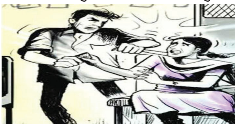
બીજી ઘટનામાં સરપંચને બળાટકારમાં ફીટ કરી દેવાની ધમકી : કંટાળીને પી ગયા ઝેરી દવા!