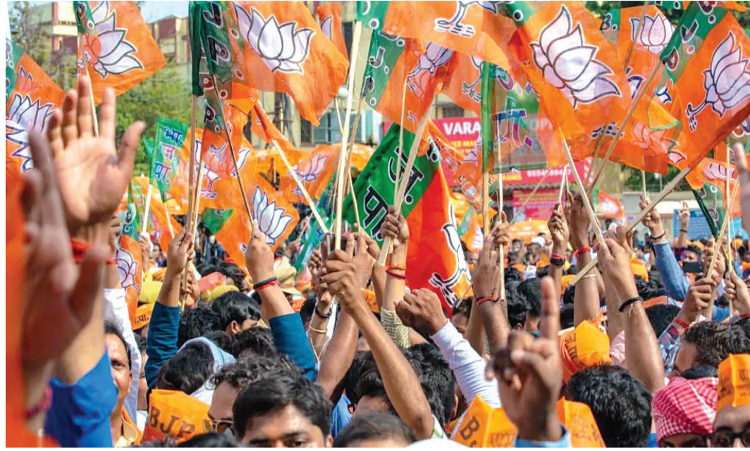
ભિભા થયા છે તેને કેવી રીતે ડામવા માટેની વ્યુહ રચના ઘડવા માટે પણ સાંસદોને દિલ્હીનું તેડું આવ્યું હોય તેવું પણ મનાઈ રહ્યું છે. એટલું જ નહીં પાર્ટી હાઈ કમાન્ડની સાથે સાંસદોનું પણ જોડાણ વધે તે પણ એટલું જ

રાજકોટ, તા. ૨ હાલ વિરોધ પક્ષ જે રીતે પોતાનો પગ પેસારો કરી રહ્યું છે તેને ધ્યાને લઈ આગામી સમયની રણનીતિ માટે ગુજરાત સહિત દેશના અનેક રાજ્યો તથા રાષ્ટ્રીય સ્તરે ભાજપની સંગઠનાત્મક બેઠકનું આયોજન કરવામાં આવ્યું હોવાની વાત સામે આવી છે એટલું જ નહીં હાલ ઉપરાષ્ટ્રપતિની ચૂંટણી પણ સરકાર માટે અત્યારે ખૂબ મહત્વનો મુદ્દો બની ગઈ છે ત્યારે નવમીના રોજ દિલ્હીમાં ઉપરાષ્ટ્રપતિની ચૂંટણી તથા સાંજે પરિણામ બાદ નવરાત્રી પૂર્વે ભાજપ તેની સંગઠનાત્મક ચૂંટણી પૂર્ણ કરે તેવું અનુમાન લગાવવામાં આવી રહ્યું છે ત્યારે ભાજપ પક્ષના તમામ સાંસદોને દિલ્હીમાં હાજર રહેવા માટે પણ આદેશ કરવામાં આવ્યા છે ઉપરાષ્ટ્રપતિની ચૂંટણીને ધ્યાને લઈ તારીખ ૬ સપ્ટેમ્બર સહી તારીખ ૯ સપ્ટેમ્બર એમ ચાર દિવસ દરેક સાંસદ સભ્યો દિલ્હીમાં હાજર