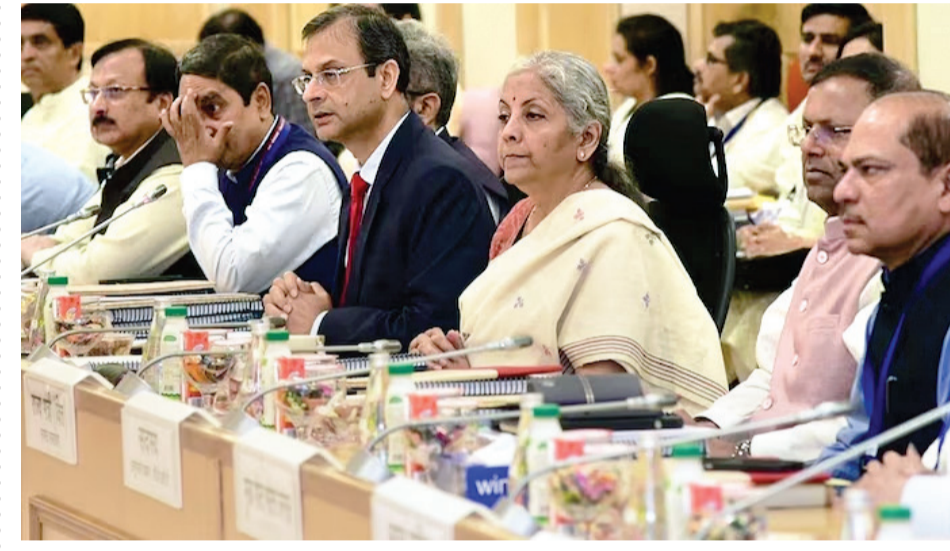
૧૨% ના સ્લેબની વસ્તુઓ ૫%ના સ્લેબમાં આવે તેવી સંભાવના

GST કાઉન્સિલની બેઠકનું કાઉન્ટાઉન શરૂ થઈ ગયું છે. અમેરિકા દ્વારા લાદવામાં આવેલા ટેરિફ પછી કેન્દ્ર સરકારે GST સુધારાઓ આગળ ધપાવ્યા હોવાથી દેશ માટે આ મહત્વપૂર્ણ છે. આમાં કરવેરા તર્કસંગતીકરણની શક્યતા છે, ખાસ કરીને ઓટો, FMCG જેવા વપરાશ-આધારિત ક્ષેત્રો માટે, જ્યાં સરકાર વધુ લાભ આપી શકે છે. GST દરોમાં ઘટાડો કરવાની જરૂર છે કારણ કે ઘણી વસ્તુઓ માટે દર ઘટાડીને ૫ ટકા કરી શકાય છે અથવા મુક્તિ આપી શકાય છે પરંતુ ઇનપુટ સેવાઓનું શું થશે તે જોવાનું બાકી છે. મોટાભાગની ઇનપુટ સેવાઓ ૧૮ ટકા GST આકર્ષે