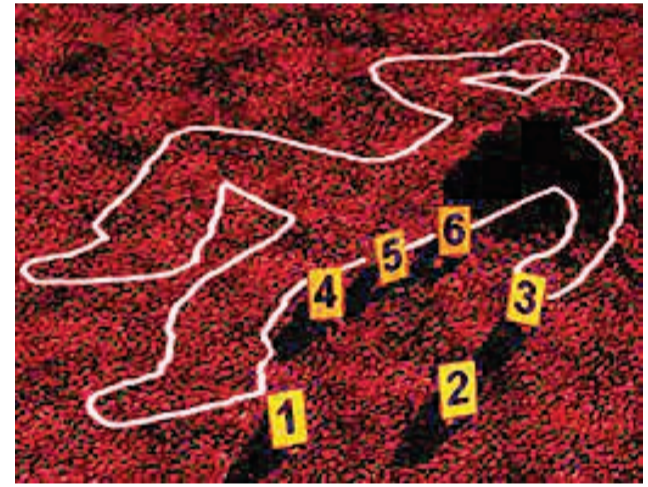
બીજી ઘટનામાં ૧૦૦ રૂપરડી નહિ આપનાર પતિને પતિએ પથ્થર-ઈટના ઘા ફટકારી મોત દીધું

રાજકોટ, તા. ૨ ખુનસ લઈને ફરતો માણસ ક્યારે કોના માટે કાળ બની જાય તે કહી શકાતુ નથી. હત્યાની વધુ બે ઘટના સામે આવી છે. જેમાં એક બનાવમાં પોતાની બહેન સાથે વાત કરનારા શખ્સને ટપકો આપતાં યુવાન પર હુમલો થયો હતો. વચ્ચે પડતાં તેના પિતાને પણ છરીના ઘા ઝીંકાયા હતાં. જેમાં આ યુવાનના પિતાનો ભોગ લેવાઈ ગયો હતો. બીજી ઘટનામાં સો રૂપરડી માટે દંપતિ વચ્ચે ઝઘડો થતાં પતિએ પથ્થર ઈટના ઘા મારી પતિને ઢાળી દીધી હતી. હત્યાની પ્રથમ ઘટના જોઈએ તો નારોલમાં આવેલા રાધે હોમ્સમાં બહેન સાથે વાતચીત કરતા યુવકને ટપકો આપવા બાબતે મોડી રાતે ખૂની ખેલ ખેલાયો હતો જેમાં ચાર લોકો હથિયારો સાથે ઘસી આવ્યા હતા અને છરી ઈન્સપેક્ટર એન. જી. વાઘેલાની રાહબરીમાં પીએસઆઈ એમ. એસ. મહેશ્વરી અને ટીમે તપાસ હાથ ધરી બે શકમંદને ઉઠાવી લીધા છે. આ બંનેની પુછપરછમાં ભેદ ખુલવાની અને બીજા ગુના ઉકેલાવાની પણ પોલીસને આશા છે.