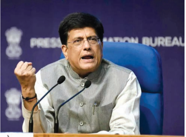
ફાયદાકારક વેપાર સોદા માટે તૈયાર છીએ," તેમણે ઉમેર્યું. વાણિજ્ય અને ઉદ્યોગ મંત્રી પીયૂષ ગોયલે મંગળવારે પણ પુષ્ટિ આપી હતી કે ભારત દ્વિપક્ષીય વેપાર

નવીદિલ્હી, તા. ૨ વાણિજ્ય અને ઉદ્યોગ મંત્રી પીયૂષ ગોયલે ભારત-યુએસ વેપાર વાટાઘાટો સમયમર્યાદા દ્વારા નહીં, પરંતુ તર્ક અને ન્યાયીપણા દ્વારા સંચાલિત થાય છે. અમેરિકા-ભારત વેપાર વાટાઘાટો પ્રત્યે દેશના અભિગમ પર બોલતા, ગોયલે ભારત-યુએસ વેપાર વાટાઘાટો કરવાની દબાણ હેઠળ કાર્ય કરતું નથી. "અમે ક્યારેય સમયમર્યાદા વેપાર સોદા પર વાટાઘાટો કરતા નથી - અમે ફક્ત સારા વેપાર સોદા પર વાટાઘાટો કરીએ છીએ જે પરસ્પર ફાયદાકારક હોય," ગોયલે કહ્યું. તેમણે વધુમાં ઉમેર્યું કે ભારત તેની બધી ભાગીદારીમાં ન્યાયીપણા સુનિશ્ચિત કરવા માટે પ્રતિબદ્ધ છે. "અમે હંમેશા વાજબી અને પરસ્પર