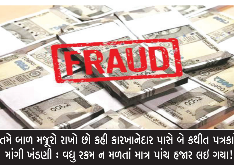
તમે બાળ મજૂરો રાખો છો કહી કારખાનેદાર પાસે બે કથીત પત્રકારે માંગી ખંડાણી : વધુ રકમ ન મળતાં માત્ર પાંચ હજાર લઈ ગયા!