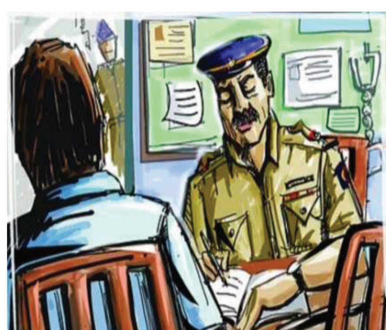
બાળાએ પિતાને ફોન કરી કહ્યું મને અહિંથી તેડી જાય, મારે આ અભિષેક સાથે લગ્ન નથી કરવા, અભિષેક પણ પોતાની પાસે ભાડુ ન હોઈ દિકરીને તેડી જવા કહ્યું: આમ છતાં શાપર પોલીસ ગંભીર ન બની: હવે રાજકોટ પોલીસ કરશે તપાસ

રાજકોટ, તા. ૫ પોલીસ પ્રજાનો મિત્ર છે...મે આઈ હેલ્પ યુ સુત્ર પોલીસે શાકાર કર્યું...આ પ્રકારના મથાળા હેડક્વોર્ટરના સમાચારો, પોલીસના વખાણ કરતાં વિડીયો સતત વાંચવા-જોવા મળતાં રહે છે. મોટા ભાગની પોલીસ પ્રજાની મદદ કરવા તત્પર હોય છે અને મદદ કરતી હોય છે. પરંતુ અમુક કિસ્સામાં કોઈપણ કારણોસર કે પછી આગસને લીધે પોલીસ ગંભીર બાબતોને પણ સરળ ગણી બેદરકારી દાખવતી હોય છે. શાપર પોલીસના એક તપાસનીશ આ કારણે ચર્ચાને યકડોળે ચડ્યા છે. તેમણે દાખલેલી બેદરકારી કે પછી આગસ એકાઉન્ટનાર સ્વરૂપે સામે આવી છે. ૧૬ વર્ષની એક બાળા ગૂમ થયાના કિસ્સામાં તપાસનીશે અઢી અઢી મહિના સુધી દિકરીના પિતાને કોલ ડિટેઇલ આવે પછી આગળ વધ્યું તેવી વાતો કરી હતી. પણ છેલ્લે હવે તમારે પાક્કી એકાઉન્ટનાર કરવી હોય તો નવાગામ વિસ્તારમાં રહેતાં મહિલાએ જણાવ્યું છે કે મારે સંતાનમાં એક દિકરી અને ત્રણ દિકરા છે. જેમાં નાની દિકરી ૧૭ વર્ષની છે. ૧૫/૮ના રોજ દિકરી સાંજે સાતેક વાગ્યે પોતાની બહેનપણીને મળવા જાય છે, અમણા આવે છે તેમ કહીને ઘરેથી ગયા બાદ મોડે સુધી પરત આવી નહોતી. ગામમાં તેમજ અલગ અલગ જગ્યાએ તપાસ કરવા છતાં તે મળી નહોતી. આખરે જવાની બીકે અમે અત્યાર સુધી પોલીસને જાણ કરી નહોતી. પરંતુ દિકરીની કોઈ ભાગ ન મળતાં અંતે ફરિયાદ કરી હતી. બંને બનાવમાં કુવાડવા રોડ પોલીસ સ્ટેશનના ઈન્સ્પેક્ટર બી. પી. રજવાના માર્ગદર્શનમાં પીએસઆઈ બી. વી. ભગોરા અને હેડકોન્સ પી. જી. અગ્રવાલે ફરિયાદ નોંધી તપાસ આરંભી છે.