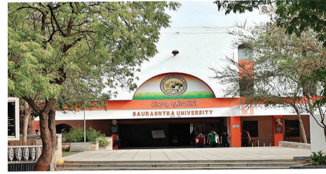
શૈક્ષણિક સંસ્થાઓ અને સંકુલો દ્વારા કહેવામાં આવી રહ્યું છે કે રાષ્ટ્રીય શિક્ષણનીતિની અમલવારી શરૂ કરી દેવામાં આવી છે પરંતુ વાસ્તવિકતા એ છે કે જે ગતિએ થવી જોઈએ તે થઈ શકે નથી અને પરિણામ સ્વરૂપે વિદ્યાર્થીઓને પણ આની માઠી

રાજકોટ, તા. ૫ સૌરાષ્ટ્ર યુનિવર્સિટી દ્વારા હાલ જે પગલાંઓ લેવામાં આવી રહ્યા છે તેને લઈને ઘણા ખરા વિરોધો ઉઠી રહ્યા છે. અગાઉ પણ અનેકવિધ મુદ્દે યુનિવર્સિટી ચર્ચાનો વિષય બની છે ત્યારે સૌરાષ્ટ્ર યુનિવર્સિટી દ્વારા એકિલીએટેડ એટલે કે સંલગ્ન કોલેજના અધ્યાપકો સહાયકોને અનુસ્નાતક શિક્ષક તરીકે માન્યતા લાંબા સમયથી આપવામાં આવી નથી જેને લઈને ફરી વખત આ મુદ્દો હાલ ચર્ચાનો વિષય બની ગયો છે આ અંગે રાજ્ય સરકાર ને પણ રજૂઆત કરવામાં આવી છે પરંતુ વાસ્તવિકતા જે રીતે કામ થવું જોઈએ તે થઈ શક્યું નથી અને સૌરાષ્ટ્ર યુનિવર્સિટીને ઘણા ખરા અન્ય પ્રશ્નો પણ ઊભા થયા હોવાનું માલુમ પડ્યું છે.