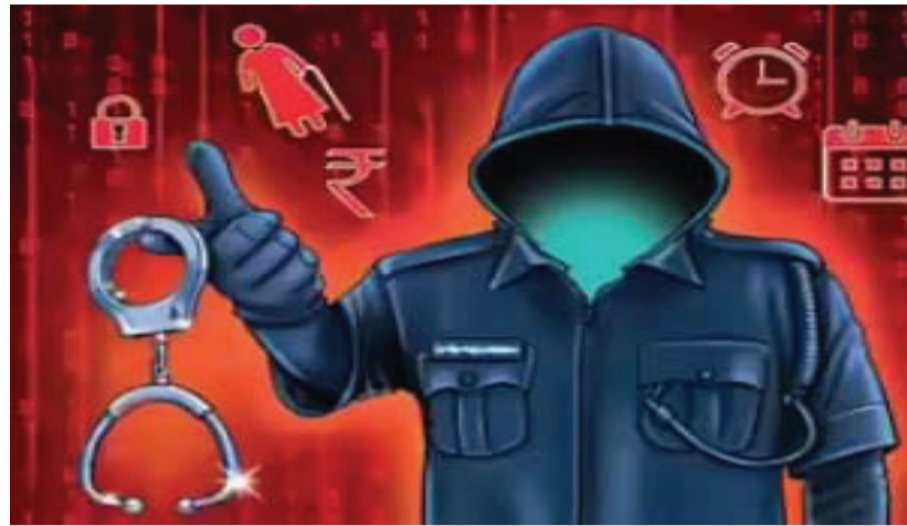
ફોડ કરી ઈ-વેસ્ટિંગેશનમાં મૂકવાનું છે. આપવો પડશે, જો નહીં આપો તો તમને અને તમારે સીબીઆઈની તપાસમાં સહયોગ ત્રણથી દસ વર્ષ સુધીની સજા જેલમાં મૂકવાની

ફસાવવાની ધમકી આપી નારણપુરાના અક્યોતેર વર્ષીય વૃદ્ધને તેર દિવસ સુધી ડિજિટલ એરેસ્ટ કરી રૂ. ૩૯.૯૪ લાખની કમ્પાઉન્ડ કરવામાં આવી હતી. આ છેતરપિંડી અંગે સાયબર ક્રાઈમ બ્રાન્ચે ગુનો નોંધી વધુ તપાસ આદરી છે. નારણપુરામાં રહેતા વયોવૃદ્ધ દંપતીનાં સંતાનો વિદેશમાં વસે છે. વૃદ્ધના મોબાઇલ ફોનમાં આવેલા અજાણ્યા ફોનમાં મુંબઈ ક્રાઈમ ઓફિસર દેવીલાલ અને પવાર સાહેબ સીબીઆઈ ઓફિસર તરીકેની ઓળખ આપી, તમારા નામે આધાર કાર્ડ ખોલાવવા તમે રૂ. ૨૫ લાખ અને કેનેરા બેન્કમાં ખાતું ખોલાવવા રૂ. ૫ લાખ લીધા છે. તમારા ખાતાંના ઉપયોગથી મની લોન્ડરિંગ કેસમાં થયો છે. ત્યારબાદ ગઠીયાઓએ વૃદ્ધને કહ્યું હતું કે જેટ એરવેઝના માલિક નરેશ ગોયેલ સાથેના રૂ. ૪૫૦ કરોડના ફોડ કેસમાં તમારા ખાતાંનો ઉપયોગ થયો છે. સુપ્રીમ કોર્ટે તમારું એકાઉન્ટ