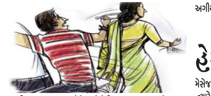
દસ મહિનાના બાળકના હાથમાંથી કડલીની ચિલડાપ બાદ સતત બીજી ઘટના