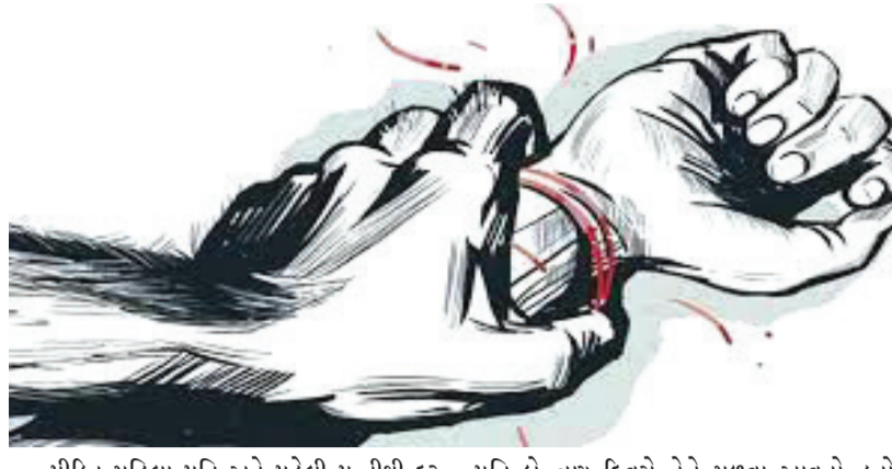
પીડિત મહિલા પતિ અને પહેલી પત્નીથી દુર પોતાના બે સંતાનો સાથે રહેતી હતી. જોકે, તેનો પતિ બે-ત્રણ દિવસે તેને મળવા આવતો હતો. આ દરમિયાન એક સાંજે પીડિત મહિલાના પતિની

રાપર પંથકમાં બની છે. કચ્છના રાપરમાંથી સંબંધોને લજવતો વધુ એક કિસ્સો સામે આવ્યો છે. જ્યાં સાવકા પુત્રએ જ માતા પર બળજબરી પૂર્વક દુષ્કર્મ આચર્યું છે, હવસખોરી બચવા માતાએ બુમાબુમ કરીને લોકોની મદદ માંગી હતી. આજુ બાજુ કોઈ રહેતું ન હોવાથી મહિલા દુષ્કર્મનો ભોગ બની હતી. ઘટનાના બીજા દિવસે મહિલાએ પિયર આવીને સાવકા પુત્ર સામે ફરિયાદ નોંધાવી છે. આ ઘટના અંગે પોલીસ સુત્રોમાંથી મળતી માહિતી મુજબ પાટણ જિલ્લાના રાધનપુર તાલુકાના એક ગામની મહિલાના બીજા લગ્ન રાપર તાલુકાના એક ગામના પરિણીત યુવક સાથે વિસેક વર્ષ અગાઉ થયા હતા. આ મહિલાના પતિની પહેલી પત્નિને ત્રણ પુત્રો છે. જ્યારે પીડિત મહિલાને બે સંતાનો છે.