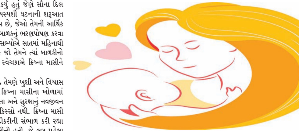
બીજા કિસ્સામાં પરિણીતાને ગર્ભપાત કરાવવા સાસુએ કર્યું દબાણ : પતિએ પણ ગુજાર્યો અનહદ ત્રાસ