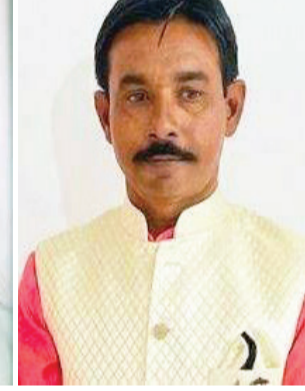
વોર્ડ નં. ૯ના ભાજપ નગરસેવકના નાના ભાઈનું હૃદય બંધ પડી જવાથી મૃત્યુ થયું: પરિવારમાં ગમગીની