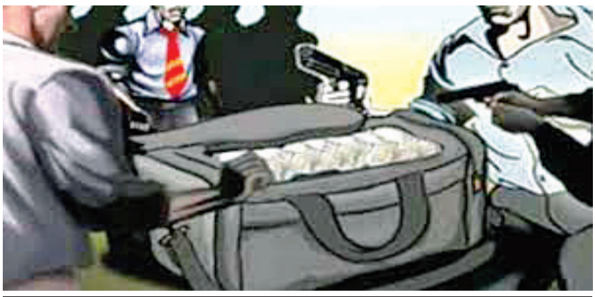
બીજી ઘટનામાં પશુઆહારના ધંધામાં રોકાણના નામે સવા કરોડની છેતરપીંડી