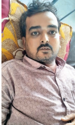
બટાઝટીની અન્ય ઘટનામાં ઝૂપડા માટે ખાડો ખોદવા મામલે મહિલાની ધોલધપાટ એક મહિલાને જમાઈએ વેવાણે મારકુટ કરી

રાજકોટ, તા. ૯ શહેરમાં અવાર-નવાર ભુખખાગીરી, ગુંડાગીરીની ઘટનાઓ બનતી રહે છે. હાલતા ને ચાલતા આવારા તત્વો કાયદો હાથમાં લઈને ગમે તેના હાથ પગ ભાંગી નાંખે છે. ગમે ત્યારે આ પ્રકારની ઘટના ગમે તે વિસ્તારમાં બનતી રહે છે. પોલીસનો ભય જ ન હોય એ રીતે અમુક તત્વો કાયદાની ઐસી તૈસી કરી નાખતા હોય છે. આવી જ વધુ એક ઘટના સામે આવી છે જેમાં એક યુવાનને તે દાડૂ અંગે પોલીસને બાતમી આપતો હોવાની શંકા કરી તેનું મોટરસાઇકલમાં ચાર જણાએ અપહરણ કરી બેકામ રીતે મારકુટ કરી હતી. અલગ અલગ ત્રણ જગ્યાએ તેને લઈ જઈ ધોકાવ્યો હતો અને બાદમાં ધમકી દઈ છોડી મુકાયો હતો. તે સારવાર માટે હોસ્પિટલના ખાટલે પહોંચતા તપાસ શરૂ કરવામાં આવી હતી.