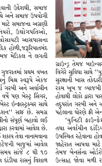
ગ્રાઉન્ડ તેમજ બાઉન્સર, સિક્યુરિટી સિસ્ટમ તથા ઈઈઝટ કેમેરા વિગેરે સુવિધા સાથે “યુનિટી ફાઉન્ડેશન” દ્વારા લોક સલામતી અને સુરક્ષાની ખાસ તકેદારી રાખવામાં આવેલ હોવાથી તેમજ પાસની રકમ ખુબ જ વ્યાજબી અને આ રકમ સમૂહ લગ્ન માટે વપરાતી હોવાથી લોકો દ્વારા પાસ કઢાવવા માટે બહોળો પ્રતિસાદ મળેલ છે તદુપરાંત ગરબી અને અર્વાચીન દાંડીયા રાસ જોવા માટે વહેલા તે પહેલાના ધોરણે ફ્રી એન્ટ્રી રાખવામાં આવી છે. ‘યુનિટી ફાઉન્ડેશન’ દ્વારા આયોજિત નવદુર્ગા ગરબી તથા અર્વાચીન દાંડીયા સાથે હોવાથી મોટી સંખ્યામાં લોકો ઉપસ્થિત રહેવાના હોવાથી ટ્રસ્ટ, કંઈકે સ્કીન અને બેનર મારફતે જાહેરાત આપવા માટે લોકોની મોટા પાયે ઇનકુવાયરી આવતા તેમજ બેનરસંના ઓર્ડરો આવતા ‘યુનિટી ફાઉન્ડેશન’ની ટીમમાં જહેમત ઉઠાવી રહ્યા છે હાલમાં છેલા એક મહિનાથી

રાજકોટ, તા. ૧૫ યુનિટી ફાઉન્ડેશન, સમાજને કંઈક આપવાની ઉદ્દેશથી, સમાજ એકતા દ્વારા રાષ્ટ્રીય એકતા ના સંકલ્પ સાથે અને સમાજ ઉપયોગી અને હિન્દુ સંસ્કૃતી જતન અને જાળવણી માટે સમાજના અગ્રણી વ્યક્તિઓ ડોક્ટરો, વકીલો, એન્જિનિયરો, ઉદ્યોગપતિઓ, રાજકીય અગ્રણીઓ, અને સત્યસાઈ સોસાયટી આસપાસના સમાજ શ્રેણીઓ દ્વારા પ્રાચીન ગરબી, વૈદિક હોળી,જરૂરિયાતમંદ દીકરીઓના સમુહ લગ્ન, યોગ દિવસ તેમજ મૈત્રિકલ ને લગતી પ્રવૃત્તિ છેલા ત્રણ વર્ષથી કરી રહી છે. ગત વર્ષની જેમ આ વર્ષે પણ સમગ્ર ગુજરાતમાં પ્રથમ વખત પ્રાચીન ગરબી ને અર્વાચીન દાંડીયા રાસનું મિશ્ર સ્વરૂપે એકજ સ્થળે આયોજન કરવા જય રહેલ, નવદુર્ગા ગરબી અને અર્વાચીન દાંડીયાને બહોળો પ્રતિસાદ મળેલ છે આ વર્ષે પણ બેસ્ફ્ર સિંગર, ઓરેકેસ્ટ્રા, સાઉન્ડ સિસ્ટમ, એન્કર તથા બેસ્ટ ઇન્ફોર્મેશન સાથે ખેલવાઓને આવકારવા “યુનિટી ફાઉન્ડેશન” સફળ છે. સમગ્ર કુટુંબ સહપરિવાર એક જ જગ્યાએ નવરાત્રીનો સંપૂર્ણ બહાવો લઈ શકે તેવી વ્યવસ્થા “યુનિટી ફાઉન્ડેશન” દ્વારા કરવામાં આવેલ છે. રાજકોટની મધ્યે સરળતાથી આવી-જઈ શકાય તેવા નાનામવાના સત્યસાઈ રોડ ઉપર આવેલ આલાપ હેરિટેજની બાજુમાં આવેલ ગોળાંમાં પ્રાચીન ૨૨ થી ૧ ઓક્ટોબર સમય સાંજે ૮ થી ૧૦ પ્રાચીન ગરબી અને ૧૦ થી ૧૨ અર્વાચીન દાંડીયા રાસનું વિશાળ