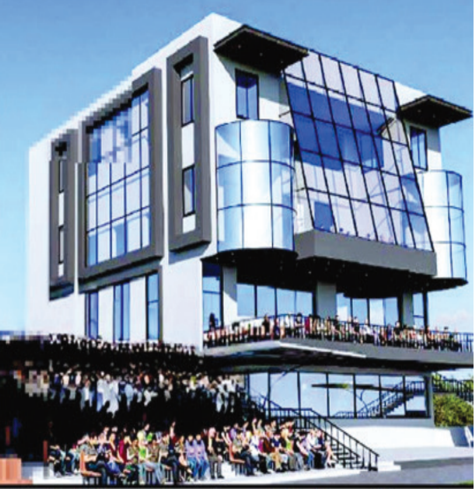
રેસકોર્સ ક્રિકેટ સ્ટેડિયમનું નવા પેવીલીયનની ડિઝાઇન

રાજકોટ, તા. ૧૫ અનેક વખત અગાઉ પણ મહાનગરપાલિકા દ્વારા માધવરાવ સિંઘિયા ક્રિકેટ સ્ટેડિયમને નવું રૂપ આપવા માટે વાચદાઓ કરી દરખાસ્તો કરી હતી ત્યારે ફરી એક વખત આ જ ગ્રાઉન્ડને નવું બનાવવા અને જૂના પેપેલિયનના નવીનીકરણ માટે ૬ કરોડનો ખર્ચ મંજૂર કરવામાં આવ્યો છે અત્યાર સુધી જેકલર્ડ લાઈટ હતી તે નવી કરી આપવામાં આવી છે અને તેનો લાભ ખાસ નવરાત્રીમાં સંચાલકો લેશે. ગઈકાલે યોજાયેલી સ્ટેડિયમ કમિટીની બેઠકમાં જર્જરિત પેપેલિયનને નવા બનાવવા માટે નરેન્દ્ર પટેલ નામની એજન્સીને કામ સોંપવામાં આવ્યું છે. આ અંગે ચેરમેને જણાવ્યું કે સ્ટેડિયમ ગરબા અને તે સિવાયની વિવિધ ઇવેન્ટ માટે અમદાવાદની જેમ ભાડે આપવામાં આવશે અને વિશેષ સુવિધાઓ પણ ઉમેરવામાં આવી રહી છે જેનો લાભ આગામી દિવસોમાં મળશે.