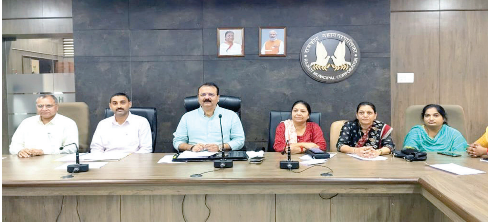
પગલે ઇસ્ટ ઝોનના રોડ રસ્તા સહિતના કામો માટે ખાસ એવું બજેટ ફાળવવામાં આવ્યું છે. બીજી તરફ રોડ રસ્તાની બિસ્માર હાલતના કારણે મહાનગરપાલિકા ની છબી ખરડાઈ છે જેને ધ્યાને લઈ આગામી દિવસોમાં એટલે કે પહેલી ઓક્ટોબરથી એક વિશેષ ઝુંબેશ ચુદ્ધના ઘોરણે શરૂ કરવામાં આવશે અને તમામ ઝોન વિસ્તારના વોર્ડમાં જે જગ્યાએ રોડ રસ્તા ખરાબ હશે ત્યાં તે રસ્તાનું રેસ્ટોરેશન કામ મેટલિંગ કામ તથા પેચ વર્કનું કામ યોજના ઘોરણે કરવામાં આવશે અને એ બાબતે કુલ ખર્ચ પણ નક્કી કરી લેવામાં આવ્યો છે જેમાં ઇસ્ટ ઝોન એટલે કે

રાજકોટ, તા. ૧૫ છેલ્લા ઘણા દિવસથી મહાનગરપાલિકાની કામગીરીમાં ઉઘલ પાથલ થઈ રહી છે ત્યારે આગામી મનપાની ચૂંટણીને લઈને હાલ અત્યારથી કામગીરી શરૂ કરી દેવામાં આવી છે મળતી માહિતી મુજબ ૧૧૪ કરોડ ના વિકાસ કામોને બહાલી મહાનગરપાલિકાની સ્ટેન્ડિંગ બેઠકમાં આપવામાં આવી અને અનેકવિધ વિવાદિત દરખાસ્ત હતી તેને પણ બહાલી મળી છે. ગઈકાલની સ્ટેન્ડિંગ કમિટીની બેઠકમાં ૩૨ દરખાસ્ત મુકવામાં આવી હતી તેમાંથી ૩૧ દરખાસ્તને સર્વનું મતે બહાલી આપવામાં આવી અને દરખાસ્ત નંબર ૧૬ કે જે સેન્ટ્રલ ઝોન બિલ્ડિંગ કચેરીમાં કનક રોડ તરફ આવેલું છે જૂનું ફાયર સ્ટેશનનું બિલ્ડિંગ છે તે બિલ્ડિંગ નવું બનાવવાના કામ માટે ૧૨.૪૨ કરોડથી વધુ નો ખર્ચ એસ્ટીમેટ સ્વરૂપે આવ્યો હતો જે ખાસ્સો વધુ હોવાના કારણે વિચારણા અર્થે આ દરખાસ્તને પેન્ડિંગ રાખવામાં આવી છે બાકી તમામ દરખાસ્તોને બહાલી અપાય છે. રાજકોટ પૂર્વ એટલે કે વિધાનસભા ૬૮ વિસ્તારમાં સૌથી વધુ કામ મંજૂર થયા હોવાનું માલુમ પડ્યું છે ત્યારે આ અંગે અગાઉ ધારાસભ્ય ઉદયભાઈ કાનગઢ દ્વારા ખાસ સૂચના આપવામાં આવી હતી કે જે પણ કામગીરી પેન્ડિંગ છે તેને તાકીદે પૂર્ણ કરવામાં આવે અને જે કામગીરી મંજૂર થયેલી છે તેની શરૂઆત કરી દેવામાં આવે જેના