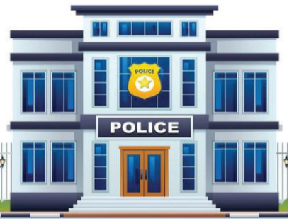
જેમાં, અરજીઓનું ઝડપી નિવારણ, ‘શી’ (SHE) ટીમ દ્વારા સિનિયર સિટીઝન સાથેની મુલાકાતો, પોલીસના ગેરવર્તનની અરજીઓ, ‘ત્રણ વાત તમારી, ત્રણ વાત અમારી’ અને ‘તેરા તુજકો અર્પણ’ જેવા કોમ્યુનિટી પોલીસિંગ કાર્યક્રમોનો અમલ જેવી બાબતોનો સમાવેશ થાય છે.

રાજકોટ, તા. ૧૫ ગુજરાતના પોલીસ સ્ટેશનોના રેન્કિંગ માટેની પદ્ધતિમાં એક મહત્વપૂર્ણ ફેરફાર કરવામાં આવ્યો છે. અગાઉ માત્ર ગુનાના આંકડા (ક્રીમ સ્ટેટેસ્ટિક્સ) પર આધારિત થતું રેન્કિંગ હવે રાજ્યના પોલીસ વડા વિકાસ સહાયની સૂચનાથી સિટીઝન સેન્ટ્રીક (નાગરિક-કેન્દ્રિત) કામગીરી અને સુવિધાઓ પર આધારિત રહેશે. ગૃહ રાજ્ય મંત્રી હર્ષ સંઘવીના માર્ગદર્શન હેઠળ આ નિર્ણય લેવામાં આવ્યો છે.