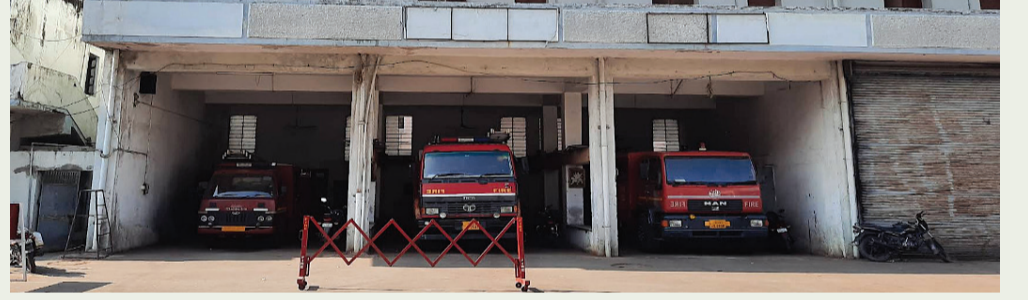
ગત મહિને થયેલ ત્રણ ફાયર સ્ટેશનોની વિગત મનપાના કનક રોડના ફાયર સ્ટેશનની દરખાસ્ત આજે પરત કરવામાં આવી હતી. જેમાં ઊંચાભાવથી ટેન્ડર ભર્યાનું ખુલવા પામ્યું છે. જેની સામે ગત માસે વોર્ડ નં. ૨, ૧૧ અને ૧૭માં નવા ફાયર સ્ટેશન બનાવવાની દરખાસ્ત મંજૂર થયેલ અને આ ત્રણેય દરખાસ્તમાં ૬.૭૦ ટકા તથા સાત ટકા અને ૩.૭૨ ટકા નીચા ભાવ આવેલા છે. એ જોતા આજની દરખાસ્તમાં

રાજકોટ, તા. ૧૫ રાજકોટ મહાનગરપાલિકા માં વિરોધનો વંદોળ કોઈ દિવસ શાંત પડ્યો નથી અને જાણે પડવા માંગતો ન હોય તેવું પણ જણાઈ રહ્યું છે કારણ કે તેવી એક વખત નહીં અનેક વખત સ્થિતિનું નિર્માણ થઈ રહ્યું છે. મહાનગરપાલિકામાં એક વિરોધ શાંત હજુ પડ્યો જ હોય ત્યાં બીજો વિરોધ શરૂ થઈ જાય છે ત્યારે કનક રોડ ફાયર સ્ટેશન કે જે સેન્ટ્રલ ઝોન કચેરીની બરોબર પાછળ આવેલું છે તે નાનું છે અને તેના નવીનીકરણ માટે ટેન્ડર પ્રસિદ્ધ કરવામાં આવ્યા હતા પરંતુ જે સ્થિતિનું નિર્માણ થયું ને જે ભાવ આવ્યો તે ચોકાવનારો હતો ૧૭% ઊંચા ભાવ સાથે ૧૨ કરોડનો ખર્ચનો એસ્ટીમેટ આવતા તે અંગેની દરખાસ્ત ગઈકાલની સ્ટેન્ડિંગમાં કરવામાં આવી હતી પરંતુ વિરોધ ન થાય તે માટે આ દરખાસ્તને પેન્ડિંગ રાખવામાં આવી છે. મળતી માહિતી મુજબ હાલ જ મહાનગરપાલિકા દ્વારા જે બે ફાયર સ્ટેશન બનાવવામાં આવ્યા તેનો ભાવ પણ નીચો હતો તો તેની સરખામણીમાં કનક રોડ ફાયર સ્ટેશન તો ખૂબ નાનું છે છતાં પણ કેમ ૧૨ કરોડ જેટલી માતબર રકમનો ખર્ચ કરવાનું નક્કી કરવામાં આવ્યું તે પ્રશ્ન હજી ઉકેલ આવ્યો નથી અને ભ્રષ્ટાચારમાં આવનાર હોય તેવું પણ લોકમુખે ચર્ચાઈ રહ્યું છે. મહાનગરપાલિકાના સ્ટેન્ડિંગ ચેરમેન દ્વારા શાણપણ થી આ દરખાસ્તને પેન્ડિંગ રાખી રિટેન્ડર કરવાનો આદેશ પ્રસિદ્ધ કર્યો છે ત્યારે ગઈકાલે ૩૩ જેટલી દરખાસ્ત પૈકી સેન્ટ્રલ ઝોન કચેરી પાછળના ફાયર સ્ટેશન ના સ્થાને નવું ફાયર સ્ટેશન ઊભું