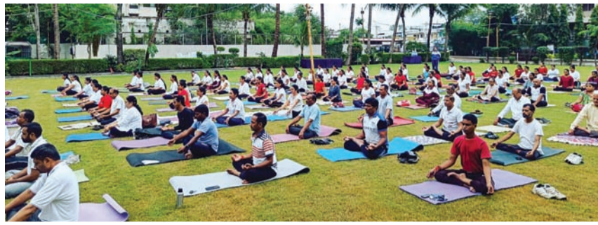
બોર્ડ અને આરોગ્ય વિભાગની મેડીકલ ટીમ પરિણામલક્ષી કાર્યક્રમો યોજીને નાગરિકોનો બ્લડ પ્રેસર, બોડી માસ ઇન્ડેક્સ તૈયાર કરીને સ્થળ પર જ ડાયટેશન આપશે.

વધુમાં તેમણે ઉમેર્યું હતું કે, ગુજરાત રાજ્ય યોગ બોર્ડના યોગના એક્સપર્ટ કોચ દ્વારા યોગના માધ્યમથી એક વ્યક્તિનો ૧૦ કિ.લો વજન ઓછું કરીને રાજ્યના ૧૦ લાખ નાગરિકોનો સંયુક્ત રીતે કુલ ૧ કરોડ કિ.લો જેટલો વજન ઘટાડીને ગુજરાતના નાગરિકોને મેડસ્વિતાથી મુક્તિ આપવાની દિશામાં યોગ બોર્ડ દ્વારા પ્રયત્નો કરવામાં આવશે. યોગ આપણી સંસ્કૃતિ છે. યોગના માધ્યમથી સ્વાસ્થ્ય વર્ધનની સાથે-સાથ વજન પણ ઓછું થાય છે. ‘મેડસ્વિતા મુક્તિ અભિયાન’ અંતર્ગત યોગશાસ્ત્ર અને આહારશાસ્ત્ર પર અમે વિશેષ ધ્યાન કેન્દ્રિત કરીશું. આ અભિયાન અંતર્ગત રાજ્યમાં ૭૫ સ્થળોએ યોગ