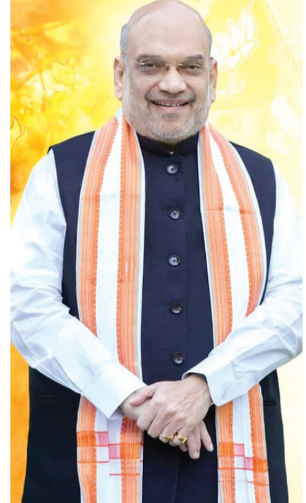
રાજકોટ, તા. ૧૫

રાજકોટ ડિસ્ટ્રીક્ટ બેંકની સામાન્ય સભા તથા વિવિધ સહકારી સંસ્થાઓ દ્વારા વિશાળ ખેડૂત સંમેલનનું આયોજન