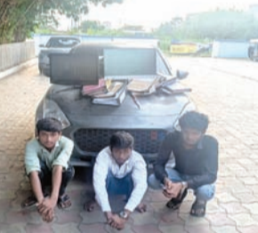
વકીલની ઓફિસમાં ઘુસી છરીની અણીએ લૂંટ કરી જનારા વકીલના સગા ભત્રીજા સહિત ત્રણને પોલીસે દબોચી લઈ મુદ્દામાલ અને કાર કબ્જે કર્યા હતાં.

રાજકોટ, તા. ૧૮ વકીલની ઓફિસમાં ઘુસી છરીની અણીએ લૂંટ કરી જનારા વકીલના સગા ભત્રીજા સહિત ત્રણને પોલીસે દબોચી લઈ મુદ્દામાલ અને કાર કબ્જે કર્યા હતાં.