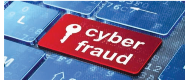
આગળ સાહેબ છે, આ રીતે તમે ટાગીના પહેરીને ન નીકળી શકો કહી રૂમાલમાં વીટી પાછા આપ્યા: ઘરે જઈ જોયું તો તેમાંથી માત્ર ડોન નીકળ્યો!

રાજકોટ, તા. ૧૮ સાયબર ગઠીયાઓ એક પણ દિવસ લગભગ ખાલ જવા દેતાં નથી. ગમે તેમ કરીને ગમે તેને આવા ગઠીયાઓ પોતાની જાળમાં ફસાવી લઈ ગજવા ભરી લેવામાં સફળ થઈ જાય છે. નજર હટી દુર્ઘટના ઘટીની જેમ જ જો તમે સાવચેત નહિ રહો તો સાયબર ગઠીયાઓનો આગલો શિકાર તમે પણ હોઈ શકો છો. ટાસ્ક પુરા કરી કમાણી કરવાના નામે વધુ એક વૃદ્ધ મહિલા છેતરાઈ ગયા છે. ઘરે બેઠા કામ કરી બે પૈસા કમાઈ લેવાની આશાએ આ મહિલાએ ટાઈમ લિમિટમાં પેઈજ વાંચવાના ટાસ્કમાં ભાગ લીધો હતો અને એપ ડાઉનલોડ કરી હતી. જો કે તેને આ કામમાં નાણા મળવાને બદલે દસ લાખ ગુમાવવાની નોખત આવી ગઈ હતી. વિગતો પર નજર કરીએ તો વધતા સાયબર ક્રાઈમની વચ્ચે વધુ એક ઈસસો સામે આવ્યો છે જેમાં વૃદ્ધ મહિલાને ગઠિયાઓએ ટાઈમ કરીને તેમને એક એપ્લિકેશન ડાઉનલોડ કરાવી હતી. જેમાં અલગ અલગ ટાસ્ક