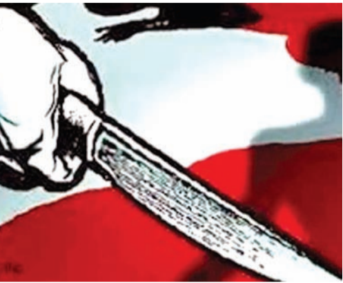
લઈને મારા તરફ આવતો હોઈ હું દવા છાંટવાનો પંપ મુકીને ભાગતાં બટુક દોડીને મારી પાસે આવી ગયો હતો અને તલવારના ધાકે કરતાં મને ડાખા પગમાં ધા લાગતાં પડી ગયો હતો. બીજો ધા માથામાં મારવા જતાં મેં જમણો હાથ આડો રાખતાં હાથમાં ઈજા થઈ હતી. આ પછી બટુકે મારા ગળા પર તલવાર મુકી દીધી હતી. ત્યાં મારા પિતાજી દોડી આવ્યા હતાં અને તેણે તલવાર તરફ લાકડીનો ધા કરતાં તલવાર બટુકના હાથમાંથી પડી ગઈ હતી. જેથી હું બચી ગયો હતો. આ મારામારીમાં બટુકને પણ ઈજા થઈ હતી. મને ડાખા પગ, જમણા હાથમાં તલવારના ધાથી કાપા પડી જતાં લોહી નીકળ્યા હતાં. બનાવને પગલે માણસો ભેગા થઈ જતાં અને કોઈએ અમારા શેકને જાણ કરતાં તે આવ્યા હતાં અને ઈકો કારમાં મને ગોંડલ હોસ્પિટલમાં લઈ ગયા હતાં. આ હુમલાનું કારણ એ છે કે ૨૫/૫/૨૦૨૩ના રોજ બટુક સાંખટ જે નીચા કોટડા ગામે અમારા ઉંચા કોટડા ગામની નજીકમાં જ આવેલું છે ત્યાં રહેતો હોઈ મારી બહેનને તે અપહરણ કરી ભગાડી ગયો હતો.

અમે જે તે વખતે આ મામલે ગોંડલ તાલુકા પોલીસમાં ફરિયાદ કરી હતી. જે તે વખતે પોલીસે અપહરણનો ગુનો નોંધતા બટુક જેલમાં ગયો હતો. તેની સામે કેસ ચાલી જતાં બટુકને વીસ વર્ષની સજા પડી હોઈ તેનો ખાર રાખી હાલ પેરોલ રજા પર છુટીને તેણે અમે જે વાડી વાવવા તેની ધરપકડ કરી તે દેશી પિસ્તોલ ક્યાંથી લાવ્યો? તેની પણ તપાસ કરવામાં આવશે. ગોંડલ પંથકમાં આ બનાવે ચક્રવર્તી જગાવી દીધી છે.