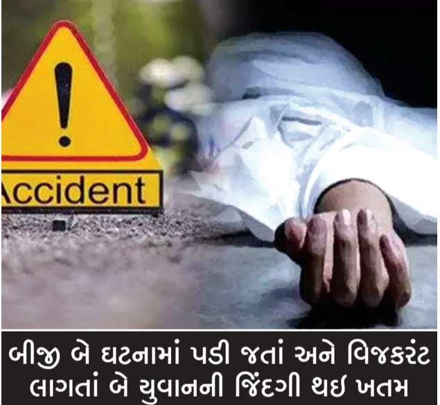
બીજી બે ઘટનામાં પડી જતાં અને વિજકરંટ લાગતાં બે યુવાનની જિંદગી થઈ ખતમ

રાજકોટ, તા. ૨૦ શહેરમાં વાહન અકસ્માતની ઘટનાઓ રોજબરોજ બનતી રહે છે. જેમાં અમુક બનાવમાં જે તે વાહનચાલકને કે પછી રાહદારીને સામાન્યથી માંડી ગંભીર પ્રકારની ઈજાઓ થતી હોય છે. તો ઘણીવાર મૃત્યુ પણ થતાં હોય છે. અકસ્માત સર્જી વાહનચાલકો ભાગી જતાં હતાં ત્યારે ગવરીદળ પાસે અનેક વખત બને છે. હિટ એન્ડ રનના આવા બે બનાવમાં બે વૃદ્ધના મૃત્યુ થયા છે. એક વૃદ્ધ મિસ્ત્રી કામ કરવા જતાં હતાં ત્યારે ગવરીદળ પાસે તેના વાહનને અજાણ્યો કારચાલક ઠોકર મારી ભાગી ગયો હતો. બીજા વૃદ્ધ હનુમાનજી મંદિરે દર્શને જતા હતાં ત્યારે મવડીમાં કોઈ વાહનચાળી ઠોકરે લઈ ભાગી જતાં તેમનું મૃત્યુ થયું હતું. અપમૃત્યુની અન્ય બે ઘટનામાં એક યુવાનનું સીડી પરથી પટકાતાં અને બીજાનું વિજકરંટ લાગવાથી મૃત્યુ થયું હતું.