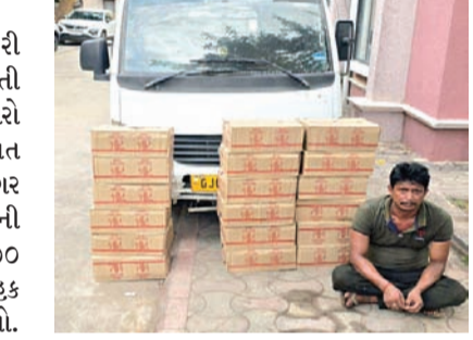
આ શખ્સ છક ગોવાથી આ દાડૂનો જથ્થો ભરી લાવ્યો હતો. પરંતુ આ જથ્થો વેચવા તે પ્યાસીઓ, ધંધાધીંઓને શોધે એ પહેલા પોલીસ ભેટી ગઈ હતી.