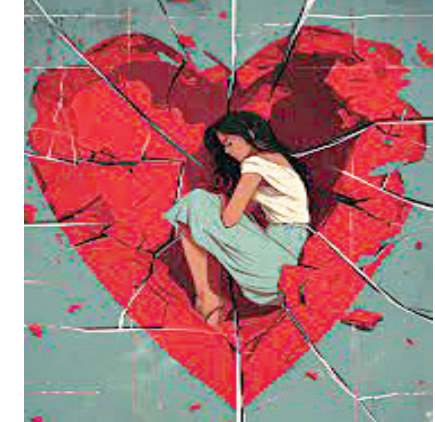
સાથે લગ્ન કરવાનો નથી. હું તને પ્રેમ કરતો નથી. આ વાત કોઈને કહીશ તો તારા વીડીયો અને