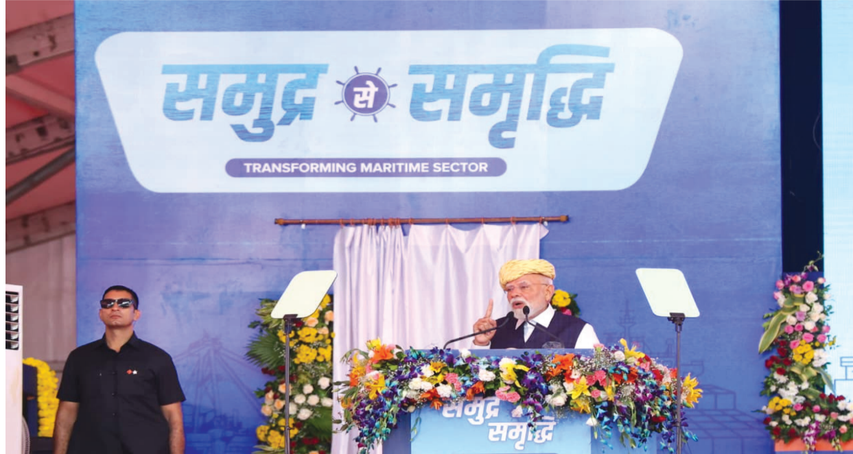
શિપબિલ્ડિંગ ક્રેડિટ નોટનો સમાવેશ થાય છે. રાષ્ટ્રીય શિપબિલ્ડિંગ મિશનની પણ સ્થાપના કરવામાં આવશે. આ ઉપરાંત, આ ક્ષેત્ર માટે લાંબા ગાળાના ધિરાણ પૂરા પાડવા માટે રૂ. ૨૫,૦૦૦

રાજકોટ, તા. ૨૪ પ્રધાનમંત્રી નરેન્દ્ર મોદીની અધ્યક્ષતામાં કેન્દ્રીય મંત્રીમંડળે ગઈકાલે દરિયાઈ ક્ષેત્રના વ્યૂહાત્મક અને આર્થિક મહત્વને ઓળખીને ભારતના જહાજ નિર્માણ અને દરિયાઈ ઇંકોસિસ્ટમને પુનઃજીવિત કરવા માટે રૂ. ૬૯,૭૨૫ કરોડના વ્યાપક પેકેજને મંજૂરી આપી છે. આ પેકેજ સ્થાનિક ક્ષમતાને મજબૂત બનાવવા, લાંબા ગાળાના ધિરાણમાં સુધારો કરવા, ગ્રીનફિલ્ડ અને બ્રાઉનફિલ્ડ શિપયાર્ડ વિકાસને પ્રોત્સાહન આપવા, તકનીકી ક્ષમતાઓ અને કૌશલ્ય વધારવા અને મજબૂત દરિયાઈ માળખાગત સુવિધા બનાવવા માટે કાનૂની, કરવેરા અને નીતિગત સુધારાઓ અમલમાં મૂકવા માટે રચાયેલ ચાર-સ્તંભ અભિગમ રજૂ કરે છે. આ પેકેજ હેઠળ, શિપબિલ્ડિંગ નાણાકીય સહાય યોજના (SBFAS) ૩૧ માર્ચ ૨૦૩૬ સુધી લંબાવવામાં આવશે જેનો કુલ ભંડોળ રૂ. ૨૪,૭૩૬ કરોડ છે. આ યોજનાનો ઉદ્દેશ ભારતમાં જહાજ નિર્માણને પ્રોત્સાહન આપવાનો છે અને તેમાં રૂ. ૪,૦૦૧ કરોડની ફાળવણી સાથે