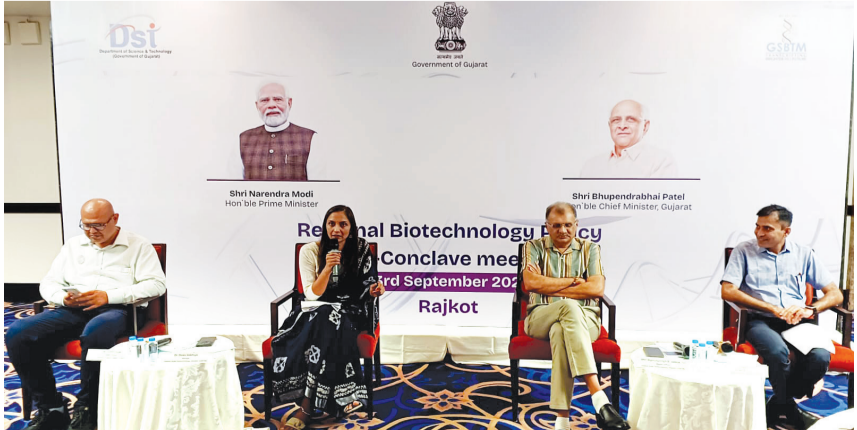
સંસ્થાઓ અને શૈક્ષણિક સંસ્થાઓ દ્વારા રાજ્ય તેમજ દેશના વિકાસમાં પોતાની ભૂમિકા ભજવી શકે તે માટે આ કોન્કલેવ યોજાશે. આ ઉપરાંત તેમણે બાયોટેકનોલોજી અંતર્ગત