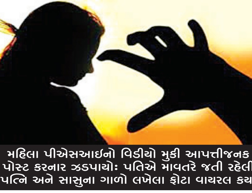
મહિલા પીએસઆઈનો વિડીયો મુકી આપતીજનક પોસ્ટ કરનાર ઝડપાયો: પતિએ માવતરે જતી રહેલી પતિ અને સાસુના ગાળો લખેલા ફોટા વાયરલ કર્યા