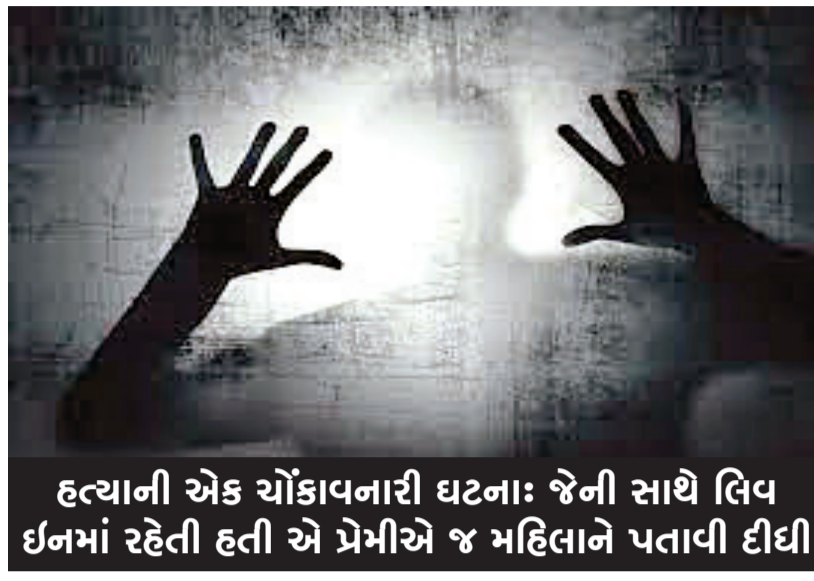
હત્યાની એક ચોંકાવનારી ઘટના: જેની સાથે લિવ ઈનમાં રહેતી હતી એ પ્રેમીએ જ મહિલાને પતાવી દીધી