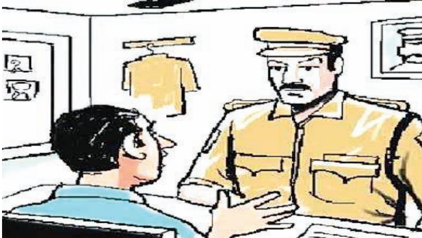
બોલો લ્યો શાળાના આચાર્ય અને ક્લાઈ શિક્ષિકા પાસે લાંચ માંગી: એસીબીએ બંનેને રંગેહાથ દબોચ્યા