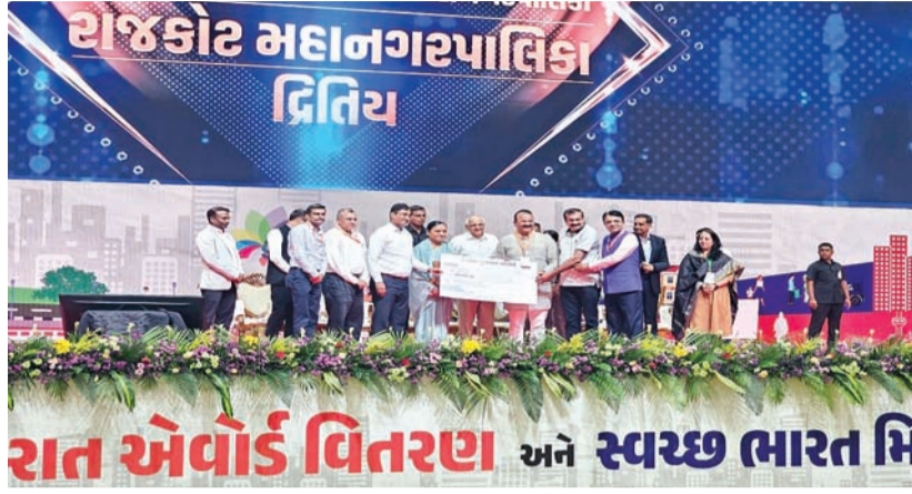
રાત એવોર્ડ વિતરણ અને સ્વચ્છ ભારત મિશન

રાજકોટ, તા. ૨૭ હાલ કેન્દ્ર સરકાર અને રાજ્ય સરકારનો એકમાત્ર લક્ષ્ય જો કોઈ હોય તો તે એ છે કે ગુજરાત સ્વચ્છ રાજ્ય તરીકે આગળ આવે અને તેના માટે જે પણ કાર્યો કરવાના હોય તે હાથ ધરાવે આ અંગે રાજ્ય સરકારે કેન્દ્ર સરકાર દ્વારા ખાસ સ્થાનિક પ્રશાસનને તાકીદ કરી સૂચિત કરવામાં આવ્યા છે કે સ્વચ્છતા અંગે દરેક જરૂરી કાર્ય હાથ ધરાવે જોઈએ. જ્યાં સુધી જાગૃતતા કેળવવામાં નહીં આવે ત્યાં સુધી આ સિદ્ધાંત અને જે લક્ષ્ય રાજ્ય સરકાર દ્વારા નક્કી કરવામાં આવ્યો છે તેને પરિપૂર્ણ નહીં કરી શકાય. હાલ આ અંગે તમામ આ મહાનગરપાલિકાઓને સૂચિત કરવામાં આવી છે અને જણાવ્યું છે કે સ્વચ્છતા માટે સ્થાનિક પ્રશાસન જરૂરી પગલા લેવું.