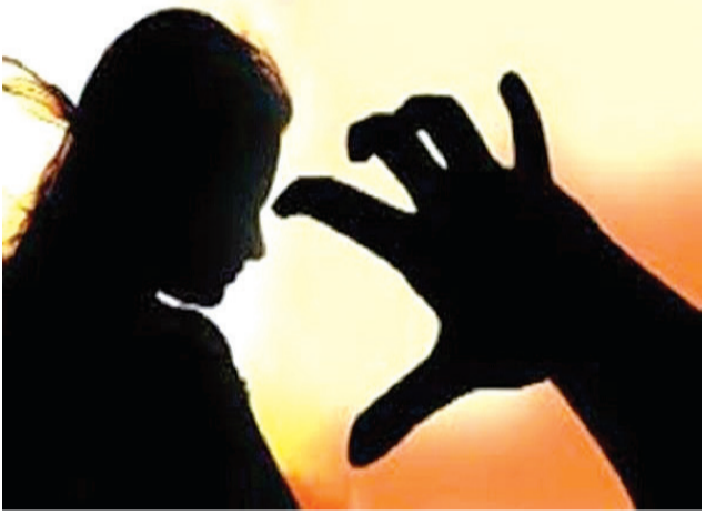
ફોટા પાડી લેતાં હોઈ અને એક છોકરો ચાકુ બતાવતો હોઈ આ બંને રહેનપણી ગભરાઈ ગઈ હતી. દિકરી ગુમસુમ રહેતી હોઈ પિતાએ પૂછા કરતાં તેણે હકિકત જણાવતા બંને દિકરીઓના પિતા, સોસાયટીના રહેવાસીઓએ ગત રાતે આ બંને ગરબી જોવા નીકળી ત્યારે પાછળ પાછળ જઈ બે છોકરાને પકડી લીધા હતાં. આ ઘટનામાં બી-ડિવીઝન પોલીસે એક બાળાની ફરિયાદ પરથી સોળ-સોળ વર્ષના બે સગીર વિરુદ્ધ બીએનએસની કલમ ૭૮ (૨), ૫૪ અને જીપીએસની કલમ ૧૩૫ મુજબ ગુનો નોંધી કાયદેસરની કાર્યવાહી કરી કાયદાનું ભાન બંનેને કરાવ્યું હતું. બાળાના પિતાએ ફરિયાદમાં જણાવ્યું છે કે હું સામા કાઠે રહું છું અને માર્કેટિંગનું કામ કરી ગુજરાન ચલાવું છું. મારે સંતાનમાં એક દિકરી અને એક દિકરો છે. જેમાં દિકરી ૧૪ વર્ષની છે અને ધોરણ-૯માં અભ્યાસ કરે છે. બાલીસમીએ રાતે નવેક વાગ્યે મારી દિકરી અમારી સોસાયટી પાછળના ભાગે પ્રાચીન ગરબી યોજાય છે ત્યાં ગરબી જોવા ગઈ હતી. રાતે સાડા દસેક વાગ્યે તે પરત ઘરે આવી ત્યારે ગભરાયેલી હાલતમાં હોઈ મેં તેણીને પુછ્યું હતું કે શું થયું છે? આથી તેણે કંઈ જવાબ આપ્યો નહોતો. પણ દિકરી

રાજકોટ, તા. ૨૭ શહેરમાં ઢેકઢેકાણે માતા શક્તિની ભક્તિના પર્વની ઉજવણી થઈ રહી છે અને પ્રાચીન-અર્વાચીન રાસોત્સવ ખાતે પોલીસ બંદોબસ્ત જાળવી રહી છે. મહિલા પોલીસની શી ટીમો પણ મોડી રાત સુધી પેટ્રોલિંગ કરે છે. આ વચ્ચે એક યોકાનવારો બનાવ સામે આવ્યો છે. જેમાં સામા કાઠે રહેતી તેર અને ચૌદ વર્ષની બે સખી શાળાએ જાય કે રાતે ગરબી જોવા જાય ત્યારે ત્રણ છોકરા સતત તેની પાછળ પાછળ જઈ તેણીના ફોટા પાડી ચાકુ બતાવી હેરાન પરેશાન કરતાં હોઈ આ બાળાઓ ફફડી ગઈ હતી. ઘરે વાલીઓને જાણ કરતાં સોસાયટીના રહેવાસીઓએ છટકુ ગોઠવી બે છોકરાને રંગેહાથ પકડી લઈ પોલીસને સોંપતા પોલીસે બંને સામે એકઠાઈઆર દાખલ કરી કાયદેસરની કાર્યવાહી કરી હતી. પોલીસની દાખલાદુપ કામગીરીથી આ બંને સગીરોએ માફી માંગી હવે પછી આવું નહિ કરીએ તેવી ખાત્રી આપી હતી. વિગતો પર નજર કરીએ તો સામા કાઠે રહેતી તેર અને ચૌદ વર્ષની બે રહેનપણી સ્કૂલે જાય-આવે, રાતે વિસ્તારમાં ગરબી જોવા માટે જાય-આવે ત્યારે ત્રણ છોકરા સતત પીછો કરી તેણીના મોબાઈલથી