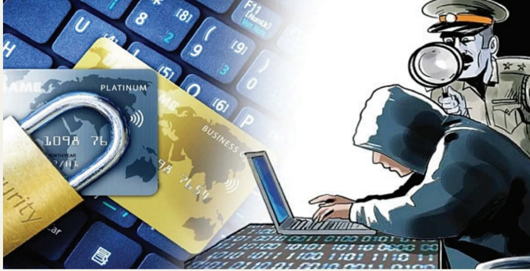
કરી પરત કર્યા છે. આંતરરાષ્ટ્રીય નેટવર્ક પરની કાર્યવાહી અંગે શ્રી સંઘવીએ માહિતી આપી કે ગુજરાત પોલીસે દુબઈ, વિયેતનામ અને કંબોડિયાથી ઓપરેટ થતા એક વિશાળ સિન્ડિકેટનો પદકાશ કર્યો છે. આ ગેંગ સામાન્ય નાગરિકોને દોઢ-બે ટકા કમિશનની લાલચ આપી તેમના બેંક ખાતા અને સિમકાર્ડ મેળવી, તેનો ઉપયોગ દેશભરમાં સાયબર ફોડ આચરવા માટે કરતી હતી. આ ગેંગ દ્વારા દેશભરમાં ૧૫૪૯ ગુના આચરી અંદાજે ૮૦૪

અર્પણ' કાર્યક્રમ હેઠળ ગાંધીનગર સ્થિત સાયબર સેન્ટર ઓફ એક્સીલન્સ દ્વારા નાગરિકોને તેમના ઐતિહાસિક રકમ પરત અપાવવામાં આવી છે. એક મોટા કિસ્સામાં, વડોદરાના એક સિનિયર સિટીઝનને પ્રતિષ્ઠિત ઇન્સ્યોરન્સ કંપનીઓના નામે જંગી નફાની લાલચ આપી છેતરવામાં આવ્યા હતા, જેમના ૪.૯૧ કરોડ પોલીસે સફળતાપૂર્વક ફિઝ કરાવી પરત અપાવ્યા. અન્ય એક ભયાનક કિસ્સામાં, અમદાવાદની એક સિનિયર સિટીઝન મહિલાને નકલી પોલીસ અધિકારી બની 'ડિજિટલ અરેસ્ટ' કરી, ડ્રગ્સ કેસમાં ફસાવવાની ધમકી આપી ૧૨ દિવસ સુધી SKYPE પર નજરકેદ રાખી જેટ લાખ પડાવી લેવાયા હતા, તે રકમ પણ પોલીસે પરત અપાવી છે. આ ઉપરાંત, ROCKCREAK નામની નકલી ટ્રેડિંગ એપ દ્વારા એક પરિવાર સાથે થયેલી ₹૧૨.૭૦ લાખની છેતરપિંડીના નાણાં પણ પોલીસે રિકવર