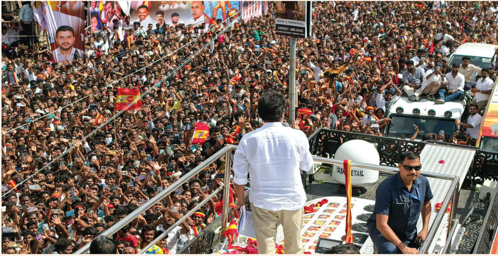
ગતિશીલતા બદલાવાની તૈયારીમાં છે. તમિલનાડુના મુખ્યમંત્રી એમ.કે. સ્ટાલિને કચ્છ ઘટના પર ચિંતા વ્યક્ત કરી હતી. તેમણે ટૂંટ કર્યું હતું કે તેમણે ભૂતપૂર્વ મંત્રી વી. સેન્થિલબાલાજી, આરોગ્ય મંત્રી મા. સુબ્રમણ્યમ અને જિલ્લા કલેક્ટરને બેભાન અને હોસ્પિટલમાં દાખલ થયેલા લોકોને તાત્કાલિક તબીબી સહાય પૂરી પાડવા નિર્દેશ આપ્યો છે. તેમણે તિરુચિરાપલ્લીના મંત્રી અનાબિલ મહેશને રાહત કામગીરીમાં શક્ય તમામ સહાય પૂરી પાડવાનો પણ આદેશ આપ્યો હતો. મુખ્યમંત્રીએ એડીજીપીને પરિસ્થિતિને નિયંત્રિત કરવા માટે ઝડપી પગલાં લેવા પણ કહ્યું હતું.

નવીદિલ્હી, તા. ૨૭ શનિવારે તમિલનાડુના મુખ્યમંત્રી અને અભિનેતા-રાજકારણી વિજય વિજયની કચ્છમાં ચૂંટણી રેલીમાં ભાગદોડ જેવી સ્થિતિ સર્જાઈ હતી. ભીડને કારણે ઘણા લોકો બેભાન થઈ ગયા હતા, અને ત્રણ બાળકો સહિત ૧૦ લોકોના મોત થયા હોવાની આશંકા છે. વિજયને પોતાનું ભાષણ અટકાવવાની ફરજ પડી હતી અને જતાંને શાંતિ જાળવવા અને કટોકટી સેવાઓને માર્ગ આપવા અપીલ કરી હતી. આ ઘટના બાદ, ડીએમકે મંત્રી સેન્થિલ બાલાજી અને જિલ્લા કલેક્ટરે પરિસ્થિતિનું મૂલ્યાંકન કરવા માટે હોસ્પિટલની મુલાકાત લીધી હતી. ભારે ભીડ અને દબાણને કારણે, પાર્ટી કાર્યકરો અને બાળકો પણ બીમાર પડ્યા હતા અને તેમને તાત્કાલિક નજીકની હોસ્પિટલોમાં દાખલ કરવામાં આવ્યા હતા. રેલી દરમિયાન, વિજયે બીમાર પડેલા લોકોને પાણીની બોટલો વહેંચી હતી અને તબીબી ટીમો તેનાત કરી હતી. ભીડમાં ફસાયેલા લોકોને ઝડપથી બહાર કાઢવામાં આવ્યા હતા અને એમ્બ્યુલન્સમાં લઈ જવામાં આવ્યા હતા. દરમિયાન, એક ૯ વર્ષની બાળકી ગુમ થઈ ગઈ હોવાનું નોંધાયું હતું, જેના માટે વિજયે પોલીસ અને તેમના પક્ષના કાર્યકરોને મદદ માટે અપીલ કરી હતી. તેમના ભાષણ દરમિયાન, વિજયે ભૂતપૂર્વ ડીએમકે મંત્રી સેન્થિલ બાલાજી પર પ્રહાર કર્યા હતા. તેમણે કચ્છમાં એરપોર્ટ બનાવવાના વચનને યાદ કર્યું હતું, જે ડીએમકેએ પછીથી કેન્દ્ર સરકારને સોંપવાનું વચન આપ્યું હતું. વિજયે વધુમાં જણાવ્યું હતું કે આગામી છ મહિનામાં તમિલનાડુમાં સત્તાની