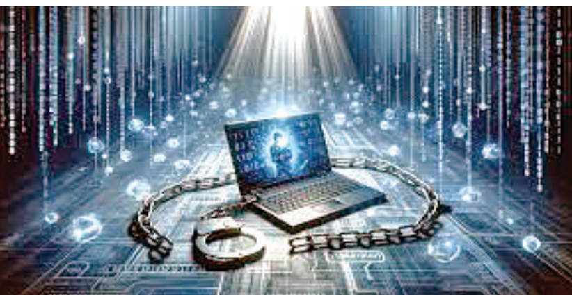
બીજી ઘટનામાં કંપની સાથે પુર્વ સીઈઓએ આચર્યું અદ્દી કરોડનું ફોડ: ફ્લાઈટ પકડી વિદેશ ભાગે એ પહેલા પોલીસે પકડી લીધો