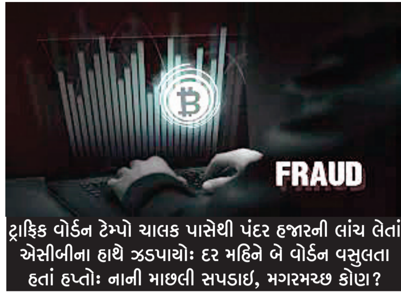
ટ્રાફિક વોર્ડન ટેમ્પો ચાલક પાસેથી પંદર હજારની લાંચ લેતાં એસીબીના હાથે ઝડપાયો: દર મહિને બે વોર્ડન વસુલતા હતાં હપ્તો: નાની માછલી સપડાઈ, મગરમચ્છ કોણ?