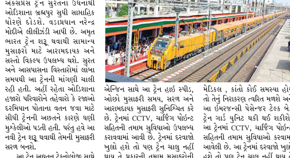
રાજકોટ તા. ૨૭ ગુજરાતની પ્રથમ અમૃત ભારત એક્સપ્રેસ ટ્રેન સુરતના ઉદનાથી ઓરિસ્સાના બ્રહ્મપુર સુધી સાપ્તાહિક ધોરણે દોડશે.

રાજકોટ તા. ૨૭ ગુજરાતની પ્રથમ અમૃત ભારત એક્સપ્રેસ ટ્રેન સુરતના ઉદનાથી ઓરિસ્સાના બ્રહ્મપુર સુધી સાપ્તાહિક ધોરણે દોડશે. વડાપ્રધાન નરેન્દ્ર મોદીએ લીલીઝંડી આપી છે. અમૃત ભારત ટ્રેન શરૂ થવાથી સામાન્ય મુસાફરો માટે આરામદાયક અને સસ્તો વિકલ્પ ઉપલબ્ધ થશે. સુરત અને આસપાસના વિસ્તારોમાં લાંબા સમયથી આ ટ્રેનની માંગણી ચાલી રહી હતી. અહીં રહેતા ઓરિસ્સાના હજારો પરિવારોને તહેવારો કે રજાઓ દરમિયાન પોતાના વતન જવા માટે સીધી ટ્રેનની અછતને કારણે ઘણી મુશ્કેલીઓ પડતી હતી. પરંતુ હવે આ નવી ટ્રેન શરૂ થવાથી તેમની મુસાફરી સરળ બનશે. આ ટ્રેન અદ્યતન ટેકનોલોજી સાથે ડિઝાઇન કરવામાં આવી છે. બંને છેડે પુરા-પુલ ગોઠવણીમાં માઉન્ટ થયેલ એન્જિન સાથે આ ટ્રેન હાઈ સ્પીડ, ઓછો મુસાફરી સમય, સરળ અને આરામદાયક મુસાફરી સુનિશ્ચિત કરે છે. ટ્રેનમાં CCTV, ચાર્જિંગ પોર્ટન્ટ સહિતની તમામ સુવિધાઓ ઉપલબ્ધ કરાવવામાં આવી છે. ટ્રેનમાં દરવાજો ખુલ્લો હશે તો પણ ટ્રેન ચાલુ નહીં થાય તે પ્રકારની તમામ મુસાફરોની સુરક્ષાનું ધ્યાન રાખવામાં આવ્યું છે. કોઈક વખત ટ્રેનમાં પાણી, એસી, મેડિકલ, કાંતો કોઈ સમસ્યા હોય તો તેનું નિરાકરણ ત્વરિત મળશે અને આ ઈમરજન્સી પેસેન્જર ટેલક બેક ટ્રેન ગાર્ડ યુનિટ થકી થઈ શકીશે, આ ટ્રેનમાં CCTV, ચાર્જિંગ પોર્ટન્ટ સહિતની તમામ સુવિધાઓ કરવામાં આવેલી છે. આ ટ્રેનમાં દરવાજો ખુલ્લો હશે તો પણ ટ્રેન ચાલુ નહીં થાય તે પ્રકારની તમામ મુસાફરોની સુરક્ષાનું ધ્યાન રાખવામાં આવ્યું છે.