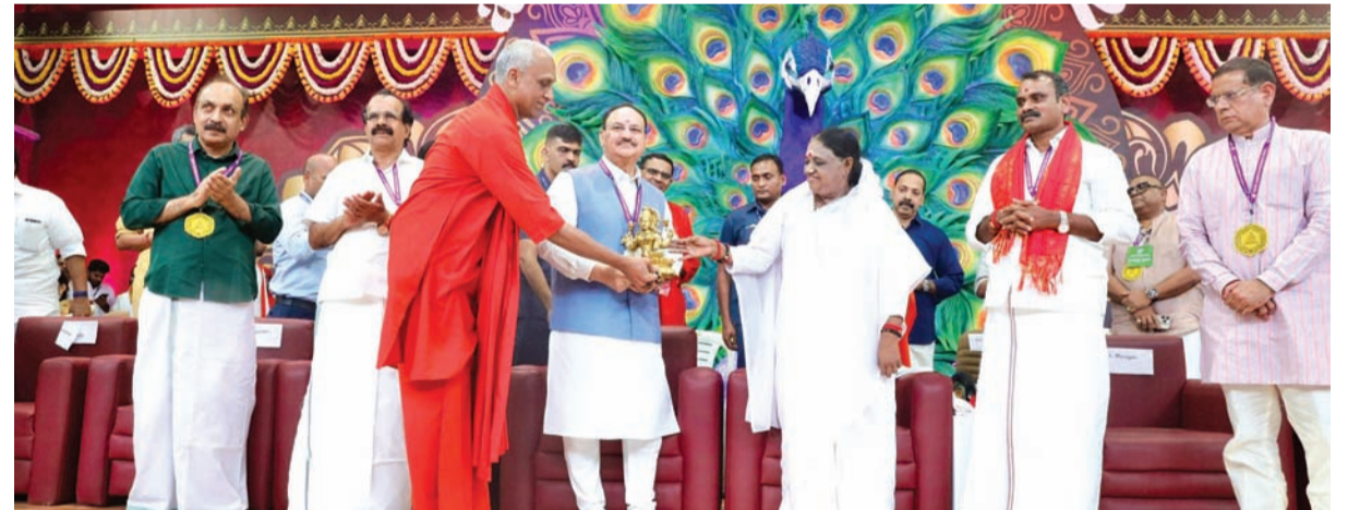
રાજકીય પક્ષો ભાજપ સાથે જોડાયા છે. કેટલાક ભાજપમાં ભળી ગયા છે, જ્યારે ઘણા પ્રાદેશિક પક્ષો પોતાને પારિવારિક પક્ષોમાં રૂપાંતરિત કરી ચૂક્યા છે. ભાજપ બધા પક્ષોને સાથે લઈ જઈ રહ્યું છે. વધુમાં, પ્રાદેશિક પક્ષોના સમર્થનથી, તે રાજ્ય અને દેશ બંનેનો વિકાસ કરવા માટે કામ કરી રહ્યું છે. ભાજપના રાષ્ટ્રીય અધ્યક્ષ જે પીએમ નરેન્દ્ર મોદીના કહ્યું કે ભાજપ એક વિચારધારા આધારિત અને કેડર આધારિત પાર્ટી છે. ભાજપનો વ્યાપક સમર્થન આધાર છે. પીએમ મોદીએ દેશની પ્રગતિ માટે ઘણા મોટા પગલાં લીધા છે, જેમાં તાજેતરના GST સુધારાનો સમાવેશ થાય છે. તેમણે કહ્યું કે તમને બધાને યાદ છે કે ૨૦૧૭ પહેલાં કર પ્રણાલી કેવી રીતે કામ કરતી હતી, જેમાં પ્રવેશ કર, વેચાણ કર, આબકારી કર અને અન્ય ઘણા બધાનો સમાવેશ થતો હતો. આ આજે પણ કેરળમાં ચાલુ છે. તેથી, આગામી

નવીદિલ્હી, તા. ૨૭ ભારતીય જનતા પાર્ટીના રાષ્ટ્રીય અધ્યક્ષ અને કેન્દ્રીય મંત્રી જગત પ્રકાશ નહુા શનિવારે કેરળના કોલ્લમ પહોંચ્યા. તેમણે માતા અમૃતાનંદમયી દેવીને તેમના ૭૨મા જન્મદિવસ પર હાર્દિક શુભેચ્છાઓ અને અભિનંદન પાઠવ્યા. કોલ્લમમાં એક જાહેર સભાને સંબોધતા તેમણે કહ્યું કે તેઓ માત્ર કેરળમાં જ નહીં પરંતુ સમગ્ર દેશમાં ભાજપનું પ્રતિનિધિત્વ કરે છે. આઝાદી પછી કેરળનો વિકાસ અટકી ગયો છે. તેમણે કહ્યું કે કેરળમાં શાસક પક્ષો ફક્ત વિભાજનકારી રાજકારણમાં માને છે, પરંતુ સમય બદલાઈ ગયો છે. ૨૦૧૪ માં જ્યારે નરેન્દ્ર મોદીએ કેન્દ્રમાં ભાજપ સરકાર સત્તામાં આવી ત્યારે એક નવી શિસ્ત અને સંસ્કૃતિનો પ્રારંભ થયો. ત્યારથી, દેશના દરેક રાજ્યમાં ઝડપી વિકાસ થઈ રહ્યો છે. તેમણે “વિકસિત કેરળ” બનાવવા માટે કામ કરવા બદલ કેરળ ભાજપનો આભાર વ્યક્ત કર્યો. કેન્દ્રીય મંત્રી જગત પ્રકાશ નહુાએ કહ્યું કે ભાજપ “સબકા સાથ, સબકા વિકાસ, સબકા વિશ્વાસ અને સબકા પ્રયાસ” ની ભાવનાથી કામ કરી રહી છે. આ સિદ્ધાંતને અનુસરીને, ભાજપે પીએમ નરેન્દ્ર મોદીના નેતૃત્વમાં કામ કરવાનું શરૂ કર્યું. આજે, મોટાભાગના