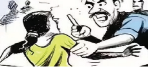
પરિણીતા ટિકરીઓના વાળ કપાવવા શાપરથી રાજકોટ આવતાં જુના મિત્રએ 'તને સલુનવાળા વાળ કાપતી વખતે અડે એ મને ગમતું નથી' કહી લાડા મારી ગાળો ભાંડી!

રાજકોટ, તા. ૨૭ મિત્રતાના નામે અનેક પરિણીતાઓ, યુવતિઓ અવાર-નવાર લેભાગુઓની જાળમાં ફસાઈ ગયાના કિસ્સા મોજુદ છે. રાજકોટ શહેરમાં જ આ પ્રકારની ઘણી ઘટનાઓમાં પોલીસ કાર્યવાહી કરી ચુકી છે. દરમિયાન વધુ એક ચોંકાવનારો બનાવ સામે આવ્યો છે જેમાં બે ટિકરીની માતા એવી શાપર પંથકની મહિલા રાજકોટના એક શખ્સ સાથે ત્રણ મહિના પહેલા શખ્સે જોડાઈ ગયો હતો. પરિણીતા દેહસંબંધ પણ બાંધ્યા હતાં. જો કે પછી પરિણીતાએ સંબંધ પુરા કરતાં આ શખ્સે જોડાઈ ગયો હતો. પરિણીતા ટિકરીઓના વાળ કપાવવા રાજકોટ આવી ત્યારે આ શખ્સે ત્યાં જઈ તેને સલુનવાળા વાળ કાપતી વખતે એ