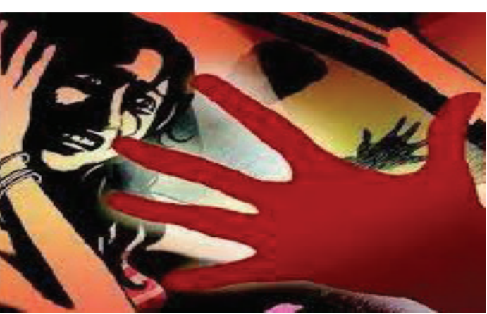
છૂટી કરી દીધી હતી બે મહિલા સુધી આ મહિલાનું કોઈ નથી કહીને ઘરે રાખી હતી જો કે પ્રેમ સંબંધની પત્નીને ખબર પડતાં પતિ અને પત્નિએ તકરાર કરી હતી બાદમાં સ્વામી રાખી હતી ત્યારબાદ લગ્ન કરવાનો ઈન્કાર કર્યો હતો. એટલું જ નહી

પર દુખાવો થતાં સયાજી હોસ્પિટલમાં સારવાર અર્થે પરણીતા દાખલ થઈ હતી. પતિ ચીડીયા સ્વભાવનો હોવાથી વારે ઘડીએ વાત વાતમાં ગુસ્સો કરી ઘરમાં કંકાસ કરી ખરાબ વર્તન કરે છે. આ ઉપરાંત મારી સાથે જબરજસ્તી શારીરિક સંબંધ પણ બાંધે છે. બાળકને પણ મારતો હોવાથી છેલ્લા છ મહિનાથી પરણીતા પોતાના પિયરમાં અમદાવાદ ખાતે રહે છે. તે અમદાવાદ જતી રહ્યા બાદ પતિ છોકરાને મારી નાખવાની ધમકી આપતો હોય સમગ્ર બનાવ મામલે પરણીતાએ ગોત્રી પોલીસ મથકે શારીરિક અને માનસિક ત્રાસ મામલે પતિ વિરુદ્ધ ગુનો દાખલ કરાવ્યો છે. બીજી એક ઘટના જોઈએ અમદાવાદ વટવામાં રહેતા યુવકને મહિલાને સ્વામી હિસાબ રાખવાનું કહી નોકરી રાખીને લગ્નની લાલચ આપી હતી અને મહિલા કરવાનો ઈન્કાર કર્યો હતો. એટલું જ નહી