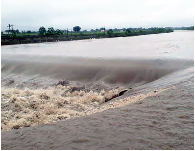
સલામત સ્થળે ખસી જવા સૂચના અપવામાં આવી છે. જળાશયના પાણીનું હાલનું લેવલ ૭૨.૫ મીટર છે. ગોંડલ તાલુકામાં આવેલુ વેરી જળાશયના પાણીનું હાલનું લેવલ ૧૪૨.૦૪ મીટર છે.

રાજકોટ તા. ૨૯ ભારે વરસાદના કારણે રાજકોટ જિલ્લાના આજી-૧, ફાડદંગ બેટી, આજી-૨, વેરી, સુરવો, છાપરવાડી-૨ અને ભાદર-૨ ડેમો ઓવરફ્લો થયા છે, આથી આ તમામ ડેમોના હેઠવાસમાં આવેલા ગામોના નાગરિકોને સલામત સ્થળે ખસી જવા અને નદીના પટમાં અવરજવર ન કરવા રાજકોટ ફ્લડ કંટ્રોલ સેલ દ્વારા આદેશ કરવામાં આવ્યો છે. આજી-૧ ડેમ ઓવર ફ્લો થવાથી ડેમના નીચાણ વિસ્તારમાં આવેલા બેડી, મનહરપુર, રોજકી, ધોરાળા ગામોના લોકોને સાવચેત રહેવા સૂચના અપાઈ છે. જળાશયના પાણીનું હાલનું લેવલ ૧૪૭.૫૨ મીટર છે. રાજકોટ તાલુકાનો ફાડદંગ બેટી જળાશય ઓવરફ્લો થવાથી રાજકોટ, બેડલા, જામગઢ લાંબા-કોટડા, ફાડદંગ, રફાળા, રામપરા, મધવવાડા, પારેવાળા ગામોના લોકોને સલામત સ્થળે ખસી જવા અને નદીના પટમાં અવરજવર ન કરવા જણાવાયું છે. જળાશયના પાણીનું હાલનું લેવલ ૧૮૯.૨૭ મીટર છે. પડધરી તાલુકામાં આવેલો આજી-૨ ડેમ ઓવર ફ્લો થતાં પડધરી, અડબાલકા, બાગી, દહીસરડા, ડુંગરકા, ગઢડા, હરીપર, ખંદેરી, નારણકા, સખપર, ઉકરડા ગામોના લોકોને