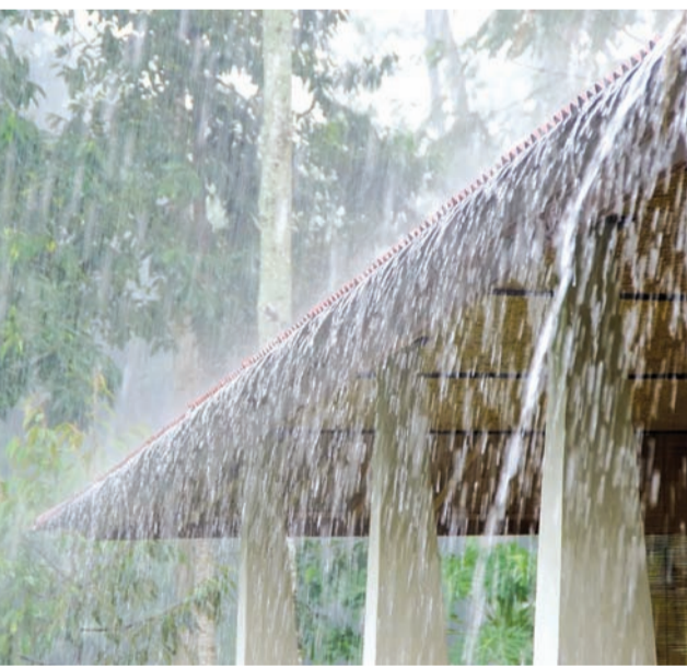
ગુજરાતમાં ૧૨૧.૭૨ ટકા અને સૌથી વધુ વરસાદ ૧૦૧.૯૬ ટકા સરેરાશ વરસાદ વરસ્યો છે. સેઓના અહેવાલ મુજબ

રાજકોટ, તા. ૨૯ સ્ટેટ ઈમરજન્સી ઓપરેશન સેન્ટર-જીબીઈ, ગાંધીનગરના અહેવાલ મુજબ સમગ્ર રાજ્યમાં ૩૩ જિલ્લાના ૨૩૨ તાલુકાઓમાં હળવાથી ભારે વરસાદ વરસ્યો છે. જે અંતર્ગત છેલ્લાં ૪૮ કલાક દરમિયાન રાજ્યમાં સૌથી વધુ ગીર સોમનાથના સુત્રાપાડા તાલુકામાં ૮ ઈંચથી વધુ વરસાદ વરસાદ તથા વલસાડના કપરાડા અને ઉમરગાવ, ગીર સોમનાથના પાટણ-વેરાવળ અને જૂનાગઢના માંગરોળમાં ૪-૪ ઈંચથી વધુ વરસાદ નોંધાયો છે.