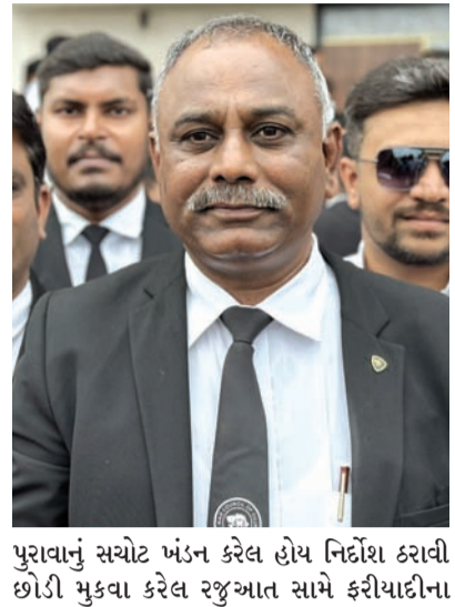
પુરાવાનું સચોટ ખંડન કરેલ હોય નિર્દોશ કરાવી છોડી મુકવા કરેલ રજુઆત સામે ફરીયાદીના