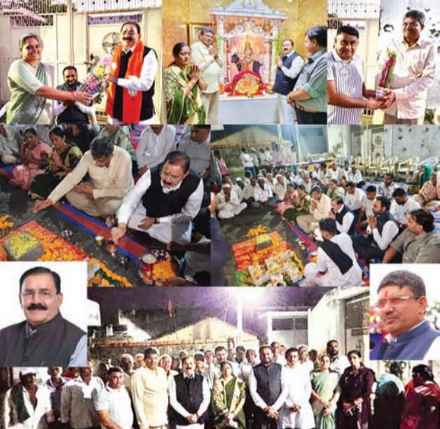
સુવિધાઓ સાથે સારું શૈક્ષણિક વાતાવરણ ઉપલબ્ધ થશે. રામભાઈ મોકરીયાની આ પહેલ માત્ર બાળકોના ભવિષ્ય માટે જ નહીં પરંતુ સમગ્ર ગામના વિકાસ માટે એક મહત્વપૂર્ણ પગલું સાબિત થશે. ફાડદંગ ગામના બાળકોને અદ્યતન સુવિધાઓ સાથેનું શિક્ષણ-મિત્ર વાતાવરણ પ્રાપ્ત થશે. આ પહેલથી ગામના બાળવિકાસ સાથે સાથે સમગ્ર સમાજમાં શિક્ષણ પ્રત્યેનો

રાજકોટ, તા. ૨૯ આંગણવાડીને માત્ર બાળ સંભાળનું કેન્દ્ર નહીં પરંતુ બાળકોના સર્વાંગી વિકાસની પ્રથમ શાળા છે. ત્યારે રાજ્યના દરેક બાળકને ગુણવત્તાયુક્ત શિક્ષણ તથા અદ્યતન સુવિધાઓવાળું અનુકૂળ વાતાવરણ મળી રહે એ ધ્યેય સાથે ફાડદંગ ગામમાં સ્માર્ટ આંગણવાડી નિર્માણ માટે રાજ્યસભા સાંસદ રામભાઈ મોકરીયાની સાંસદ નિધિમાંથી ૧૨ લાખ રૂપિયાની ગ્રાન્ટ માંથી આંગણવાડી ભવનના નવા બિલ્ડિંગનું ખાતમુહૂર્ત કરાવ્યું હતું.