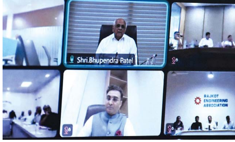
રાજકોટ અભિયાનથી સ્થાનિક કારીગરો અને વેપારીઓને વધુ સારી કમાણી થશે તેમજ વોકલ ઈકોનોમીમાં સુધારો થશે તેવી આશા વ્યક્ત કરી હતી.

સ્થાનિક રોજગાર સાથે "આત્મનિર્ભર ભારત" માટે બૂસ્ટર ડોઝ સમાન બનશે તેવો વિશ્વાસ પણ વ્યક્ત કરવામાં આવ્યો હતો. આ તહે રાજકોટ ચેમ્બર ઓફ કોમર્સ એન્ડ ઈન્ડસ્ટ્રીઝના પ્રમુખ વી. પી. વૈષ્ણવે જણાવ્યું હતું કે, કેન્દ્ર સરકારે જી.એસ.ટી.માં સુધારણા કરીને ચાર સ્લેબમાંથી બે સ્લેબ કર્યા છે, જેના કારણે દેશભરમાં આનંદની લાગણી ફેલાઈ છે. આ સુધારણાથી આવનારા દિવસોમાં વેપારના વિવિધ ક્ષેત્રો, ફૂડ તથા ઉદ્યોગ ક્ષેત્રોને મોટો ફાયદો થશે. સર્વાંગી વિકાસ માટેનું આ ઉત્તમ પગલું કદી શકાય તેમ છે. આ સાથે તેમણે જી.એસ.ટી. ઘટાડાનો લાભ સામાન્ય લોકો સુધી પહોંચાડવા માટે રાજકોટના વેપારીઓ અને ઉદ્યોગકારોને અપીલ કરી હતી. ઉપરાંત "આત્મનિર્ભર ભારત" અને "સ્વદેશી" અપનાવવા અંગે વડાપ્રધાન નરેન્દ્રભાઈ મોદીએ કરેલી અપીલને રાજકોટના એમ.એસ.એમ.ઈ. અનુસરીને પોતાનું યોગદાન આપે તેવી અપીલ પણ તેમણે કરી હતી.