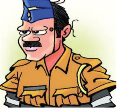
આવતો યુવક તેની ઓળખ કાઈમબ્રાંચના અધિકારી ગઢવી તરીકે ઓળખ આપે છે.

કારને રોકીને પોતાની ઓળખ કાઈમબ્રાંચના અધિકારી તરીકે આપતા અસલી પોલીસે આઈ કાર્ડ માંગતા તે ત્યાંથી છટકી ગયો હતો. સુગ્રોના જણાવ્યા મુજબ પોલીસની ઓળખ આપીને લોકો પાસેથી નાણાં પડાવતો વ્યક્તિએ સિંધુ ભવન અને આસપાસના વિસ્તારમાં અનેક લોકોને ટારગેટ કર્યા હતા. ત્યારે હવે નકલી પોલીસને પકડવા માટે અસલી પોલીસને સુચના આપવામાં આવી છે. સિંધુભવન રોડ પર કાઈમબ્રાંચના નામે નકલી પોલીસ બનીને યુવકની તોડબાજી! ૨ - ચૂં ફિંશહેરના સિંધુ ભવન,રાજપથ રંગોલી રોડ અને એસ પી રીંગ રોડ પર છેલાં ઘણાં સમયથી એક વ્યક્તિ કાઈમબ્રાંચના સ્ટાફની ઓળખ આપીને એકલ દોકલ વાહનચાલકોને રોકીને ચેકિંગ કરવાના નામે તેમજ લાયસન્સ અને અન્ય કાગળો માંગીને ડારાવ્યા બાદ મોટો દંડ કે કેસમાં કરવાની ધમકી આપીને તોડબાજી કરતો હોવાની વાત સામે આવી છે. કાળા કલસરા નંબર પ્લેટ વિનાના બાઈક પર