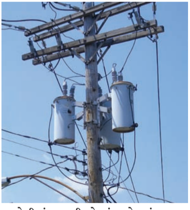
અમરેલીમાં ૬૬ ફીડરો બંધ હોવાનું જાણવા મળ્યું છે જે આંકડો ૫૧૫ ને પાર પહોંચ્યો છે એમ કુલ ૫૩૧ ફીડરો હાલ બંધ હોવાનું

રાજકોટ, તા. ૨૯ રવિવારે સમગ્ર સૌરાષ્ટ્ર પંથકમાં વરસાદી માહોલ જોવા મળ્યો હતો અને મેઘરાજાએ ગણતરીની કલાકોમાં જ પાણી-પાણી કરી દીધું હતું ભારે વરસાદના પગલે પીજીવીસીએલની કામગીરીમાં પણ ભારે અવરોધ ઊભો થયો હતો અને સૌરાષ્ટ્ર કચ્છના કુલ ૫૩૧ ફીડરો બંધ થયા હોવાનું માલુમ પડ્યું છે જ્યોતિગ્રામ યોજના અંતર્ગત કુલ ૧૫ ફીડરો બંધ થયા છે જેમાં બોટાદ અને જૂનાગઢમાં ચાર ચાર, અમરેલીમાં છો અને પોરબંદરમાં એક ફીડર બંધ થયું હોવાનું માલુમ પડ્યું છે. બીજી તરફ એગ્રીકલ્ચર ફીડરોની વાત કરવામાં આવે તે સૌથી વધુ જૂનાગઢમાં ૧૧૧ ફીડરો બંધ છે ત્યારબાદ જામનગરમાં ૧૦૪, પોરબંદરમાં ૯૪, ભુજમાં આઠ, અંજારમાં ૫૮, ભાવનગરમાં ૬૨, બોટાદમાં બાર તથા