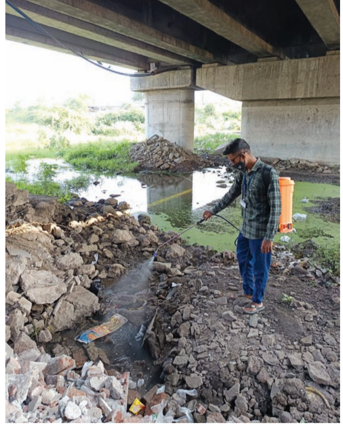
મચ્છર જન્ય રોગચાળા દ્વારા ઊભા થતા જાહેર આરોગ્ય પડકારને પહોંચી વળવા માટે રાજકોટ મહાનગરપાલિકા દ્વારા તમામ સ્તરે ઘનિષ્ઠ પ્રયાસો કરી રહ્યા છે. વાહક નિયંત્રણની કામગીરી હેઠળ પોરોનાશક કામગીરી હાથ ધરવામાં આવી હતી. ૩૪૮૭૯ ઘરોમાં પોરોનાશક કામગીરી કરવામાં આવેલ છે તથા ફિલ્ટરવર્ક દ્વારા ૯૨૫ ઘરોમાં ફોર્મી ગ કામગીરી કરેલ છે. મચ્છરની વનતા વધુ હોય તેવા વિસ્તારોમાં વહિકલ માઉન્ટેન ફોર્મી ગ મશીન ફોર્મી ગ કામગીરી કરવામાં આવે છે. તથા સંવેદનશીલ સોસાયટી, જાહેર સ્તરોમાં તથા વધુ માનવસમુદાય એકઠો થતો હોય તેવા તમામ વિસ્તારો ફોર્મી ગ કામગીરી હેઠળ આવરી લેવામાં આવેલ છે. મચ્છર ઉત્પતિ સબળ રહેણાંકમાં ૩૦૦ અને કોર્મશીયલ ૧૦૨ આસામીને નોટીસ આપવામાં આવેલ છે તથા ૯ આસામી પાસેથી રૂ.૪૧૦૦નો વહીવટી ચાર્જ વસુલવામાં આવેલ હતો.

રાજકોટ, તા. ૨૯ છેલ્લા બે દિવસથી રાજકોટ શહેર સહિત સમગ્ર સોરાષ્ટ્ર કચ્છમાં હાલ વાદળછાયુ વાતાવરણ જોવા મળી રહ્યું છે અને તેના કારણે રોગચાળામાં પણ ઉછાળો જોવા મળ્યો છે મહાનગરપાલિકા ના આરોગ્ય વિભાગ દ્વારા આ મુદ્દાને ગંભીરતાથી ધ્યાને લઈ ડેન્જુ ડેન્જુ રોગચાળા ધરવામાં આવ્યું હતું જેમાં ડેન્જુનાં નવા ૫ કેસ તથા શરદી - ઉધરસ ૮૬૭, સામાન્ય તાવનાં ૭૬૯, ઝાડા - ઉલ્ટીનાં ૧૦૯, ટાઇફોઇડનાં ૨ અને કમળાનાં ૩ નવા કેસ નોંધાતા મચ્છર ઉત્પતિ સબળ ૪૦૨ આસામીઓને નોટીસ ફટકારી સ્થળ પર ૪૧૦૦નો વહીવટી ચાર્જ વસુલવામાં આવ્યો હતો. અત્યારે વરસાદી ઋતુને ધ્યાને લઈ હાલ ઘણા ખરા પ્રશ્નો ઊભા થઈ રહ્યા છે ત્યારે તમામ મુદ્દાઓને ધ્યાને લઈ હાલ આરોગ્ય વિભાગ દ્વારા ઘર-ઘરે એ વાતની પણ તપાસ કરવામાં આવે છે કે પાણીજન્ય અથવા તો મચ્છરજન્ય રોગોથી કોઈ પીડાતું તો નથી ને પરંતુ હાલ જે આંકડા સામે આવ્યા છે તે અત્યંત ચોંકાવનારા છે જેના પર દરેકે જાન કેન્દ્રિત કરવાની ખૂબ જરૂર છે અને યોગ્ય યત્નસાધના તંત્ર દ્વારા ઉભી કરવામાં આવે તે પણ એટલી જ આવશ્યક છે.