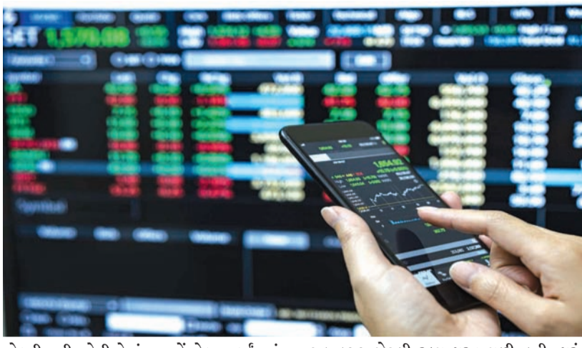
મોકલી હતી. જેથી તેમાં પણ મેં રોકાણ કર્યું હતું. જુદા જુદા બેંક એકાઉન્ટમાં મેં કુલ રૂ.૧.૪૭ કરોડ ઇન્વેસ્ટ કર્યા હતા. જેની સામે મને માત્ર ૩૮,૮૦૦ જેટલી રકમ પરત મળી હતી. પરંતુ ત્યારબાદ એકાઉન્ટમાં નકો વધુ દેખાતું હોવા છતાં રકમ મળતી ન હોવાથી શંકા ગઈ હતી.