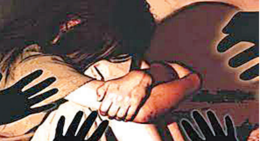
જાણ માતાને થતાં ઝઘડો થયો ત્યારે પિતાએ કિશોરી અને તેની માતા બંનેને જાનથી મારી

કિશોરી પર તેના જ સાવકા પિતાએ બળાત્કાર ગુજાર્યોનો ચોકાવનારો બનાવ સામે આવ્યો છે. પીડિતાની માતા લગભગ પંદર વર્ષ પહેલાં તેના પહેલા પતિને છોડીને પિયરમાં આવી ગઈ હતી. તે સમયે ઠિકરીની ઉંમર માત્ર એક વર્ષ હતી. બાર વર્ષ પહેલાં, આ મહિલાએ ઘર નજીક રહેતા રાહડોડ પરિવારના એક યુવક સાથે લગ્ન કર્યા હતા, જેણે ઠિકરીની જવાબદારી સ્વીકારી હતી. ઠિકરી જ્યારે ધોરણ -૬ માં અભ્યાસ કરતી હતી, ત્યારથી જ સાવકા પિતાની દાનત બગાડી હતી. શરૂઆતમાં તે ઠિકરી સાથે સૂતી વખતે શારીરિક છેડતી કરતો હતો. ઠિકરીએ માતાને ફરિયાદ કરતા આરોપીએ સપનું આવતું હોવાનું બહાનું બતાવી વાત ટાળી દીધી હતી. આ પછી બે વર્ષ પહેલાં, ઘરે કોઈ ન હોવાનો લાભ લઈને નરાધમ સાવકા પિતાએ કિશોરી પર જબરદસ્તી બળાત્કાર ગુજાર્યો હતો. આ ઘટનાની