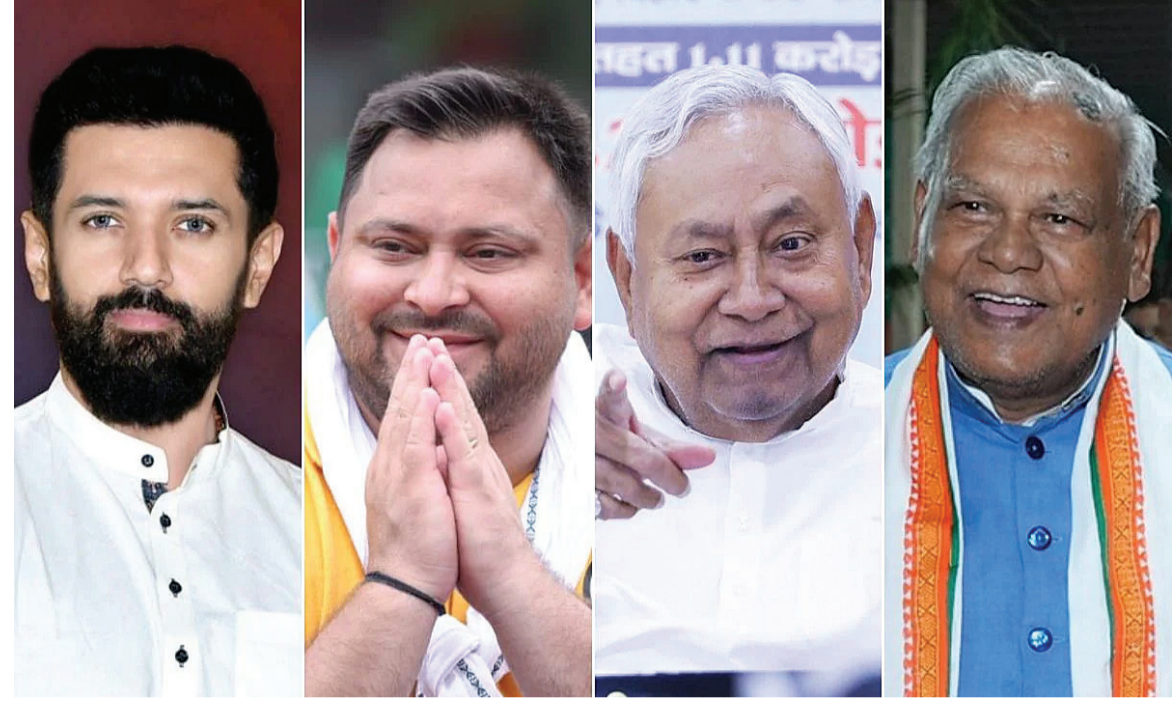
મતદાન થવાનું છે. ૨૦૨૦ની ચૂંટણીઓના આધારે, મહાગઠબંધને આ જિલ્લાઓમાં NDA કરતાં વધુ બેઠકો મેળવી હતી. ૧૮ જિલ્લાઓમાંથી છમાં, મહાગઠબંધન NDA જીત્યું હતું. મહાગઠબંધનનું પ્રદર્શન નોંધપાત્ર હતું કારણ કે તે મોટા જિલ્લાઓમાં જિલ્લામાં મહાગઠબંધન જીત્યું હતું અને છમાં NDA જીત્યું હતું, જ્યારે NDA નાના જિલ્લાઓમાં

નવીદિલ્હી, તા. ૮ બિહાર વિધાનસભા ચૂંટણી માટે બ્યુગલ વાગી ગયો છે. ચૂંટણીની તારીખો જાહેર થઈ ગઈ છે. મતદાન બે તબક્કામાં થશે. ચૂંટણીની તારીખોની જાહેરાત પછી પણ, બિહારમાં બંને મુખ્ય ગઠબંધનોમાં બેઠકોની વહેંચણીની વાટાઘાટો તીવ્ર બની છે, પરંતુ બેઠકોની ફાળવણીનો મુદ્દો ઘટક પક્ષો વચ્ચે ગુંચવાયેલો રહે છે. મહાગઠબંધન અને NDAમાં તણાવ ઊંચો રહે છે, હજુ સુધી કોઈ જાહેરાત થઈ નથી. ૧૮ જિલ્લાઓમાં ૧૨૧ બેઠકો માટે પ્રથમ તબક્કામાં મતદાન થશે. આ બધા જિલ્લાઓમાં ચૂંટણી ગતિવિધિઓ તીવ્ર બની છે, પરંતુ મુખ્ય પક્ષોએ હજુ સુધી તેમના ઉમેદવારોની જાહેરાત કરી નથી. પરિણામે, બેઠકો અંગે રાજકીય પરિસ્થિતિ અસ્પષ્ટ રહે છે. પ્રથમ તબક્કામાં જે ૧૮ જિલ્લાઓમાં મતદાન થશે, તેમાં એક જિલ્લો એવો છે જ્યાં શાસક NDA છે તે ચૂંટણીમાં પોતાનું ખાતું પણ ખોલવામાં નિષ્ફળ ગયું હતું.