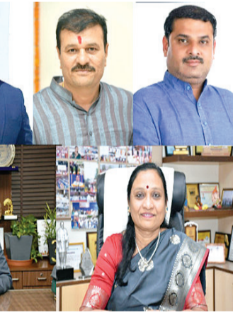
અભિયાનને વેગ આપવો. સ્થાનિક ઉદ્યોગકારો, હસ્તકલાકારો અને નાના વ્યવસાયકારોને વેચાણ અને પ્રદર્શન માટે પ્લેટફોર્મ પૂરું પાડવું. નાગરિકોને સ્વદેશી ઉત્પાદનોના ઉપયોગ માટે પ્રેરિત કરવું. સ્વરોજગાર અને

રાજકોટ, તા. ૮ દેશના આત્મનિર્ભર ભારતના સ્વપનને સાકાર કરવા અને સ્થાનિક ઉદ્યોગો, હસ્તકલા, લઘુ કારીગરો તેમજ મહિલા સ્વ સહાય જૂથોને પ્રોત્સાહિત કરવા માટે રાજકોટ મહાનગરપાલિકા દ્વારા કાલથી તા.૧૫-૧૦-૨૦૨૫ સુધી સ્વદેશી મેળા-૨૦૨૫ શોપિંગ કેસ્ટિવલનું ભવ્ય આયોજન કરવામાં આવ્યું છે. સ્વદેશી મેળા-૨૦૨૫ શોપિંગ કેસ્ટિવલ રાજકોટ શહેરના નાગરિકોને સ્વદેશી ઉત્પાદનો, હસ્તકલા, પરંપરાગત વાગીઓ અને સ્થાનિક ઉદ્યોગોની ઝાંખી કરાવવાનો અનોખો પ્રયત્ન છે. મેડ ઇન ઈન્ડિયા અને વોકલ ફોર લોકલ