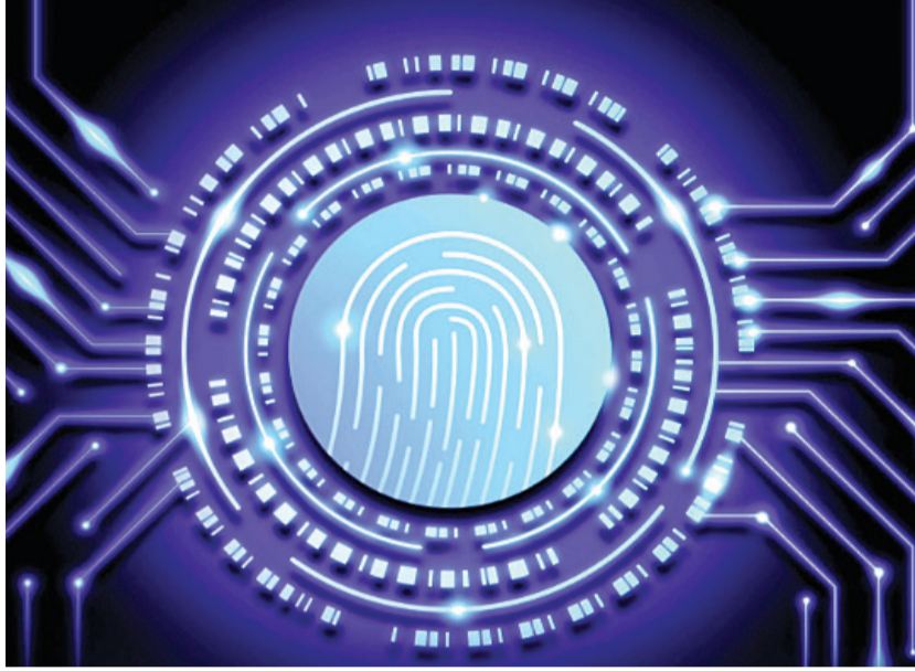
જેમાં રાષ્ટ્રીય સ્તરે અંદાજે ૧.૨૦ કરોડથી વધુ ગુનેગારોનો ડેટા સંગ્રહાયેલો છે. ગુજરાત પોલીસ પણ આ સિસ્ટમમાં સક્રિયપણે યોગદાન આપી રહી છે, જેમાં રાજ્યના ૨૨ લાખથી વધુ

રાજકોટ, તા. ૮ ગુજરાત પોલીસે આધુનિક ટેકનોલોજીના ઉપયોગથી સ્માર્ટ અને પ્રોફેશનલ પોલીસિંગની દિશામાં વધુ એક ઝગલું ભર્યું છે. નેશનલ ઓટોમેટેડ ફિંગરપ્રિન્ટ આઈડન્ટિફિકેશન સિસ્ટમ (NAFIS) નામક પોર્ટલનો ઉપયોગ કરીને ગુજરાત પોલીસે આ વર્ષે સપ્ટેમ્બર સુધીમાં ૮૦ જેટલા મહત્વના ગુનાઓના ભેદ ઉકેલવામાં સફળતા મેળવી છે, જે ગુજરાત પોલીસની ટેક-પોલીસિંગની દિશામાં વધુ એક સિદ્ધિ દર્શાવે છે. રાજ્યના પોલીસ વડા વિકાસ સહાયે જણાવ્યું છે કે, આ પ્રકારની ટેકનોલોજીનો ઉપયોગ ગુના ઉકેલવાની પ્રક્રિયાને વધુ ઝડપી અને સચોટ બનાવશે. ગુજરાત પોલીસ સ્માર્ટર અને પ્રોફેશનલ પોલીસિંગ માટે ટેકનોલોજીનો ઉપયોગ કરવા માટે કટિબદ્ધ છે.