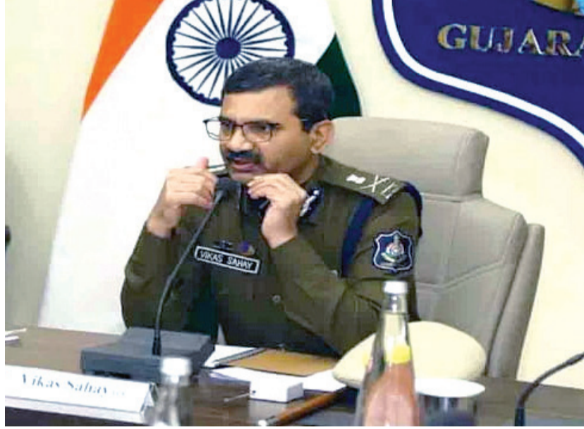
ઉદ્ઘાટન તાજેતરમાં સામે આવ્યું છે, જેમાં અમદાવાદના એક ગુનાનો આરોપી મુંબઈથી

માત્ર ૪૮ કલાકમાં ઝડપાયો હતો. અમદાવાદના ગાયકવાડ હવેલી પોલીસ સ્ટેશનની હદમાં નોંધાયેલા એક કેસમાં જ્યારે ઘટનાસ્થળેથી ફિંગરપ્રિન્ટ લેવામાં આવી અને તેને NAFISમાં અપલોડ કરવામાં આવી, ત્યારે તેનું મેચિંગ થતાં જ સીધો મેસેજ રાજ્યના પોલીસ વડા વિકાસ સહાયને મળ્યો. તુરંત જ, ગુજરાતના DGP વિકાસ સહાય દ્વારા મુંબઈ પોલીસ કમિશનરનો સંપર્ક કરવામાં આવ્યો અને આરોપી અંગેની વિગતો શેર કરવામાં આવી. આ ઝડપી સંકલન અને કાર્યવાહીના પરિણામે, મુંબઈ પોલીસે માત્ર ૪૮ કલાકમાં આરોપીને શોધી કાઢ્યો અને તેને ગુજરાત પોલીસને સોંપ્યો હતો. ગુજરાત પોલીસના આ ટેક-આધારિત અભિગમ આધારે આરોપી મુંબઈથી પકડાઈ ગયો. મુંબઈ પોલીસે આરોપીને ૪૮ કલાક શોધીને ગુજરાત પોલીસને સોંપી દેતા રાજ્યના પોલીસ વડા વિકાસ સહાય દ્વારા મુંબઈ પોલીસની આ સમગ્ર ટીમને અભિનંદન પાઠવીને પ્રશંસાપત્ર સુપ્રત કરવામાં આવ્યું છે.