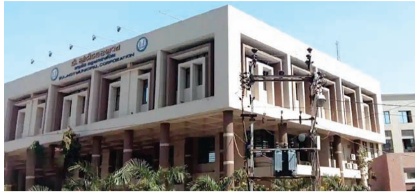
ચર્ચા પણ હાલ દિલ્હી ખાતે કરવામાં આવે તો નવાઈ નહીં. સૂત્રો દ્વારા મળતી માહિતી મુજબ લોકસભા ચૂંટણીમાં જે રીતે કોંગ્રેસ અને આમ આદમી પાર્ટી નું જોડાણ હતું તે હવે સ્થાનિક સ્વરાજ્યની ચૂંટણીમાં જોવા નહીં મળે તેવા પણ સંકેતો પ્રદેશ કક્ષાએથી અને સ્થાનિક કક્ષાએથી મળી રહ્યા છે પરંતુ આ અંગે હજુ કોઈ સ્પષ્ટ ચિત્ર સામે આવ્યું નથી પરંતુ જરૂરી એ જ છે કે જો કોંગ્રેસ આગળ વધવા માંગતી હોય તો સ્થાનિક મુદ્દાઓને ધ્યાને