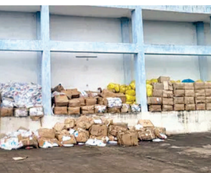
ગયો હતો. નોંધનીય છે કે, ગુજરાત મેડિકલ સર્વિસ કોર્પોરેશન લિમિટેડના વેર હાઉસમાંથી રાજકોટ સિવિલ હોસ્પિટલ, મોરબી અને જૂનાગઢ જિલ્લાની તમામ સરકારી હોસ્પિટલોને દવાઓનો જથ્થો પૂરો પાડવામાં આવી રહ્યો છે. આ અગાઉ

રિપોર્ટના આધારે બેદરકારી દાખવનાર હંગામી સ્ટોર મેનેજરને સસ્પેન્ડ કરી દઈ ખાનગી એજન્સીના સિનિયર કાર્મસીસ્ટ, પેકર્સ, પ્યુન અને કોઈનાસના એક કર્મચારીને પરભેગા કરી દેવા હુકમ કર્યો છે. આ હુકમને પગલે ખાનગી એજન્સીના અન્ય ત્રણ કર્મચારીઓએ રાજીનામું ધરી દીધાનું સામે આવ્યું છે. આ મામલે કુલ ૧૦ સામે કાર્યવાહી કરવામાં આવી છે. પ્રાપ્ત વિગતો મુજબ સપ્ટેમ્બર-૨૦૨૪માં રાજકોટના મોરબી રોડ ઓવરસિજ પાસે આવેલ ગુજરાત મેડિકલ સર્વિસ કોર્પોરેશન લિમિટેડના વેર હાઉસમાં સ્થાનિક સ્ટાઇનની બેદરકારીને કારણે સતત બીજા વર્ષે લાખો રૂપિયાની દવાઓનો જથ્થો પલળી જતા દેકારો બોલી