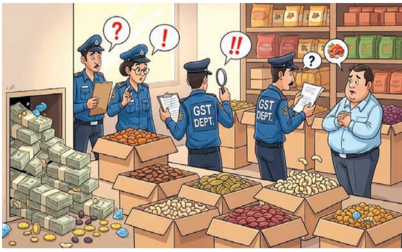
કડક સૂચનાને પગલે રાજ્યવ્યાપી દરોડાને પગલે રાજકોટમાં અમદાવાદથી આવેલી એન્ફોર્સમેન્ટ ટીમને શ્રીરામ ફટકાડાના કાળીપાટ નજીક આવેલા ગોડાઉન અને કેનાલ રોડ પર આવેલી

શ્રીરામ ફટકાડા, ગાંધીધામમાં રામવાણી ગ્રુપ, મોરબીમાં વેભવ તેમજ અમદાવાદના ત્રણ સુરતના ચાર વડોદરા ના બે તથા જામનગરના એક વેપારીને મળી કુલ ૧૪ જગ્યાઓ પર અમદાવાદની અન્વેષણ વિભાગની ટીમ દ્વારા દરોડા પાડવામાં આવ્યા છે અને તપાસનો ધમધમાટ પણ જોવા મળી રહ્યો છે.. અપેક્ષા છે કે આ તમામ જગ્યાઓ માં વેપારીઓ દ્વારા જીએસટીના બિલ વગર માલનું ખૂબ મોટા પ્રમાણમાં વેચાણ કરવામાં આવતું હતું ખાસ કરીને અંડર ઈન્વોઈસ બિલ બનાવીને ગેરરીતિ આચરવામાં આવતી હોવાનું પણ માલુમ પડ્યું છે.