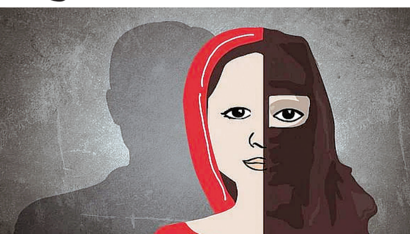
પ્રેમજાળમાં ફસાવી હતી. યુવાને પોતે કુંવારો છે તેમ જણાવી વિધ્વાસ ભો કર્યો હતો. મેડિકલ સ્ટોરમાં નોકરી કરતી યુવાન પરિણીતાના લગ્ન

લાલબત્તી સમાન આ ઘટના પર નજર કરીએ તો હિન્દુ પરિણીતાને મુસ્લિમ બનાવી ભચ્ચમાં બે સંતાનોના પિતાએ અપરિણીત હોવાનું કહી હિન્દુ પરિણીતા સાથે નિકાહ કરી લઈ તેની જિંદગી બગાડી છે. ભચ્ચની એક હોસ્પિટલના ડોક્ટરના ડ્રાઇવર તરીકે નોકરી કરનાર વિધર્મી બે સંતાનના પિતાએ પોતે અપરિણીત છે તેમ કહી હોસ્પિટલના મેડિકલ સ્ટોરમાં નોકરી કરતી પરિણીતાને પ્રેમજાળમાં ફસાવી અમદાવાદમાં નિકાહ કરી હિન્દુ યુવતીને મુસ્લિમ બનાવી વડોદરા અને અજમેરની હોટલોમાં શારીરિક શોષણ કરી તડછોડી મુકતા સમગ્ર મામલો પોલીસ મથકે પહોંચ્યો હતો. પોલીસ સુત્રોએ જણાવ્યું હતું કે શહેરના મધ્યમાં આવેલી એક હોસ્પિટલમાં ડોક્ટરના ડ્રાઇવર તરીકે નોકરી કરતા મકતમપુર વિસ્તારના મુસ્લિમ યુવકે હોસ્પિટલના મેડિકલ સ્ટોરમાં નોકરી કરતી અનુસૂચિત જાતિની પરિણીતાને