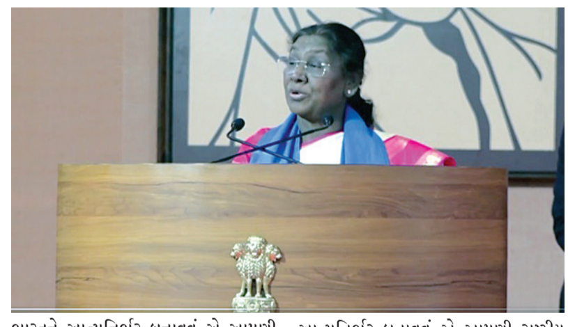
ભારતને આત્મનિર્ભર બનાવવું એ આપણી રાષ્ટ્રીય પ્રાથમિકતા છે અને વિદ્યાર્થીઓને રાષ્ટ્રીય સ્વદેશી અભિયાનમાં સક્રિય ભૂમિકા ભજવવા વિનંતી કરી હતી. રાષ્ટ્રપતિએ જણાવ્યું હતું કે ભારતને

અમદાવાદ, તા. ૧૧ ભારતના રાષ્ટ્રપતિ, દ્રોપદી મુર્મુ ગઈકાલે અમદાવાદ ખાતે ગુજરાત વિદ્યાપીઠના ૭૧મા દીક્ષાંત સમારોહમાં ઉપસ્થિત રહ્યા હતા. આ પ્રસંગે, રાષ્ટ્રપતિએ ગુજરાત વિદ્યાપીઠને રાષ્ટ્રનિર્માણ અને આત્મનિર્ભરતાના જીવંત આદર્શોનું ઐતિહાસિક પ્રતીક ગણાવ્યું હતું. તેમણે કહ્યું કે ગુજરાત વિદ્યાપીઠનું પરિસર આપણા સ્વતંત્રતા સંગ્રામના આદર્શોની પવિત્ર ભૂમિ છે. તેમણે મહાત્મા ગાંધીની પવિત્ર સ્મૃતિને શ્રદ્ધાંજલિ આપી હતી. રાષ્ટ્રપતિએ નોંધ્યું કે ગુજરાતમાં સ્વરોજગારની સંસ્કૃતિ લાંબા સમયથી અસ્તિત્વમાં છે. તેમણે સ્વરોજગાર અને સ્વનિર્ભરતાને પ્રોત્સાહન આપવાની ગુજરાતની સંસ્કૃતિને દેશભરમાં ફેલાવવાની જરૂરિયાત પર ભાર મૂક્યો હતો. તેમણે વિશ્વાસ વ્યક્ત કર્યો કે ગુજરાત સંસ્કૃતિક આંદોલન બની ગઈ છે તેમાં વડાપ્રધાનની સંસ્કૃતિના પ્રણેતા બનશે. તેમણે કહ્યું કે