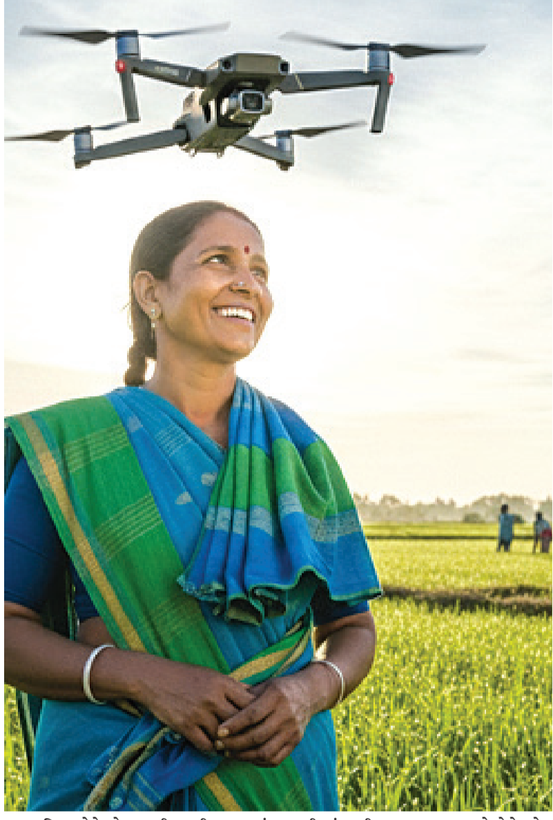
૫૮ મહિલાઓને ડ્રોન તાલીમ પૂરી પાડવામાં આવી હતી. આગામી એક વર્ષમાં ગુજરાતના સખી મંડળની વધુ ૧,૦૨૪ બહેનોને ડ્રોન તાલીમ આપવામાં આવશે. ડ્રોન ખરીદીમાં સહાય

અત્રે નોંધનીય છે કે, ગુજરાતમાં નમો ડ્રોન દીદી યોજનાના પ્રારંભિક તબક્કે વર્ષ ૨૦૨૩-૨૪માં કેટલીક ફટકાઓ ડ્રોન દીદી દ્વારા પોતાના ઈચ્છુ ફંડમાંથી સખી મંડળની આ મહિલાઓને ડ્રોન પૂરા પાડવામાં આવ્યા હતા. જેમાં IFFCO દ્વારા ૧૮, GNFC દ્વારા ૨૦ અને GSFC દ્વારા ૨૦ એમ કુલ મળી ૫૮ ડ્રોન તથા