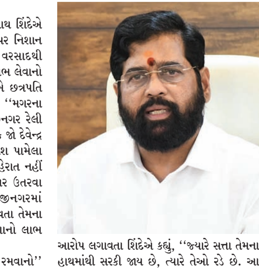
આરોપ લગાવતા શિંદેએ કહ્યું, “જ્યારે સત્તા તેમના હાથમાંથી સરકી જાય છે, ત્યારે તેઓ રેડે છે. આ વિપક્ષ પર “દુઃખ પર રાજકારણ રમવાનો”

નવીદિલ્હી, તા. ૧૧ મહારાષ્ટ્રના નાયબ મુખ્યમંત્રી એકનાથ શિંદેએ શનિવારે શિવસેના પ્રમુખ ઉદ્ભવ ઠાકરે પર નિશાન સાધ્યું હતું અને તેમના પર પૂર અને વરસાદથી પ્રભાવિત ખેડૂતોની દુર્દશાનો રાજકીય લાભ લેવાનો આરોપ લગાવ્યો હતો. શિવસેના પ્રમુખે છત્રપતિ સંભાજનગરમાં પૂર્વ મુખ્યમંત્રીની રેલીને “મગરના આંસુ” ગણાવી હતી. છત્રપતિ સંભાજનગર રેલી દરમિયાન ઠાકરેએ ચેતવણી આપી હતી કે જો દેવેન્દ્ર ફડણવીસ સરકાર તાજેતરના પૂરમાં નાશ પામેલા પાક માટે “સંપૂર્ણ લોન માફી” ની જાહેરાત નહીં કરે, તો ખેડૂતો તેમની વિરુદ્ધ રસ્તા પર ઉતરવા મજબૂર થશે. શિંદેએ છત્રપતિ સંભાજનગરમાં ઠાકરેની રેલીને “મગરના આંસુ” ગણાવતા તેમના પર રાજકીય લાભ માટે ખેડૂતોની દુર્દશાનો લાભ લેવાનો આરોપ લગાવ્યો હતો.