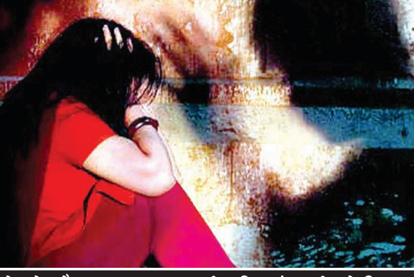
હવે જાહેર શૌચાલય પણ સલામત નથી: મહિલા અંદર હતી અને વિકૃત ઢગો ચોરીછુપીથી જોતો તો: દેકારો થતાં મહિલાના પતિએ પકડી પોલીસને સોંપે