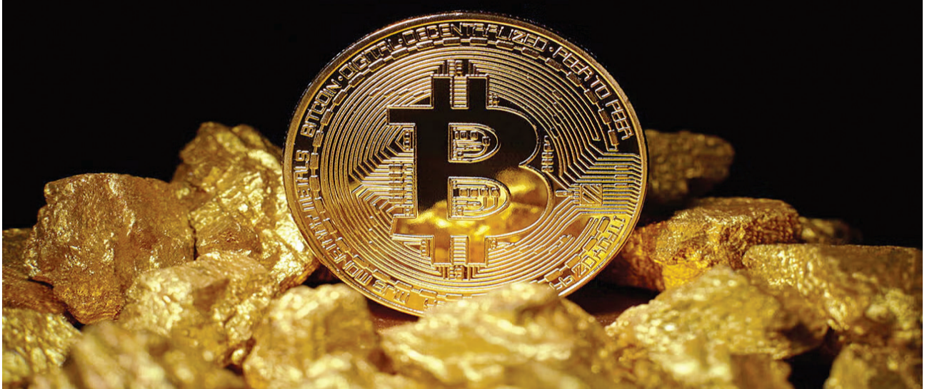
ઘરમાં નડતર દુર કરવા ધાર્મિક વિધીના નામે ગઈયો વૃદ્ધાના ઘણીના ઉસેડી ગયો