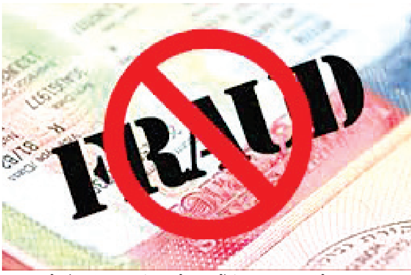
કારવાણ ગામે સિંધવાઈ માતાના મંદિર પાસે રૂ. ૮,૫૦,૦૦૦ રોકડા ચૂકવ્યા હતા. બાદમાં અલગ અલગ ટ્રાન્ઝેક્શન દ્વારા રોકડ અને ઓનલાઈન