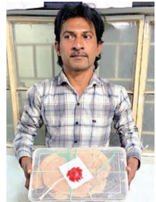
વર્ષનો છે તેની પાસે ગાંજો છે અને આ શખ્સ હાલ ઘરમાં હાજર છે. આ ભાતમી પરથી ટીમ પહોંચતા અફઝલ મળી આવ્યો હતો. તપાસ કરતાં ડા. ૯૯૬૦નો ૯૯૯ ગ્રામ ૯૦૦ મીલીગ્રામ ગાંજો મળી આવતાં

રાજકોટ તા. ૧૪ શહેરમાં દાડની સાથે સાથે માદક પદાર્થની હેરાફેરી પણ થતી રહે છે. બંધાણીઓને આવો માલ પુરો પાડવા નવા જુના પેડલરો પટમાં આવી હેરાફેરી કરતાં રહે છે. મોટે ભાગે એસએચ આ પ્રકારના કેસમાં પેડલરોને એમટી, ગાંજો સહિતના પદાર્થ સાથે પકડે છે. પણ આ વખતે ભક્તિનગર પોલીસે મુળ ધોરાજીના શખ્સને ગાંજાના જથ્થા સાથે પકડી લીધો છે. જેનું પગે જુનાગઢ તરફ નીકળ્યું છે. રાજકોટમાં ભાડાના મકાનમાં રહેતો ધોરાજીનો મુસ્લિમ શખ્સ છુટક ગાંજો જુનાગઢ તરફથી લાવી અહિં પડીકીઓ બનાવીને બંધાણીઓને વેંચતો હતો. વિગતો પર નજર કરીએ તો શહેરમાં વધુ એક વખત માદક પદાર્થ