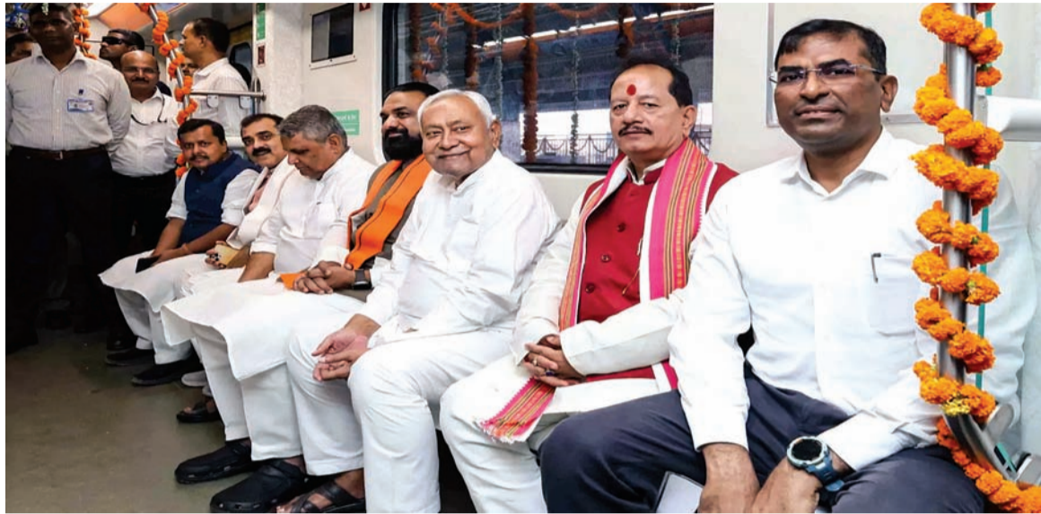
જાતિ સમીકરણના આધારે, JDU યાદીમાં ૧૨ દલિત ઉમેદવારો, ૯ કુર્મી ઉમેદવારો, ૬ કુશવાહ ઉમેદવારો, ૩ ધાનુક ઉમેદવારો, ૬ ભૂમિહાર ઉમેદવારો, ૫ રાજપૂત ઉમેદવારો, ૧ કાયસ્થ ઉમેદવાર, ૧ બ્રાહ્મણ ઉમેદવાર, ૫ વૈશ્ય ઉમેદવારો અને ૨ નિષાદ ઉમેદવારોનો સમાવેશ થાય છે. JDU ઉમેદવારોની યાદી સ્પષ્ટપણે CM નીતિશ કુમારના સામાજિક ઇજનેરીને પ્રતિબિંબિત કરે છે. તે સ્પષ્ટ છે કે, થોડી બેઠકો સિવાય, નીતિશ કુમારે બિહારમાં યાદવ બહુમતી જાતિને અવગણી છે અને ટાળી છે.

નવીદિલ્હી, તા. ૧૫ બિહાર વિધાનસભા ચૂંટણી માટે શાસક JDU (JDU) પાર્ટીએ બુધવારે ઉમેદવારોની પોતાની પહેલી યાદી જાહેર કરી. JDUએ કુલ ૫૭ ઉમેદવારોના નામ જાહેર કર્યાં. મુખ્યમંત્રી નીતિશ કુમારે પોતાની પાર્ટીની પહેલી યાદીમાં જાતિ સમીકરણને સંતુલિત કરવા માટે તમામ પ્રયાસો કર્યાં છે. લવ-કુશ (અથવા કુર્મી-કુશવાહ) જાતિઓને JDU ની પરંપરાગત વોટ બેંક માનવામાં આવે છે. JDU ઉમેદવારોની યાદીમાં આ જાતિઓ પર ખાસ ધ્યાન આપવામાં આવ્યું છે અને મોટી સંખ્યામાં ટિકિટો ફાળવવામાં આવી છે. જોકે, આચર્યજનક રીતે, યાદીમાં એક પણ મુસ્લિમ ઉમેદવાર નથી. નીતિશ કુમાર ભાજપ સાથે જોડાણ કરીને બિહારમાં સત્તામાં છે, અને આ યાદી સ્પષ્ટપણે ભાજપની હિન્દુત્વ નીતિ પ્રત્યે તેમનું વલણ દર્શાવે છે. ચૂંટણીના થોડા દિવસો પહેલા, નીતિશ કુમારે એક કાર્યક્રમમાં મુસ્લિમ ટોપી પહેરવાનો ઇન્કાર કર્યો હતો, અને આ હવે JDU યાદીમાં પ્રતિબિંબિત થાય છે.