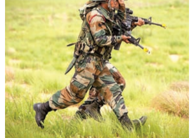
નવીદિલ્હી, તા. ૧૫

કેન્દ્રીય પ્રધાન રાજનાથ સિંહે શિક્ષણ ક્ષેત્રે ભૂતપૂર્વ સૈનિકોના પરિવારોને પણ રાહત આપી શિક્ષણ અનુદાનમાં ₹૧,૦૦૦ થી વધારીને ₹૨,૦૦૦ પ્રતિ માસ કરવાની જાહેરાત કરી