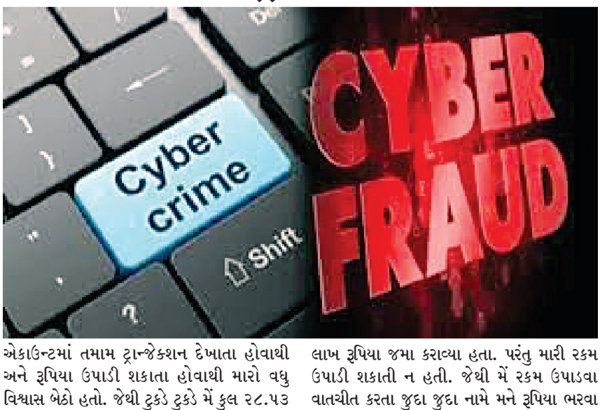
એકાઉન્ટમાં તમામ ટ્રાન્ઝેક્શન દેખાતા હોવાથી અને રૂપિયા ઉપાડી શકાતા હોવાથી મારો વધુ વિશ્વાસ બેઠો હતો. જેથી ટુકડે ટુકડે મેં કુલ ૨૮.૫૩ લાખ રૂપિયા જમા કરાવ્યા હતા. પરંતુ મારી રકમ ઉપાડી શકાતી ન હતી. જેથી મેં રકમ ઉપાડવા વાતચીત કરતા જુદા જુદા નામે મને રૂપિયા ભરવા