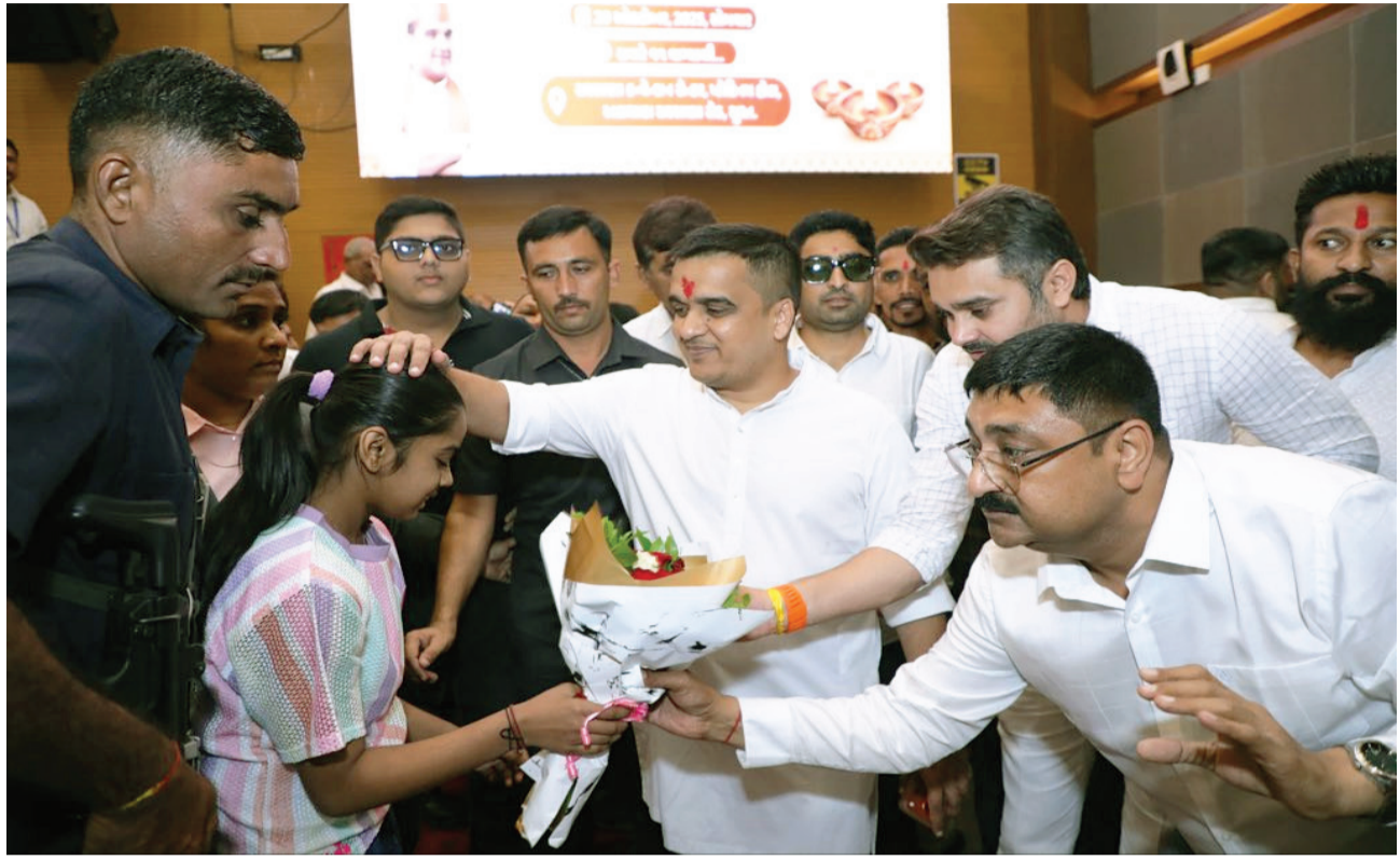
નડ્યો હોય એવો દાખલો નથી. હર્ષ સંઘવીએ આપરો નહીં, માત્ર તમારા આશીર્વાદ આપજો. કોઈ સુખી થયું નથી, પરંતુ જેની મદદ કરશો તે પ્રશુ થશે તો મને લાગશે કે કંઈ સારું થયું છે.

રાજકોટ, તા. ૨૦ નાયબ મુખ્યમંત્રી બન્યા બાદ હર્ષ સંઘવી પહેલી વાર પોતાના વતન સુરત આવ્યા હતા. સરસાણા કન્વેન્શન હોલ ખાતે સર્વ સમાજ દિવાળી સ્નેહમિલન કાર્યક્રમ યોજાયો હતો. જેમાં હર્ષ સંઘવીએ જનતાનો હૃદયપૂર્વક આભાર માન્યો. તેમણે જણાવ્યું કે આપનું અભિવાદન જિલવા નહીં, પરંતુ આશીર્વાદ લેવા આવ્યો છું. તેમણે ઉમેર્યું કે ઘણા ભાઈઓએ તેમને સમાજસેવાના પાઠ ભણાવ્યા છે, જ્યારે અનેક સાથીઓએ જીવનના સંઘર્ષના સમયમાં મહત્વનો ફાળો આપ્યો છે. હર્ષ સંઘવીએ કહ્યું કે તમે ખોબલેને ખોબલે મન આપી મને વિદ્યાનસભામાં મોકલ્યો, અને સાથે મને 'મજૂરાનો મિત્ર' તરીકે ઓળખ આપ્યો. તેમણે જણાવ્યું કે તેઓ એક સામાન્ય કાર્યકર્તા તરીકે કામ કરતા હતા અને આજે નાયબ મુખ્યમંત્રી પદ સુધી પહોંચ્યા છે જેના માટે ભાજપના શીર્ષ નેતૃત્વ અને લોકોનો આભાર માનું છું. મને માત્ર હર્ષ કહીને બોલાવજો, મારું નામ પાછળ કોઈએ ભાઈ કે સાહેબ લગાવવાનું નથી. હું નથી ઈચ્છતો કે દિલના સંબંધો વચ્ચે કોઈ હોદ્દો આવે, એમ કહીને તેમણે સોના દિલ જીતી લીધા. નાયબ મુખ્યમંત્રીએ વધુમાં જણાવ્યું કે સત્તા માથા પર નાખી ચઢાવવા માટે નથી, પરંતુ લોકોની મદદ માટે છે. તેમણે સ્પષ્ટ શબ્દોમાં કહ્યું કે મારાથી થાય તેટલી મદદ કરી છે, કોઈને