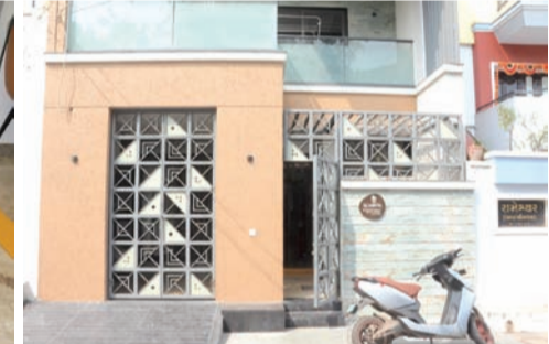
પરિવારના તમામ સભ્યો ચોપડા પૂજનની વિધીમાં રોકાયેલા હોઈ ઘર રેડું હતું

દુકાને ચોપડા પુજનની વિધી રાખી હોઈ સાંજે સાડા સાતેક વાગ્યે મારા પિતાજી તથા માતા ઘરેથી દુકાને જવા નીકળ્યા હતાં. થોડીવાર બાદ હું, મારા પત્નિ અને બહેન પણ દુકાને જવા નીકળ્યા હતાં. અમે નીકળ્યા ત્યારે ઘરના દરવાજા બંધ કરી તાળા લગાવ્યા હતાં. રાતે સાડા અગીયારેક વાગ્યે ચોપડા પૂજન વિધી પૂર્ણ થતાં અમે બધા ઘરે આવવા નીકળ્યા હતાં. સૌ પહેલા હું અને મારા પત્નિ ઘરે પહોંચ્યા હતાં. પરંતુ ઘરના દરવાજાના તાળાની ચાવીમ દા મમ્મી પાસે હતી. તેઓ પણ પાછળ પાછળ ઘરે આવતાં હોઈ જેથી મેં મારુ ટુવ્વેલર ઘર પાસે ઉભુ રાખ્યું હતું અને થોડીવાર મેં અને મારા પત્નિએ મારા મમ્મી આવે તેની રાહ જોઈ હતી.