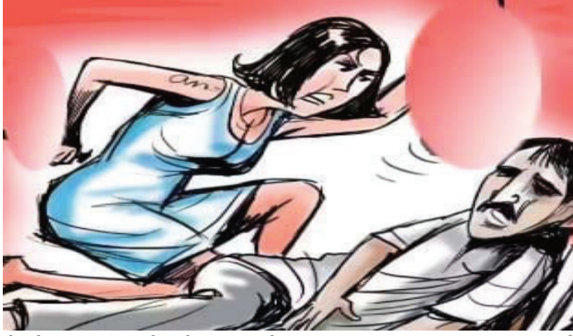
પોલીસે ફરિયાદના આધારે ગુનો દાખલ કરીને કાયદાકીય તપાસ હાથ ધરી હતી. આ ઘટનાએ હુમલો કરનાર પત્નિની ધરપકડ સહિતની વધુ બાંધકામી કરવાની દીધી હતી.

અન્ય સ્ત્રી સાથેના આડાસંબંધોની આશંકાએ રોષે ભરાયેલી પત્નિએ આ ખતરનાક કૃત્યને અંજામ આપ્યો હતો. મળતી માહિતી મુજબ સેટેલાઈટ વિસ્તારમાં રહેતા આ દંપતીના બે વર્ષ પહેલા પ્રેમલગ્ન થયા હતા. જોકે, છેલ્લા કેટલાક સમયથી પત્નિને તેના પતિના ચારિત્ર્ય પર શંકા હતી. તેને આશંકા હતી કે પતિના અન્ય સ્ત્રી સાથે અનૈતિક સંબંધો છે. આ જ વાતથી રોષે ભરાઈને પત્નિએ પોતાના પતિ દિવાળીની રાત્રે જ્યારે પતિ સૂતો હતો. ત્યારે પહેલા તેના પર ગરમ પાણી નાખ્યું અને ત્યારબાદ એસિડનો હુમલો કરી દીધો. એસિડ એટેકના કારણે યુવક ગંભીર રીતે દાઝી ગયો હતો. તેને તાત્કાલિક સારવાર માટે નજીકની હોસ્પિટલમાં ખસેડવામાં આવ્યો છે, જ્યાં તેની હાલત નાજુક હોવાનું જાણવા મળી રહ્યું છે. આ ઘટના અંગે ઈજાગ્રસ્ત પતિએ પત્નિ વિરૂધ્ધ પોલીસ ફરિયાદ નોંધાવી છે. સેટેલાઈટ