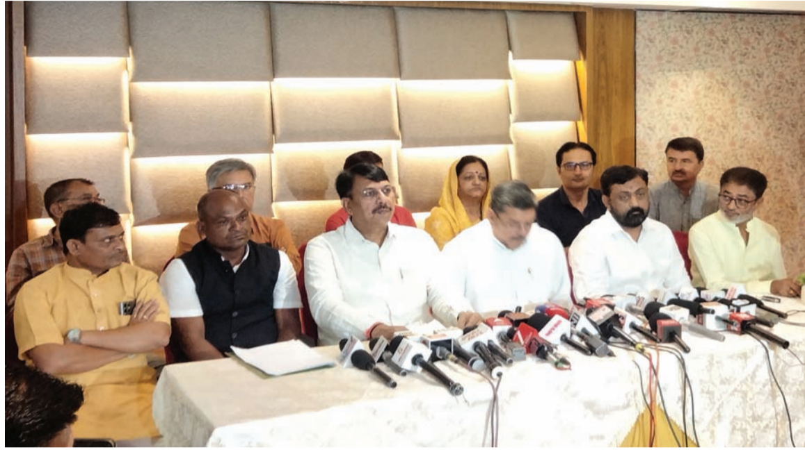
ગુજરાતના ૩૮૧ ખેડૂતોએ ટૂંકાવ્યું જીવન

પ્રદેશ અધ્યક્ષ અમિત ચાવડાના ભાષણ પર ચાબખાં : ખેડૂતોને પુરતા ભાવ મળવા જ જોઈએ : રાજ્ય પ્રભારી મુકુલ વાસનિકે કહ્યું રાજકોટમાં કાનુન વ્યવસ્થા સંપૂર્ણપણે ખાકે અને દારૂની તો હોમ ડિલિવરી