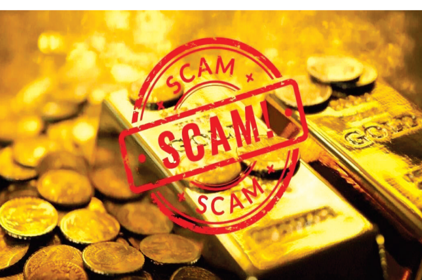
આરોપીઓએ પેમેન્ટના અવેજ તરીકે ૨૪ કેરેટનું ૫૫ ચક્રાવેલ ૧૦૦-૧૦૦ ગ્રામની ડુબેકેટ સોનાની બિસ્કીટો આપી દીધા હતા. આ બિસ્કીટોને પરા