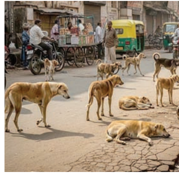
કોર્ટમાં હાજર રહેવાની મંજૂરી આપવામાં આવે. બેન્ચે ૨૨ ઓગસ્ટના આદેશનું પાલન ન કરવા બદલ નારાજગી વ્યક્ત કરી અને નોંધ્યું કે, ૨૭

ઓક્ટોબર સુધીમાં, પશ્ચિમ બંગાળ, તેલંગાણા અને દિલ્હી મ્યુનિસિપલ કોર્પોરેશન (MCD) સિવાય કોઈપણ રાજ્ય કે કેન્દ્રશાસિત પ્રદેશ પાલન સોગંદનામું દાખલ કર્યું નથી. તેમાં સ્પષ્ટતા કરવામાં આવી હતી કે મુખ્ય સચિવે કોર્ટ સમક્ષ હાજર થઈને સમજાવવું પડશે કે તેમણે પાલન સોગંદનામું કેમ દાખલ કર્યું નથી. બેન્ચે નોંધ્યું હતું કે ૨૭ ઓક્ટોબરના રોજ જ્યારે કેસની સુનાવણી થઈ ત્યારે ફક્ત પશ્ચિમ બંગાળ, તેલંગાણા અને MCD એ જ પાલન સોગંદનામું દાખલ કર્યું હતું. ૨૭ ઓક્ટોબરના રોજ, સુપ્રીમ કોર્ટે આ મામલે પાલન સોગંદનામું દાખલ ન કરનારા રાજ્યો અને કેન્દ્રશાસિત પ્રદેશોને કપકો આપ્યો હતો,