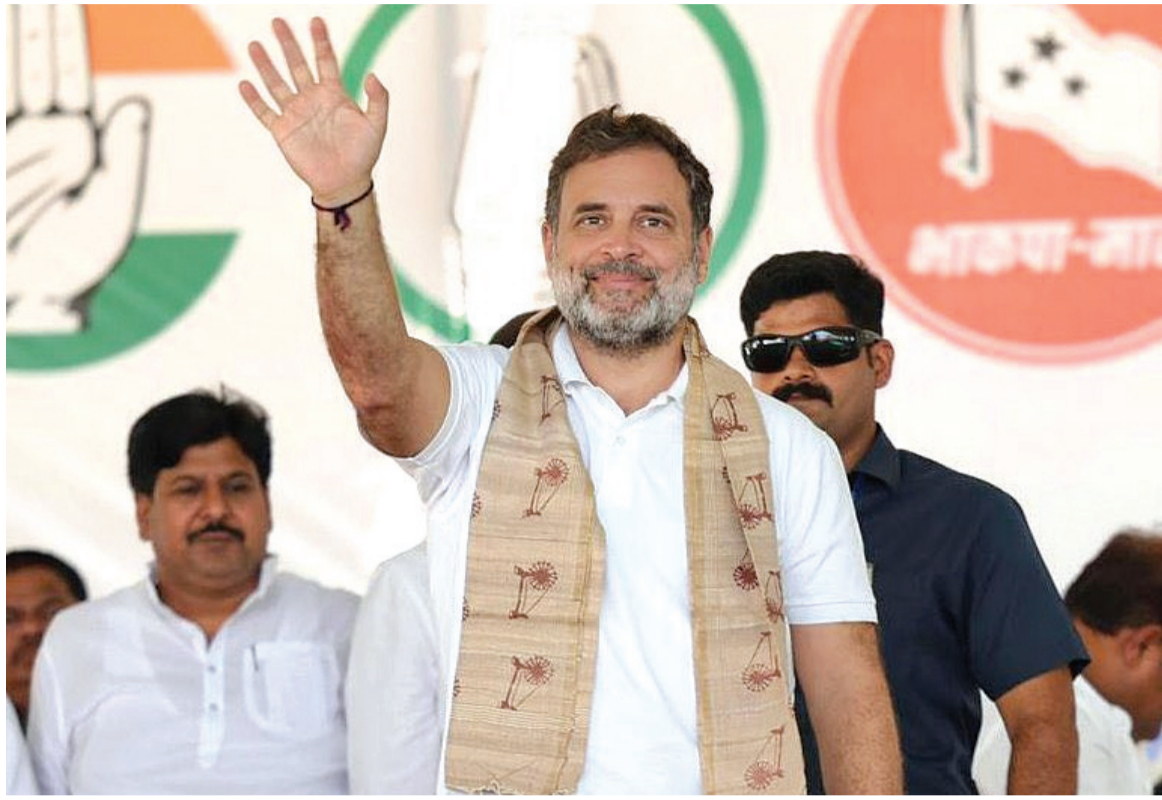
તેમને પોતાના નિયંત્રણમાં રાખે છે. રાહુલ ગાંધીએ વધુમાં કહ્યું કે વડા પ્રધાન મત માટે કંઈ પણ કરી શકે છે. તેમને યોગ કરવાનું કહ્યું

નવીદિલ્હી, તા. ૨ બિહારમાં ચૂંટણીના પહેલા તબક્કા માટે માત્ર ત્રણ દિવસ બાકી છે, અને તમામ રાજકીય પક્ષોએ તેમની સંપૂર્ણ તાકાત લગાવી દીધી છે. આજે વડા પ્રધાન મોદીએ બિહારના પટનામાં રેલી યોજી હતી, જ્યારે રાહુલ ગાંધીએ બેંગુસરાયમાં કોંગ્રેસ પાર્ટીના ઉમેદવાર માટે રણશિંગ્યું ફૂંક્યું હતું. વધુમાં, મુખ્યમંત્રી નીતિશ કુમાર, આરજેડી નેતા તેજસ્વી યાદવ અને અન્ય ઘણા અગ્રણી નેતાઓ પણ બિહારમાં ચૂંટણી રેલીઓ કરી રહ્યા છે. લોકસભામાં વિરોધ પક્ષના નેતા અને કોંગ્રેસના સાંસદ રાહુલ ગાંધીએ બેંગુસરાયમાં કહ્યું, “બિહારમાં અમારું મહાગઠબંધન સત્તામાં આવશે, અને અમે તમને શ્રેષ્ઠ શિક્ષણ પ્રદાન કરીશું. હું તમને વ્યક્તિગત રીતે ખાતરી આપું છું કે જે દિવસે કેન્દ્રમાં મહાગઠબંધન સત્તામાં આવશે, ત્યારે અમે નાલંદા યુનિવર્સિટી જેટલી સારી યુનિવર્સિટી ખોલીશું. અમે એક યુનિવર્સિટી ખોલીશું જ્યાં વિશ્વભરના વિદ્યાર્થીઓ આવીને પ્રવેશ મેળવશે.” રાહુલ ગાંધીએ પોતાના ભાષણમાં સરકારમાં એક જાતિના વર્ચસ્વ પર પણ વાત કરી. તેમણે કહ્યું કે જો આપણે બિહારમાં સરકાર બનાવીશું, તો તે દરેક માટે સરકાર હશે, કોઈ ચોક્કસ જાતિ માટે નહીં. પીએમ મોદી પર પ્રહાર કરતા રાહુલ ગાંધીએ કહ્યું કે વડા પ્રધાન મોદી ટ્રમ્પથી ડરે છે અને પસંદગીના ઉદ્યોગપતિઓ