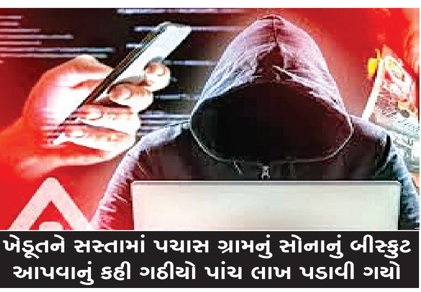
ખેડૂતને સરતામાં પચાસ ગ્રામનું સોનાનું બિસ્કીટ આપવાનું કહી ગઈયો પાંચ લાખ પડાવી ગયો