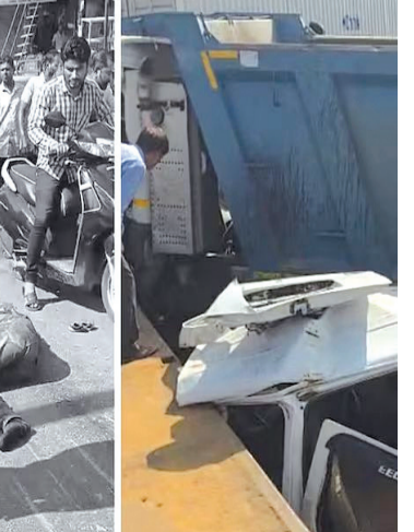
તેમના ટેમ્પો ટ્રાવેલરને અકસ્માત થયો હોવાના અહેવાલ છે. તેલંગાણાના રંગારેડી જિલ્લામાં પણ આજે સવારે એક દુ:ખદ અકસ્માત થયો.

મિર્ઝાગુડામાં એક TGSRTC બસને ટિપર ટ્રકે ટક્કર મારી. અકસ્માતમાં ૨૦ લોકોના મોત અને ૨૦ ઘાયલ થયાના અહેવાલ છે. માહિતી અનુસાર, આ અકસ્માત સવારે ૫ વાગ્યાની આસપાસ થયો હતો. કાંકરી ભરેલી લારી સાથે અથડાયા બાદ, બસ ઉપર અને અંદર કાંકરી ભરેલી હતી. આજે, રાજસ્થાનના જયપુરમાં બીજો એક દુ:ખદ અકસ્માત થયો. અહીં એક અનિયંત્રિત ડ્રમ્પરે ૧૦ વાહનોને ટક્કર મારી હતી. આ ઘટનામાં ઘણા લોકોના મોત થયા છે અને ઘણા ગંભીર રીતે ઘાયલ થયા છે. અત્યાર સુધીમાં ૧૪ લોકોના મોતની પુષ્ટિ થઈ છે. મૃત્યુઆંક વધુ વધી શકે છે. છેલ્લા એક મહિનામાં દેશમાં ઘણી જગ્યાએ દુ:ખદ અકસ્માતો થયા છે. આ અકસ્માતોમાં ૬૦ થી વધુ લોકોએ જીવ ગુમાવ્યા છે. આમાંના મોટાભાગના અકસ્માતો રાજસ્થાનમાં થયા છે.