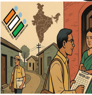
નવીદિલ્હી, તા. ૩

સ્પેશિયલ ઇન્ટેન્સિવ રિવિઝન (SIR) કવાયત ૪ નવેમ્બરથી દેશભરના ૧૨ રાજ્યો અને કેન્દ્રશાસિત પ્રદેશોમાં શરૂ થવાની છે. જોકે, ચૂંટણી પંચને પશ્ચિમ બંગાળથી લઈને તમિલનાડુ સુધીના રાજ્યો તરફથી વિરોધનો સામનો કરવો પડી રહ્યો છે. કોંગ્રેસ, ઝખઈ અને ઉપબંધ સહિત અનેક મુખ્ય વિપક્ષી પક્ષો આ પ્રક્રિયા પર સવાલ ઉઠાવી રહ્યા છે. ચૂંટણી પંચે આ વર્ષની શરૂઆતમાં બિહારમાં આ પ્રક્રિયા હાથ ધરી હતી અને હવે તે અન્ય ૧૨ રાજ્યોમાં તેનો અમલ કરી રહ્યું છે. તમિલનાડુના શાસક પક્ષ, DMK એ SIR સામે સુપ્રીમ કોર્ટમાં જવાનો નિર્ણય લીધો છે. મુખ્યમંત્રી એમકે સ્ટાલિને આ બાબતે અન્ય પક્ષો સાથે પણ બેઠક યોજી છે. તેમણે કહ્યું કે બેઠકમાં હાજર પક્ષોએ SIR સામે સુપ્રીમ કોર્ટમાં જવાનો કરાવ પસાર કર્યો છે. તમિલનાડુ વિધાનસભાની ચૂંટણી ૨૦૨૬ માં યોજવાની છે. તેમણે માંગ કરી છે કે આ પ્રક્રિયા ચૂંટણી પછી હાથ ધરવામાં આવે, પરંતુ ચૂંટણી પંચે આ સ્વીકાર્યું નથી. SIRના વિરોધમાં યોજાયેલી આ બેઠકમાં DMK, કોંગ્રેસ, માર્ક્સવાદી દ્રવિડ મુન્નેટ કઝગમ (MDMK),