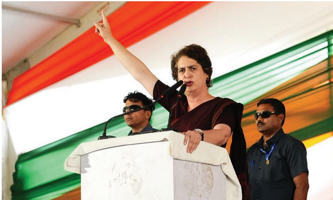
પ્રિયંકા ગાંધીએ કહ્યું હતું કે આ સરકાર યુવાનોને રોજગાર આપી રહી નથી. યુવાનો પરીક્ષા આપીને કંટાળી ગયા છે.

નવીદિલ્હી, તા. ૩ બિહાર ચૂંટણીમાં પ્રચાર માટે NDA એ તેના તમામ ટોચના નેતાઓને તેનાત કર્યા છે. આ દરમિયાન, મહાગઠબંધનના નેતાઓ પણ સત્તામાં પાછા ફરવા માટે અથાક મહેનત કરી રહ્યા છે. હવે, કોંગ્રેસ નેતા રાહુલ ગાંધી ઉપરાંત, પ્રિયંકા ગાંધી પણ ચૂંટણી મેદાનમાં ઉતર્યા છે. સોમવારે, તેમણે બિહારના સોનબરસામાં એક ચૂંટણી રેલી યોજી હતી, જ્યાં તેમણે NDA સરકાર પર જોરદાર નિશાન સાધ્યું હતું. તેમણે બેરોજગારી અને સ્થળાંતરને લઈને નીતિશ-મોદી ગઠબંધન પર પ્રહારો કર્યા હતા. પ્રિયંકા ગાંધીએ કહ્યું હતું કે બિહારના લોકો કામચલાઉ કામચલાઉ સુધી કામ કરવા માટે મુસાફરી કરે છે, કંઈ તહેવારોમાં તેમના પરિવારોને જોવા માટે. પ્રિયંકાએ કહ્યું હતું કે બિહારમાં કોઈ કામ નથી, ખેતીએ તેની આવક ગુમાવી દીધી છે, અને ખેડૂતો ખેતીમાંથી કંઈ કમાઈ શકતા નથી. બધું મોંઘું થઈ ગયું છે. પ્રિયંકાએ પ્રશ્ન કર્યો હતો કે, “જો સુરક્ષા કે રોજગાર નથી, તો તેમણે ૨૦ વર્ષમાં શું કર્યું?” પ્રિયંકાએ કહ્યું હતું કે તેમણે નાના વ્યવસાયો માટે કંઈ કર્યું નથી અને નોટબંધીથી તેમને વધુ અપંગ બનાવી દીધા છે.