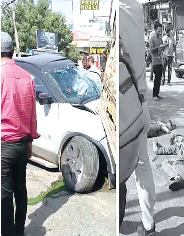
અચાનક. પંદર લોકો માર્યા ગયા અને બે ઘાયલ થયા. કોલાયતની મુલાકાત લઈને શ્રદાંજલિઓ જોધપુર પસંદ કરી રહ્યા હતા ત્યારે

આ અકસ્માત થયા ગામ નજીક થયો હતો. ૨૮ ઓક્ટોબરના રોજ, જયપુરના મનોહરપુર પોલીસ સ્ટેશન વિસ્તારમાં બીજો અકસ્માત થયો હતો. ટોડી ગામમાં, મજૂરોને લઈ જતી બસ હાઈ-ટેન્શન લાઈનના સંપર્કમાં આવી ગઈ, જેના કારણે બસને વીજ કરંટ લાગ્યો. બસમાં સવાર બે કામદારોના ઘટનાસ્થળે જ મોત થયા હતા, જ્યારે લગભગ એક ડઝન જેટલા લોકો ઠાંજી ગયા હતા. અહેવાલો અનુસાર, મજૂરોને લઈને બસ ઉત્તર પ્રદેશથી મનોહરપુરના ટોડીમાં એક ઈંટના ભડ્દામાં આવી રહી હતી. રસ્તામાં, બસ ૧૧,૦૦૦ વોલ્ટની ઓવરહેડ લાઈનના સંપર્કમાં આવી ગઈ, જેના કારણે બસમાંથી વીજળીનો પ્રવાહ વહેવા લાગ્યો અને આગ લાગી.